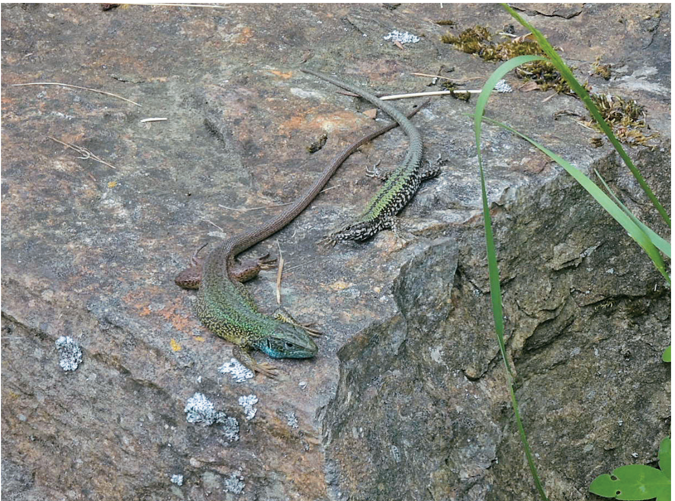
Abb. 10: Smaragdeidechse und Mauereidechse sonnen sich gemeinsam auf einem Stein an den Donauleiten.

Da es sich bei den in Passau ausgesetzten Eidechsen bereits um einen eingebrachten Hybrid handelt, ist dies sicher zusätzlich förderlich bei seiner Ausbreitung gewesen. Nicht unbedeutend, vor allem im Siedlungsbereich, dürfte sein, dass Mauereidechsen flinker und kletterfähiger als unsere einheimischen Zauneidechsen sind. Diese haben daher bei dem oft hohen Katzenbestand wenige Überlebenschancen. Mauereidechsen sind daher häufig die einzigen Eidechsen in Siedlungsbereichen (z.B. in Oberzell, ASSMANN unveröffentlicht).