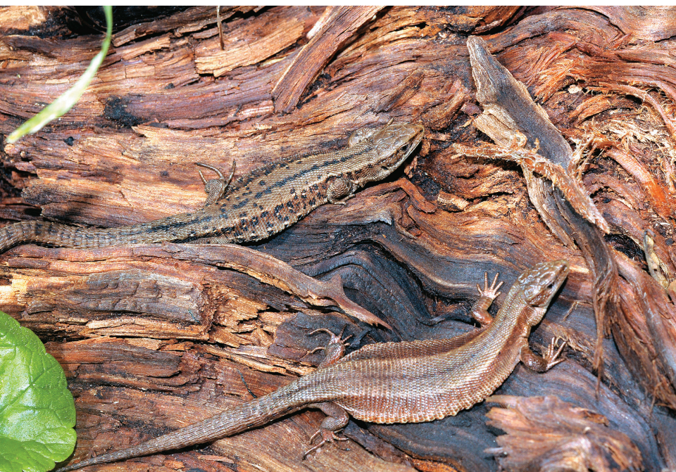
Abb. 4: Waldeidechsen sind recht unscheinbar braun gefärbt, meist nur mit schwachen Streifen- und Punktelementen; oben Männchen, unten Weibchen, auf dem Foto haben sie ihren Körper zum Sonnen stark abgeplattet.

die Mauereidechse in der deutschen Roten Liste als V (Vorwarnliste) aufgeführt. Wegen des begrenzten Vorkommens und ihrer Gefährdung werden die autochthonen Bestände der Mauereidechsen in Bayern in der Roten Liste Bayerns als „vom Aussterben bedroht“ (Rote Liste 1) aufgeführt.