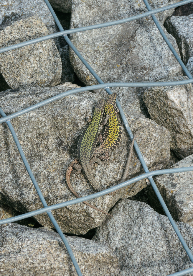
Abb. 6: Ein Mauereidechsenpaar auf einer Gabione bei einem Autohaus in Passau/Grubweg.