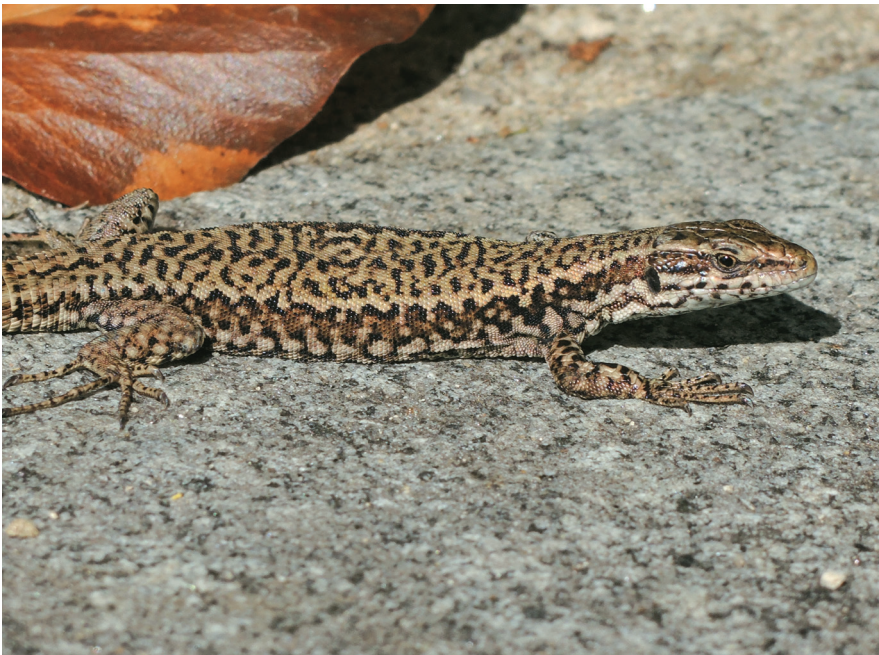
Abb. 5: Adulte, braune Mauereidechse an der Neuburg (Foto: Otto Aßmann).

Mindestens seit 1987 ist ein Vorkommen gebietsfremder Mauereidechsen bei Schärding (Oberösterreich) bekannt (SCHWEIGER et al. 2015). Ein noch isoliertes Vorkommen existiert im Bereich der Schlögenger Schlinge (WAITZMANN & SANDMEIER 1990). Beide Populationen könnten nach SCHULTE (2022) durch erneute Aussetzungen, Verschleppung oder Verdriftung (Schlößen) von Passauer Tieren stammen.