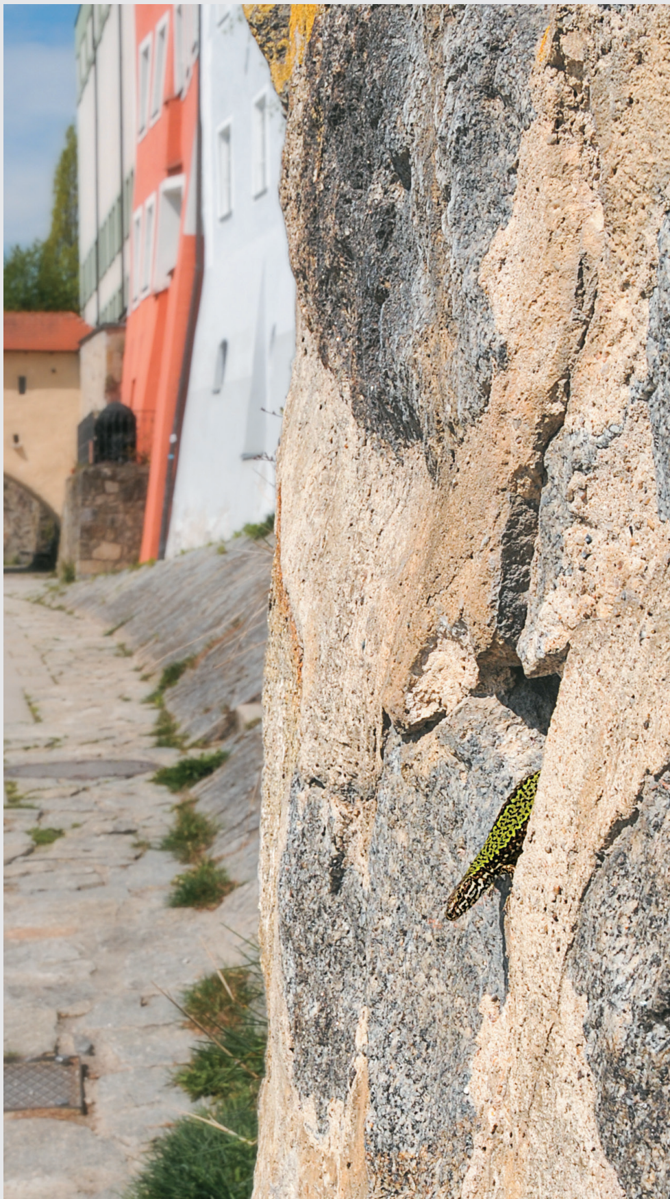
Abb. 11: Mauereidechse an ihrem Quartier in einer hohen Mauer am Innkai in Passau.