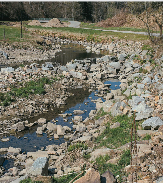
Abb. 7: Lebensraum von Mauereidechsen an den Ufern der Erlau.