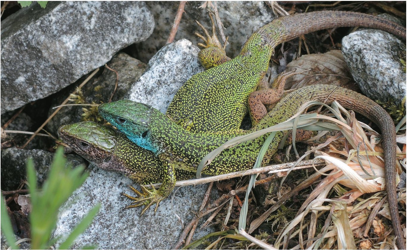
Abb. 2: Ein Pärchen der Östlichen Smaragdeidechse an den Donauleiten. Auch die Männchen dieser Art haben etwas kräftigere Köpfe und dazu noch eine leuchtend blaue Kehle in der Paarungszeit.

Bauch, das es bei den Smaragdeidechsen nicht gibt. Es gibt aber auch rein braune Mauereidechsen. Andere einheimische Arten, die mit der Mauereidechse verwechselt werden könnten, sind die Zauneidechse und die Waldeidechse, die auch als Bergeidechse bekannt ist (siehe Abb. 2, 3 und 4).