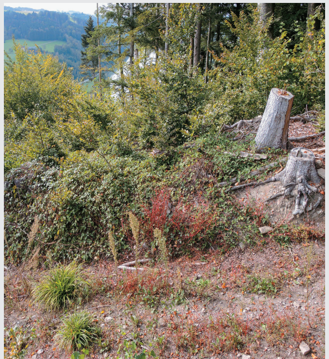
Abb. 9: Windwurf und Einhiebe wegen des Borkenkäfers haben in den Donauleiten zur Erweiterung von Lebensräumen geführt; hier ein Habitat in dem neben der Mauereidechse noch Smaragdeidechse, Schlingnatter und Äskulapnatter vorkommen.