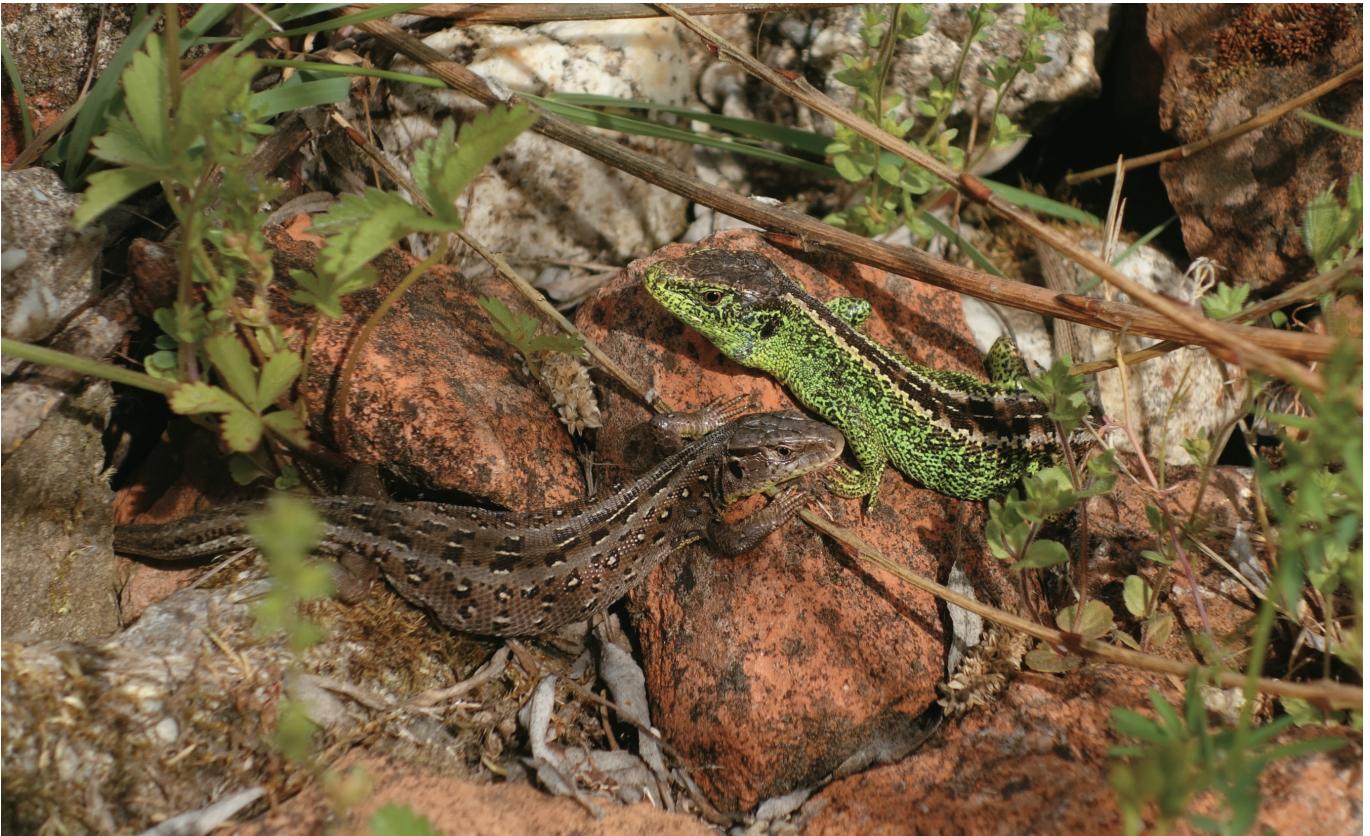
Abb. 3: Männchen und Weibchen der Zauneidechse sind zumindest in der Paarungszeit deutlich unterschiedlich gefärbt; rechts Männchen, links Weibchen, typisch für die Art sind auch die „Augenflecken“ (Foto: Andreas Zahn).

früher von den Aktivitäten des Menschen in der Kulturlandschaft essenziell profitiert, dies vor allem durch den Weinanbau entlang des Rheins und seinen Nebenflüssen. Heute wird