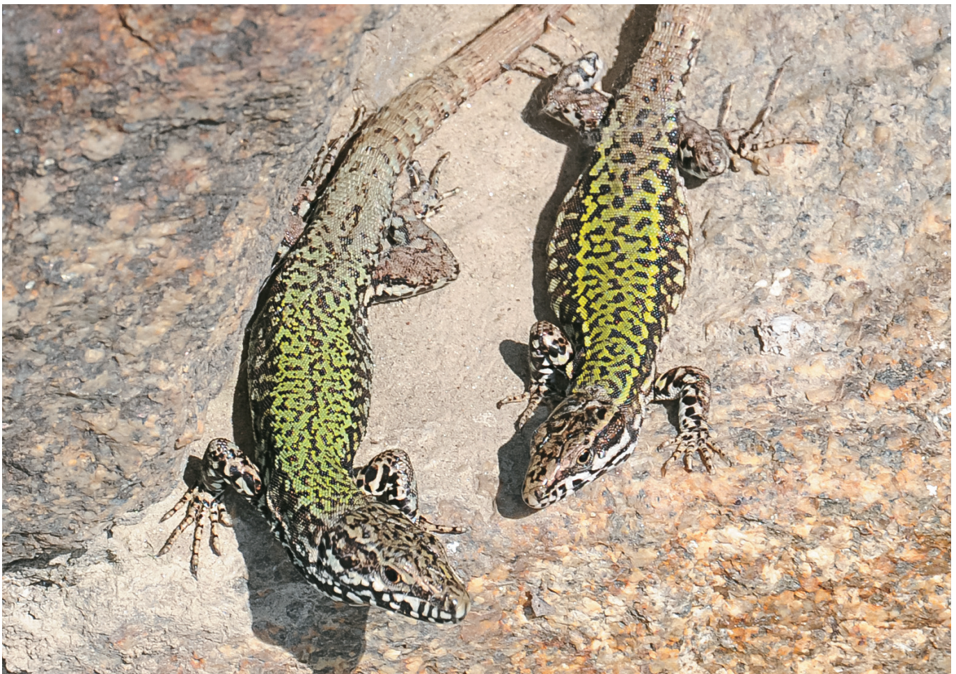
Abb. 1: Ein Pärchen Mauereidechsen an ihrem Quartier in einer Mauer am Innkai in Passau, links Männchen, mit etwas kräftigeren Kopf.

Da sie immer wieder mit anderen Eidechsen verwechselt wird, hier eine kurze Beschreibung: Mauereidechsen sind im Vergleich zur Zauneidechse relativ schlank, haben vergleichsweise spitze Köpfe und lang auslaufende, spitze Schwänze. Sie werden bis etwa 20 cm lang. Da die Männchen unserer Mauereidechsen oft auffallend grün sind, werden sie manchmal auch für Smaragdeidechsen gehalten. Abgesehen davon, dass Smaragdeidechsen viel größer werden, sind die männlichen Mauereidechsen meist dunkelgrün und haben ein netzartiges schwarz-weiß Muster an den Flanken und auf dem