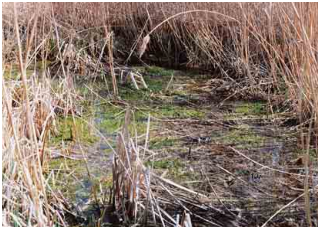
Abb. 5: Stark bewachsener Altweiher im Gebiet Obere Mähder

VERBREITUNG IM NSG: Die einzige Schlangenart des Gebietes profitiert von der guten Gewässer- (Weiher und Gräben) und der daraus resultierenden Beutetierdichte (Frösche). Im Gebiet Obere Mähder konnten insgesamt 4 ad. Weibchen und 2 ad. Männchen beobachtet werden. Beim Grossteil der Beobachtungen handelt es sich um Einzeltiere, welche sich in unmittelbarer Umgebung eines Riedgraben oder Weihers (Nr. 1 – 3) sonnten bzw. auf Beutefang waren. Ein weiterer Nachweis eines Einzeltieres gelang Herrn Eduard Hämmerle in einem Riedgraben „An der Furch“ im Gebiet Gsieg.