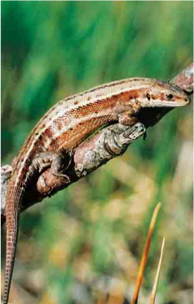
Abb. 4: Wald- / Mooreidechsenweibchen

VERBREITUNG IM NSG: Die Waldeidechse (Abb. 4) konnte im Untersuchungsgebiet an zwei Standorten nachgewiesen werden: einerseits an den Böschungen und umliegenden Rietwiesen im Gebiet Obere Mähder (hier kommt sie zusammen mit Zauneidechse und Blindschleiche vor) und andererseits im nördlichen Gsieg (Einzelfund von Eduard Hämmerle). Es gelangen insgesamt nur 10 Nachweise für diese Art. Das Vorkommen ist ebenfalls als „gefährdet“ einzustufen.