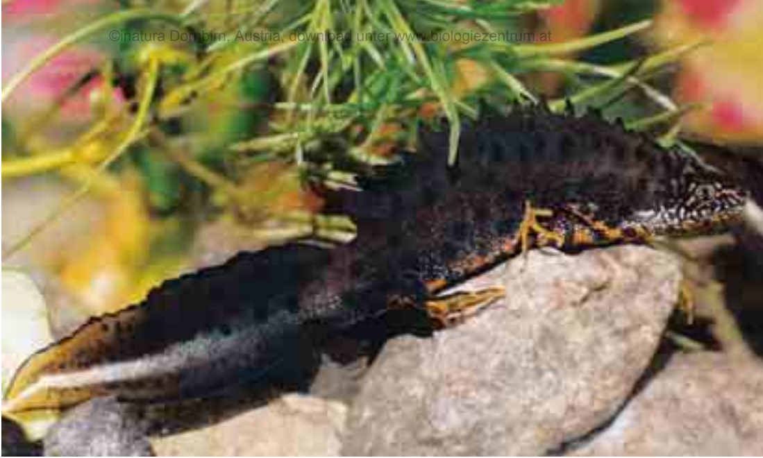
Abb. 2: Adultes Kammolchmännchen mit der typischen „Paarungstracht“