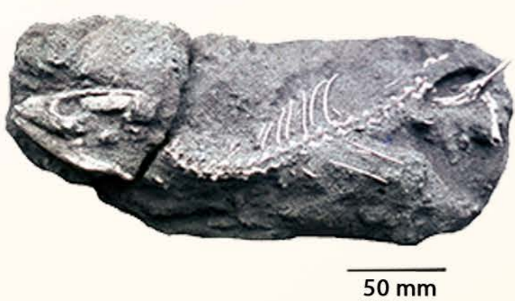
Figura 2. Arriba) Gallotia stehlini actual; abajo) esqueleto semicompleto de un subfósil de Gallotia stehlini .