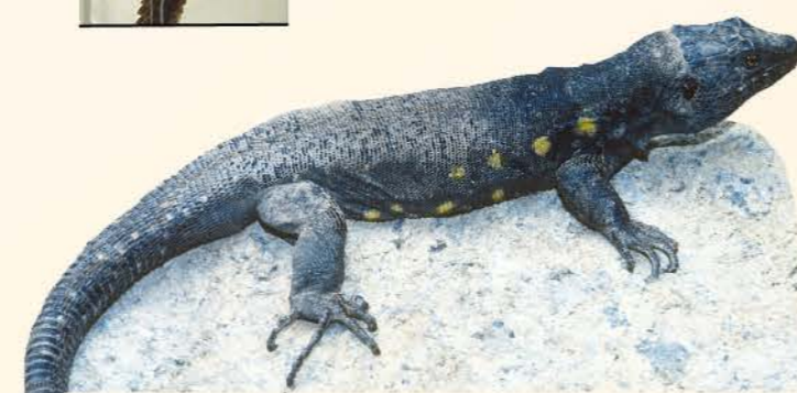
Figura 3. Arriba-izquierda) Lectotipo de Gallotia simonyi simonyi; arriba-derecha) maxilar derecho subfósil de G. simonyi machadoi ; abajo) G. simonyi machadoi actual