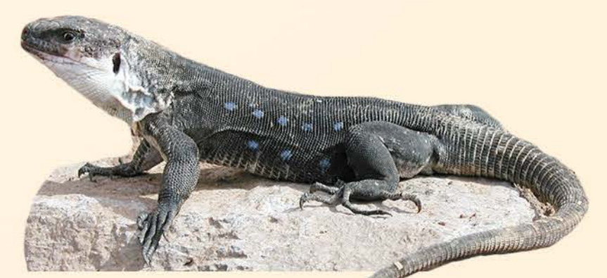
Figura 5. Arriba) Parietal de Gallotia bravoana subfósil; abajo) Gallotia bravoana actual.