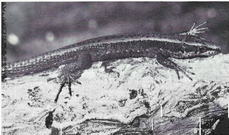
Abb. 3. Algyroides marchi ♂ (Nr. 2) auf dem Sonnenplatz im Terrarium.

Ein weiterer Fragenkomplex, zu dem wir durch unser Material neue Aspekte hinzufügen können, ist der Geschlechtsdimorphismus. KLEMMER (1960) erwähnt für A. marchi Geschlechtsunterschiede in den Proportionen und in der Färbung.