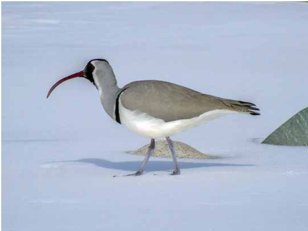
Ibidorhyncha struthersii , Верхне-Алаарчинское водохранилище, февраль 2015 г., И. Р. Романовская