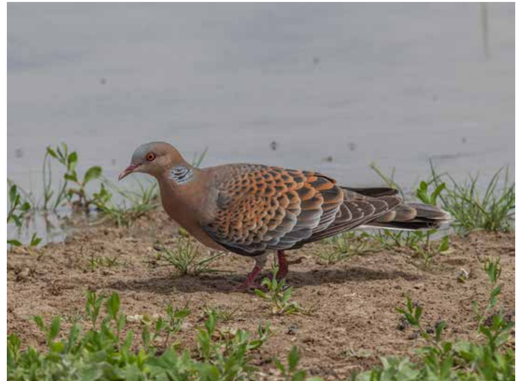
Streptopelia orientalis ssp. meena , С. Тянь-Шань, уроч. Колшенгель, апрель 2015 г., С. А. Торопов