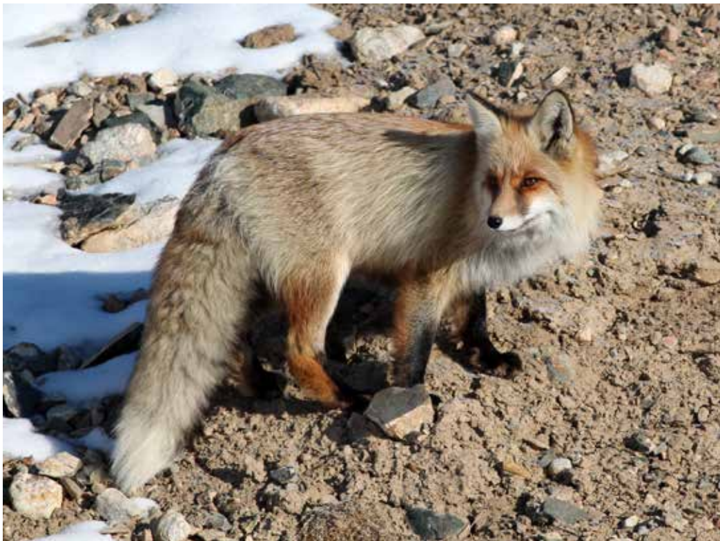
Vulpes vulpes ssp. karagan , Джеты-Огузские сырты, ноябрь 2014 г., А. Т. Давлетбаков