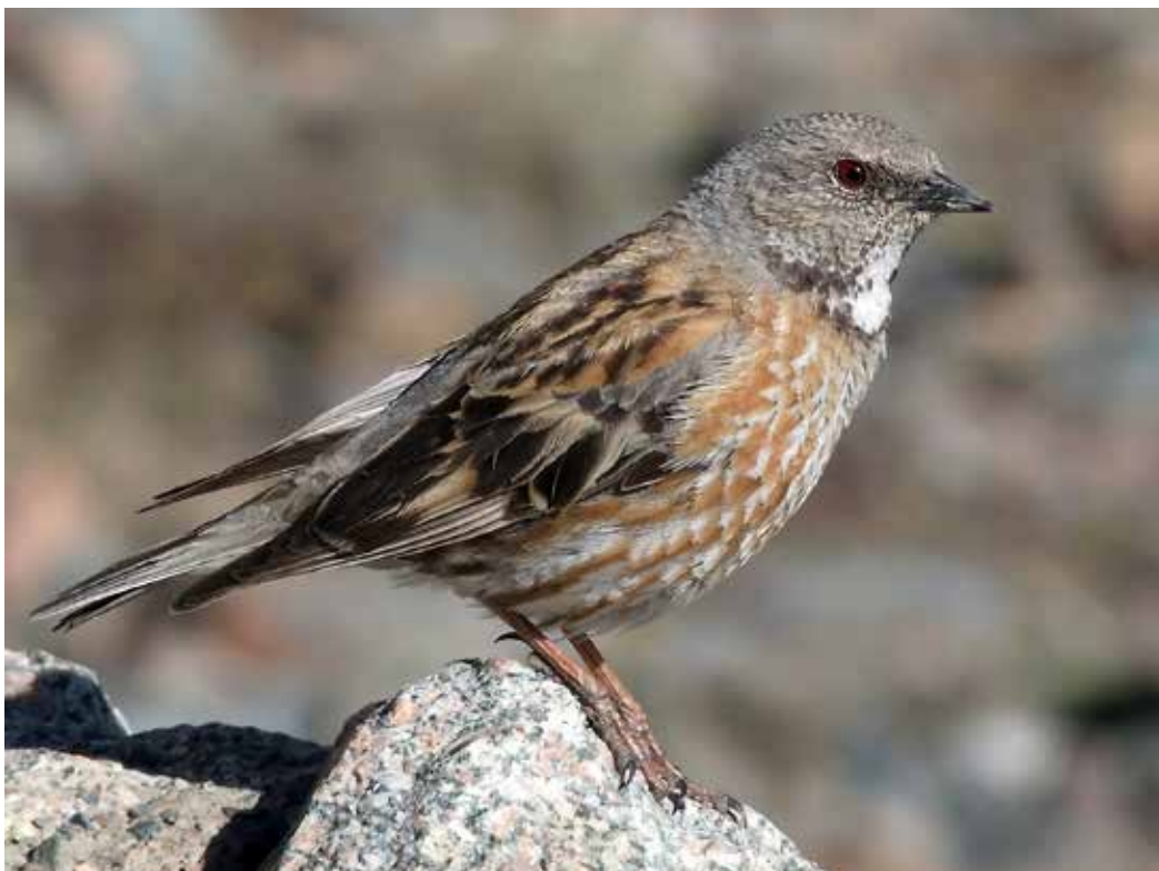
Prunella himalayana , С. склон хр. Кунгей Ала-Тоо близ с. Ананьево, июнь 2013, С. В. Кулагин