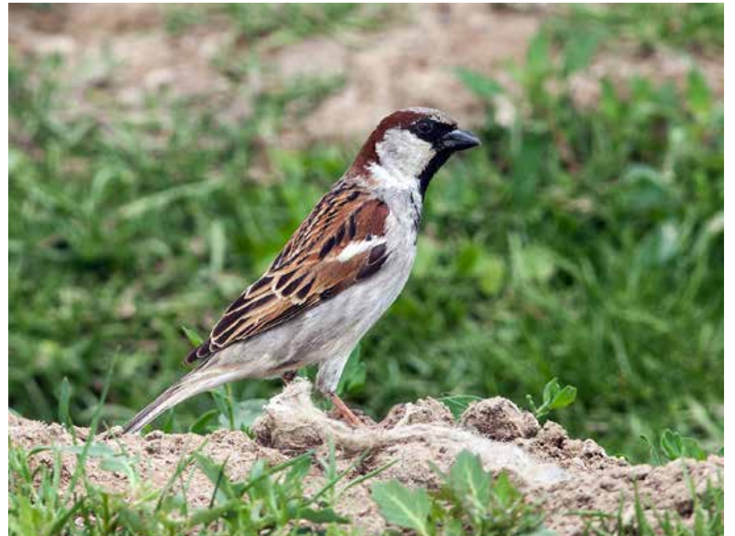
Passer indicus ssp. bactrianus , С. Тянь-Шань, уроч. Колшенгель, май 2015 г., С. А. Торопов