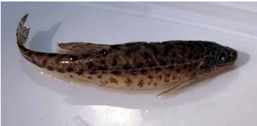
Diptychus sewerzowi form, Внутр. Тянь-Шань, р. Тарагай, июль 2008 г., Д. А. Милько