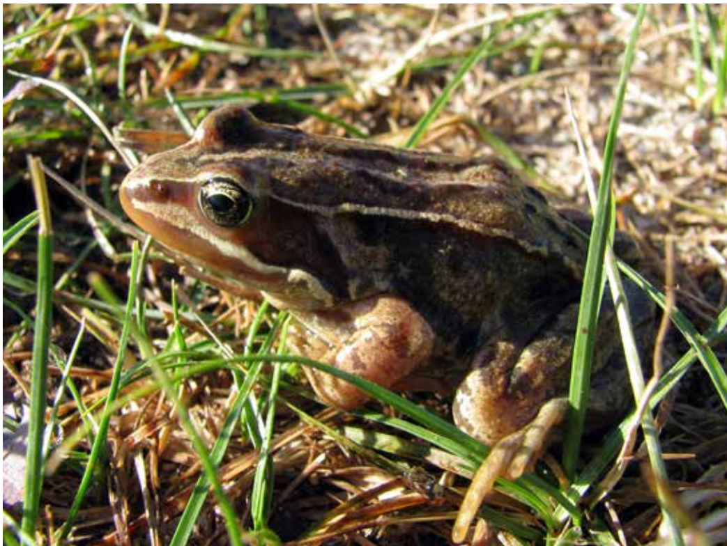
Rana asiatica , С. берег Иссык-Куля, окрестности с. Ананьево, июль 2014 г., Д. А. Милько