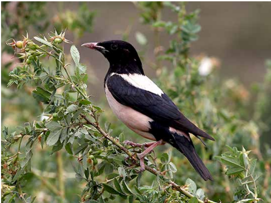
Sturnus roseus , С. предгорья Киргизского хр., ущ. Ала-Арча, июль 2014 г., С. А. Торопов