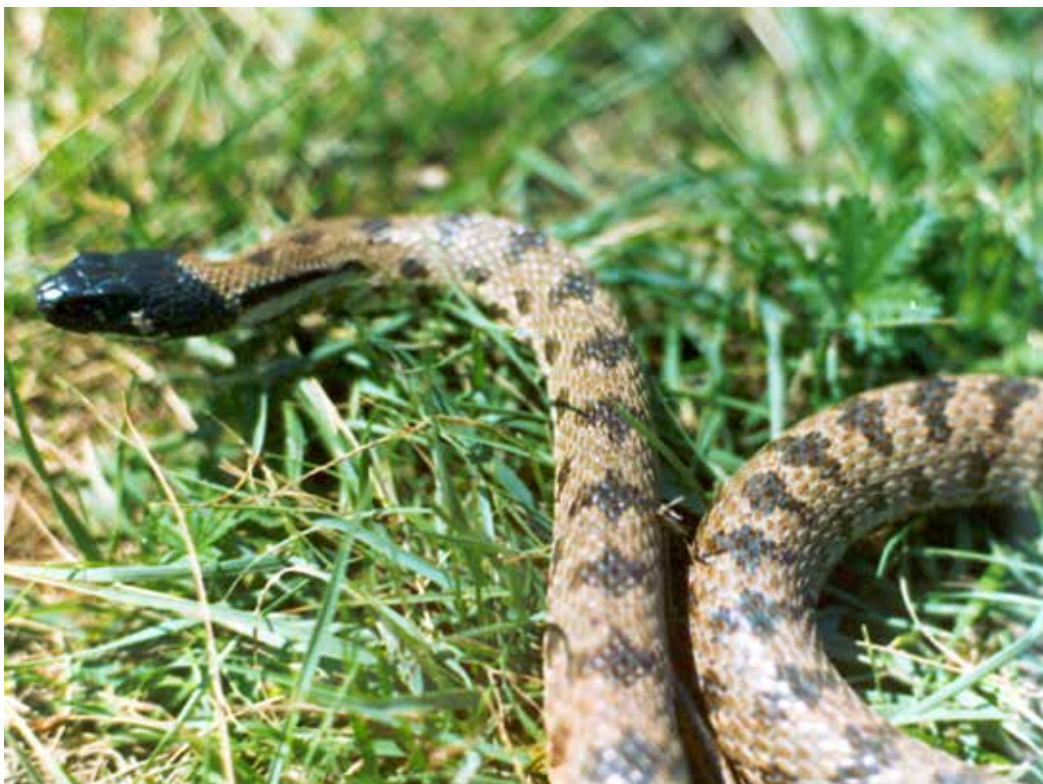
Hemorrois ravergieri f. melanocephala , С. Прииссыккулье, Чон-Урюкты, июль 1989 г., Д. А. Милько