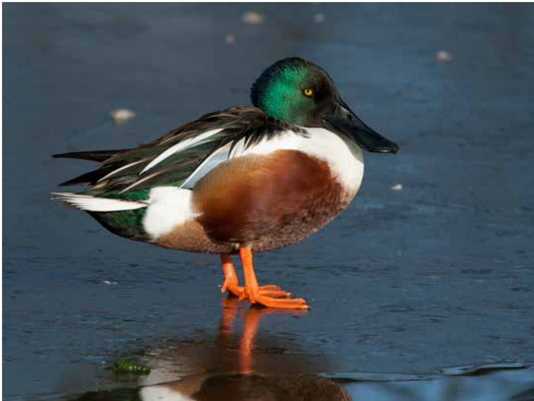
Anas clypeata , самец.