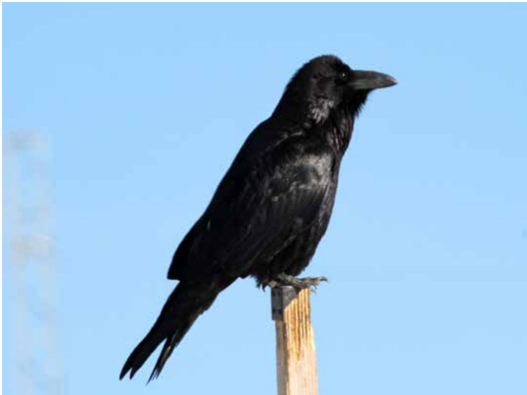
Corvus corax ssp. tibetanus , Джеты-Огузские сырты, февраль 2015 г., А. Т. Давлетбаков