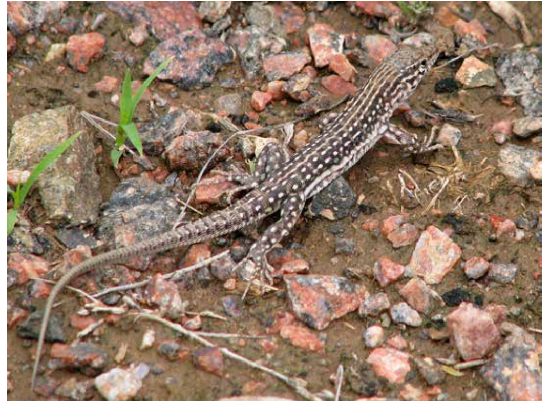
Eremias nikolskii , Внутр. Тянь-Шань, ущ. р. Кокомерен, июнь 2006 г., Д. А. Милько