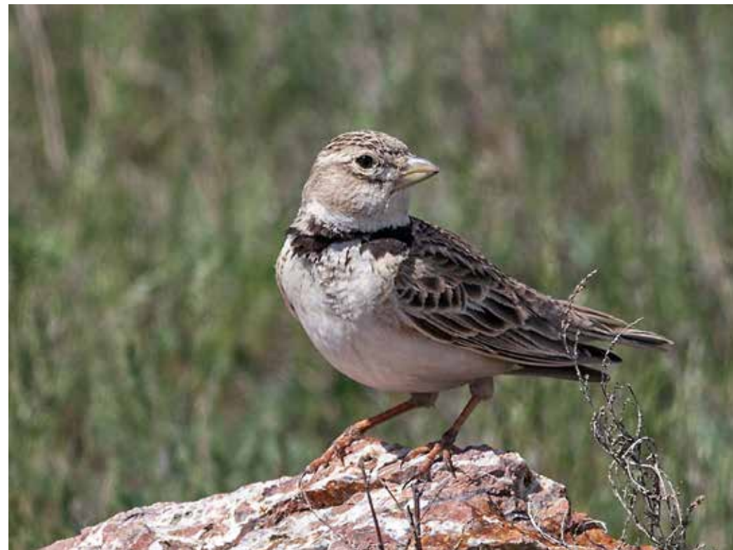
Melanocorypha calandra ssp. psammochroa , Чу-Илийские горы, апрель 2015 г., С. А. Торопов