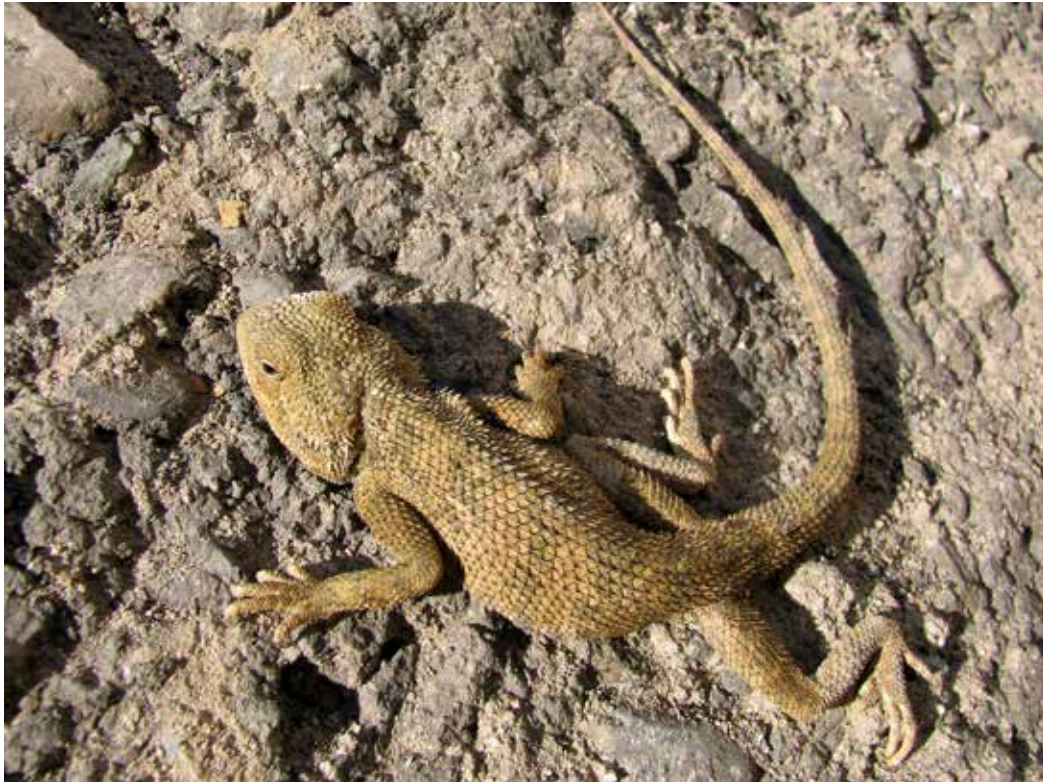
Trapelus sanguinolentus , СВ. Приферганье, окрестности Шамалдыся, сентябрь 2011 г., Д. А. Милько