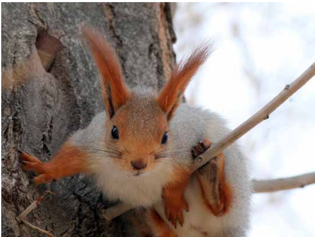
Sciurus vulgaris ssp. exalbidus , Терскей Ала-Тоо, Барскаун, февраль 2015 г., А. Т. Давлетбаков