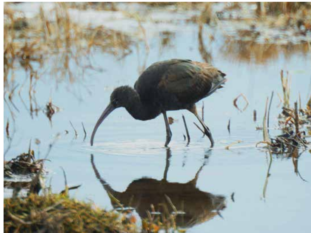
Plegadis falcinellus , Чуйская долина, июнь 2009, Т. Хардер