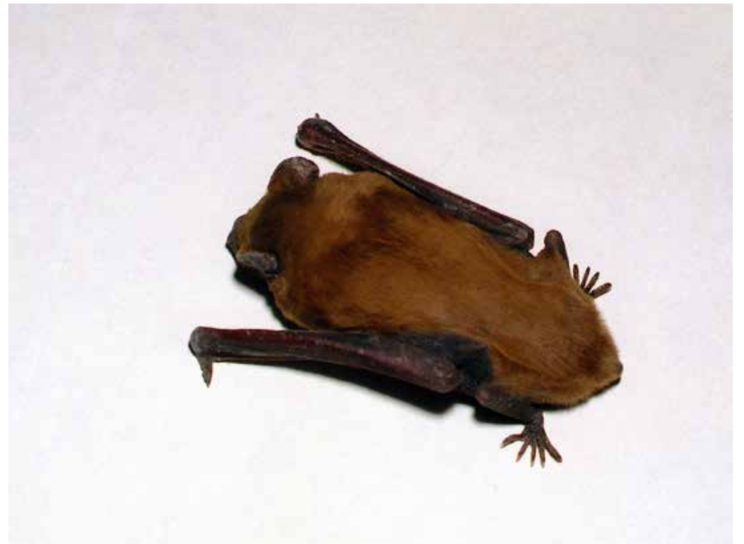
Nyctalus noctula ssp. meklenburzevi , Бишкек, февраль 2005 г., Д. А. Милько