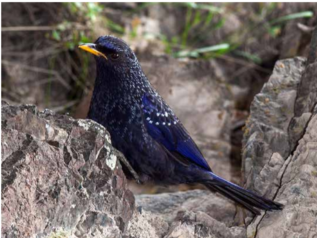
Myophonus caeruleus , С. предгорья Киргизского хр., ущ. Кашка-Суу, июнь 2015, С. А. Торопов