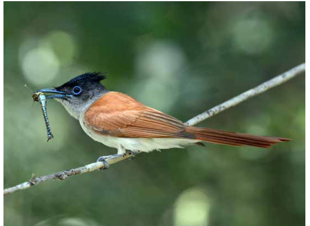
Terpsiphone paradisi ssp. leucogaster , хр. Заилийский Ала-Тоо, июль 2014 г., В. А. Федоренко