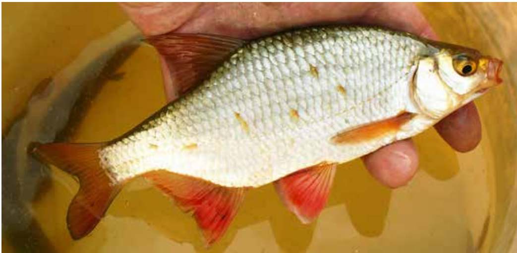
Scardinius erythrophthalmus , Чуйская долина, август 2013 г., Н. А. Миркурбанов