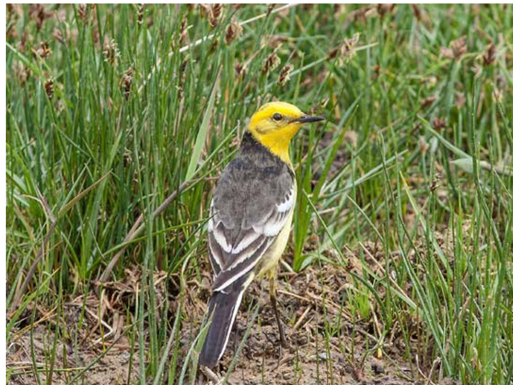
Motacilla citreola , З. Прииссыккулье, Балыкчи, май 2015 г., С. А. Торопов