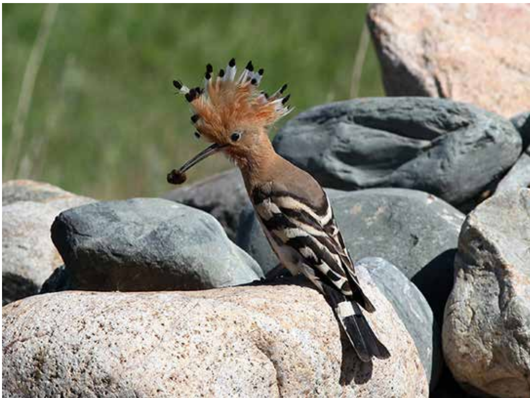
Урира еропс , окрестности Бишкека, ущ. Джыламыш, май 2015 г., С. А. Торопов