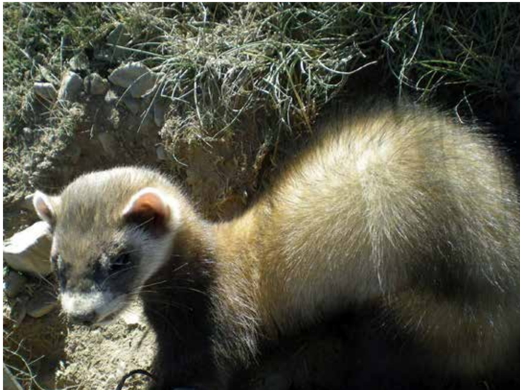
Mustela erversmanni ssp. larvatus , Чатыркульская котловина, июль 2013 г., А. Ю. Захаров