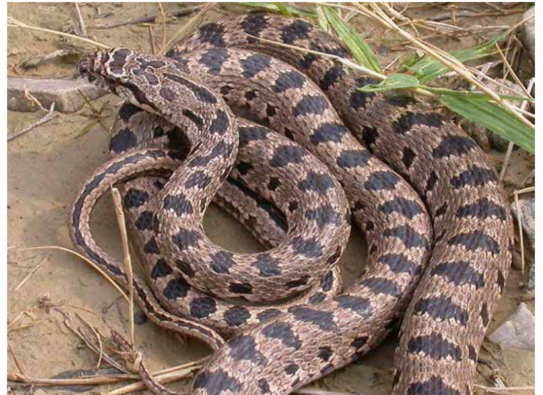
Hemorrois ravergieri f. typica , Ю. берег Токтогульского водохранилища, июль 2003 г., Д. А. Милько