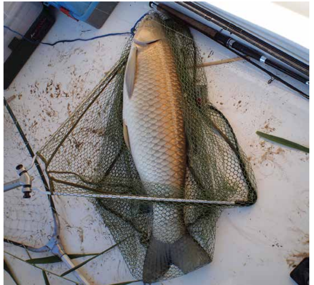
Stenopharyngodon idella , Чуйская долина, сентябрь 2013 г., Н. А. Миркурбанов