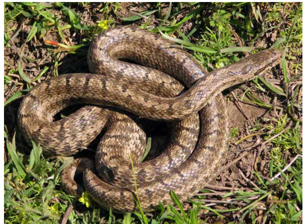
Elaphe dione , окрестности Бишкека, апрель 2015 г., Д. А. Милько