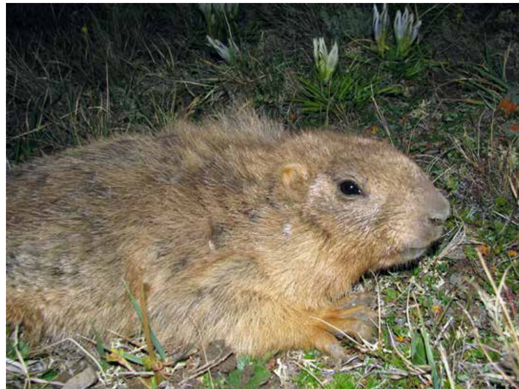
Marmota baibacina ssp. centralis , хр. Ак-Шыйрак-Вост., пер. Ак-Бель, июль 2015 г., Д. А. Милько