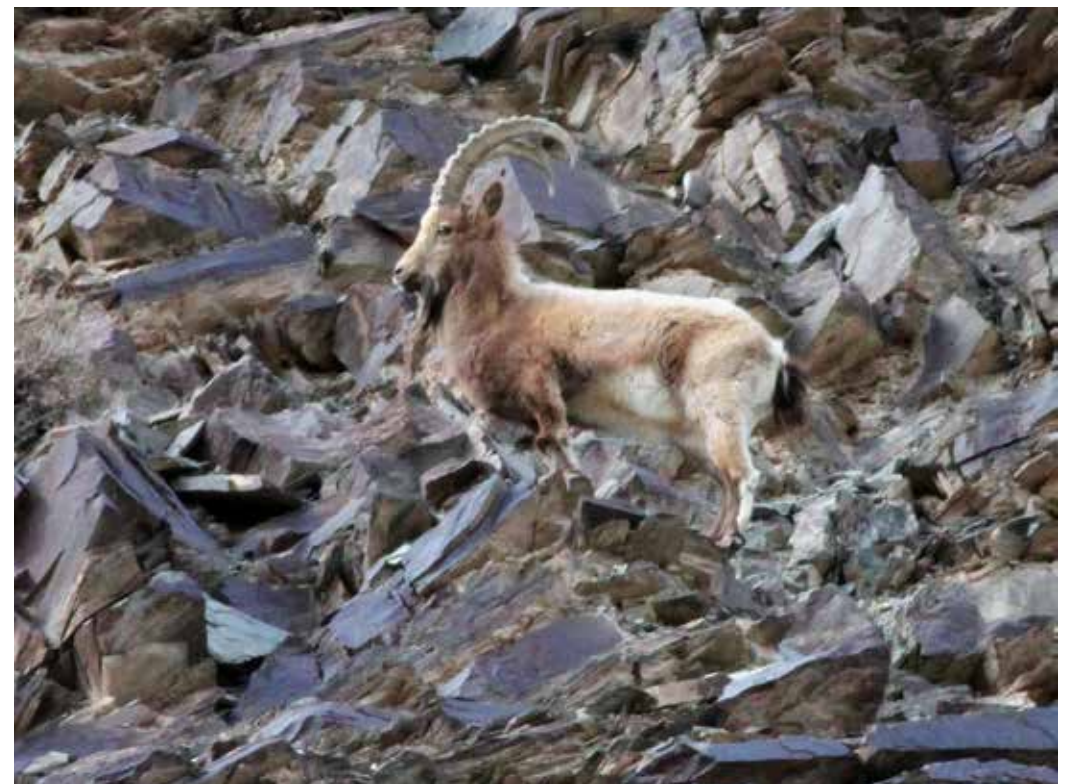
Capra sibirica ssp. alaiana , Внутр. Тянь-Шань, ущ. р. Узенгю-Кууш, март 2014 г., А. Т. Давлетбаков