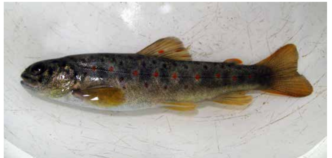
Salmo trutta ssp. oxianus , Внутр. Алай, р. Кызыл-Суу-Зап., июль 2007 г., Д. А. Милько