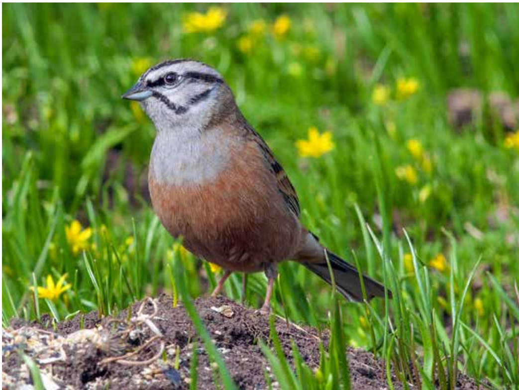
Emberiza cia ssp. par , окрестности Бишкека, уроч. Арчалы, апрель 2015, С. А. Торопов