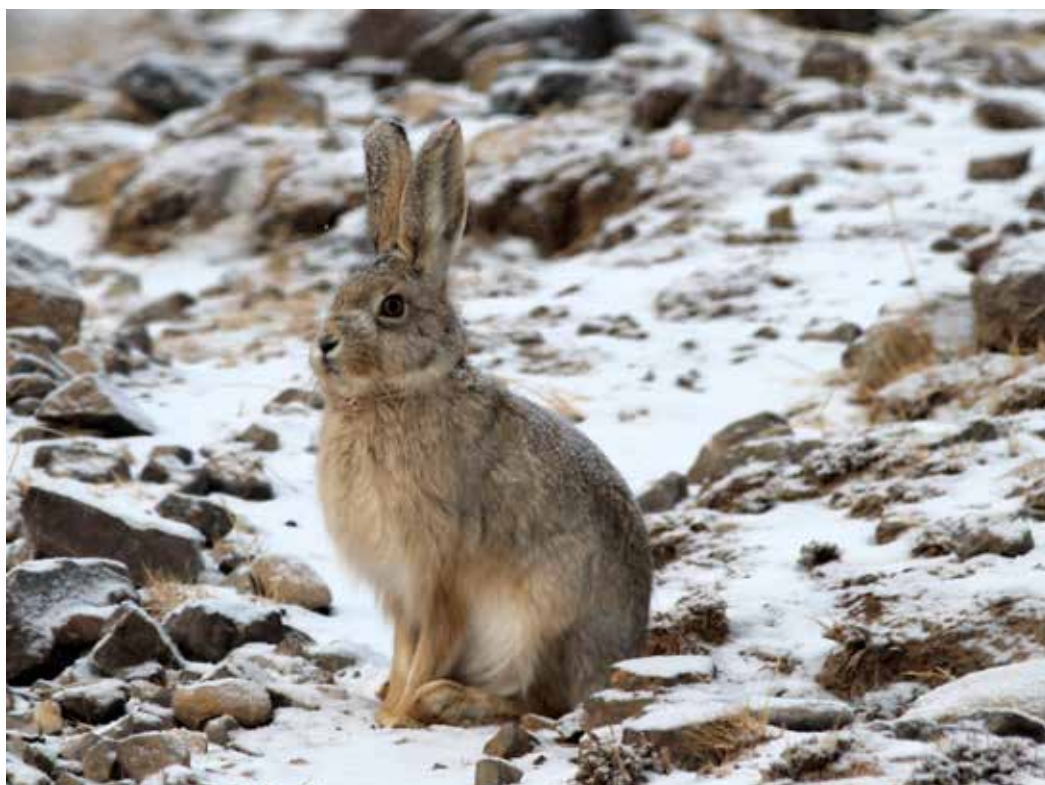
Lepus tolai ssp. lehmanni , хр. Кокшаал-Тоо, ущ. Кайче, февраль 2015 г., А. Т. Давлетбаков