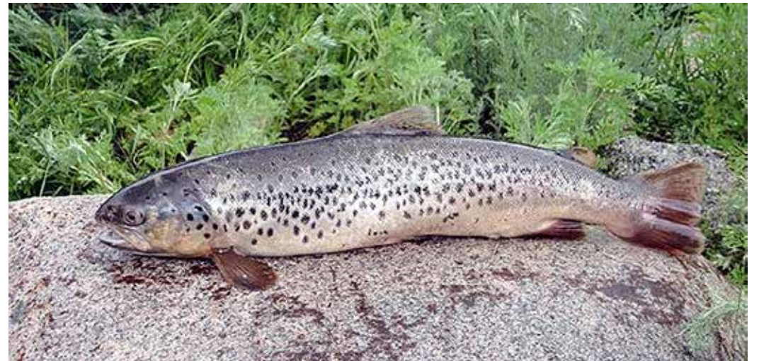
Salmo ischchan ssp. issykogegarkuni , ЮЗ. берег Иссык-Куля, с. Оттук, октябрь 2012 г., И. Осмонов