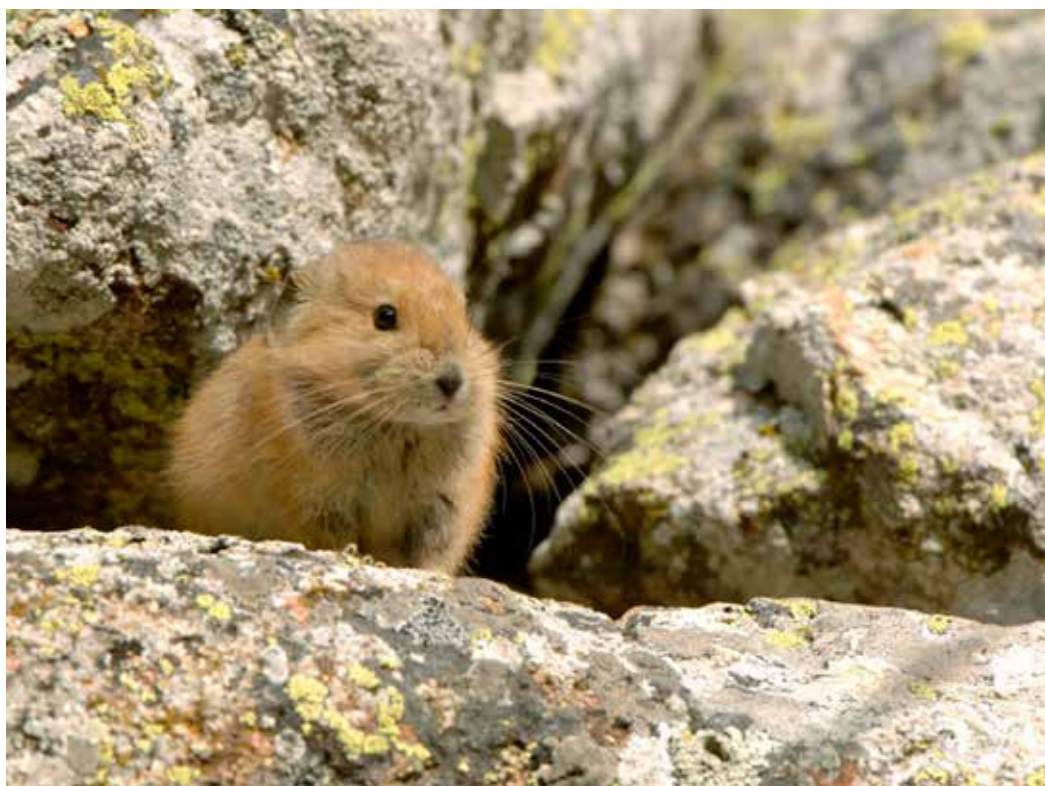
Ochotona rutila , хр. Кунгей Ала-Тоо, ущ. Кичи-Урюкты, июль 2006 г., А. Т. Давлетбаков