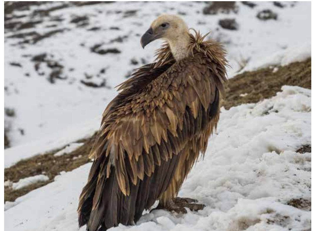
Gyps himalayensis , С. склон хр. Кунгей Ала-Тоо близ с. Ананьево, декабрь 2014 г., В. Т. Якушкин