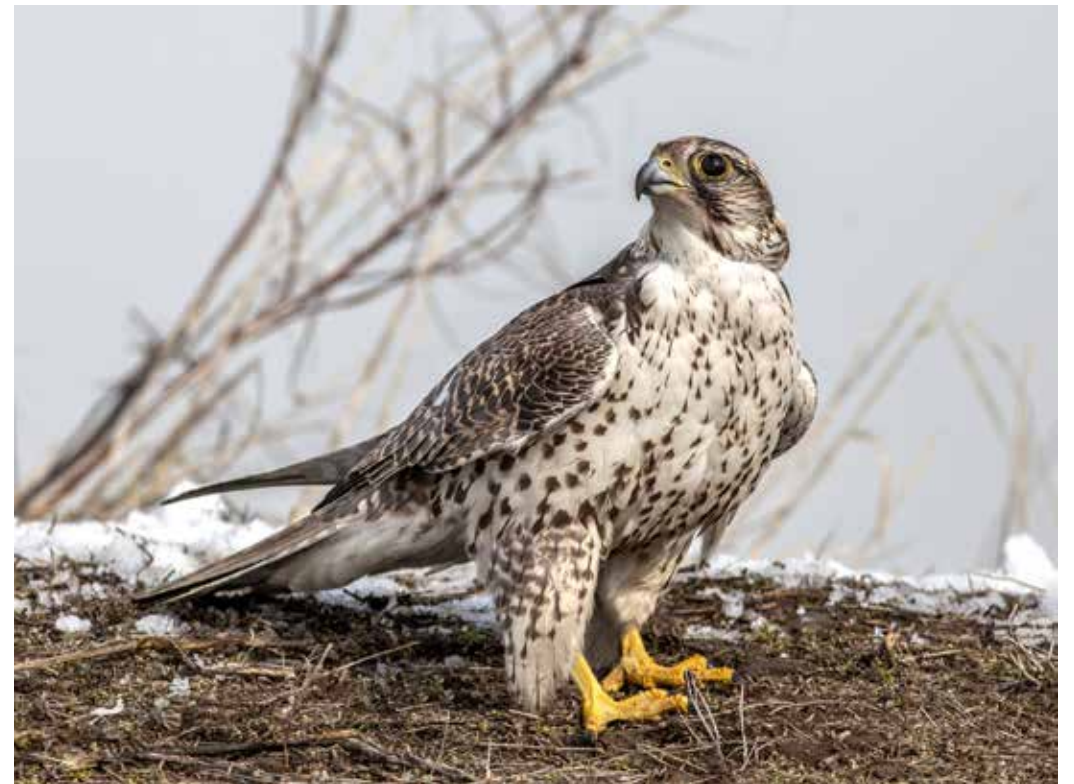
Falco cherrug ssp. coatsi , Внутр. Тянь-Шань, бассейн р. Он-Арча, январь 2015 г., С. А. Торопов