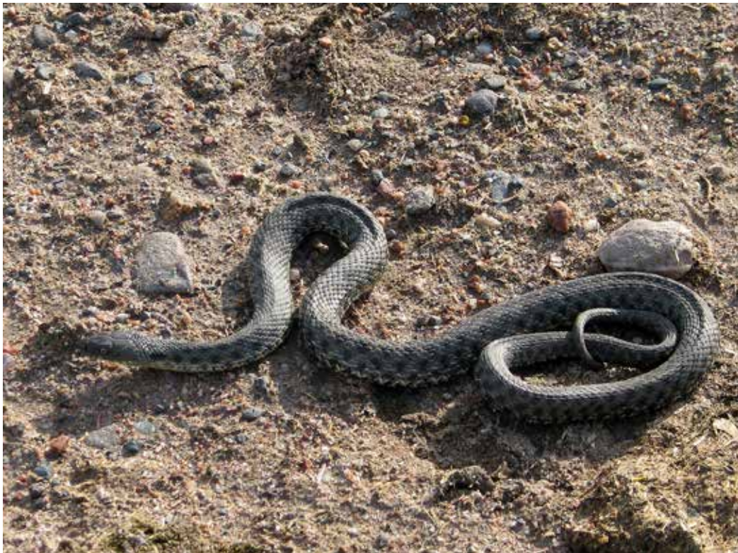
Natrix tessellata , Алайский хр., окрестности Гульчи, май 2014 г., Д. А. Милько