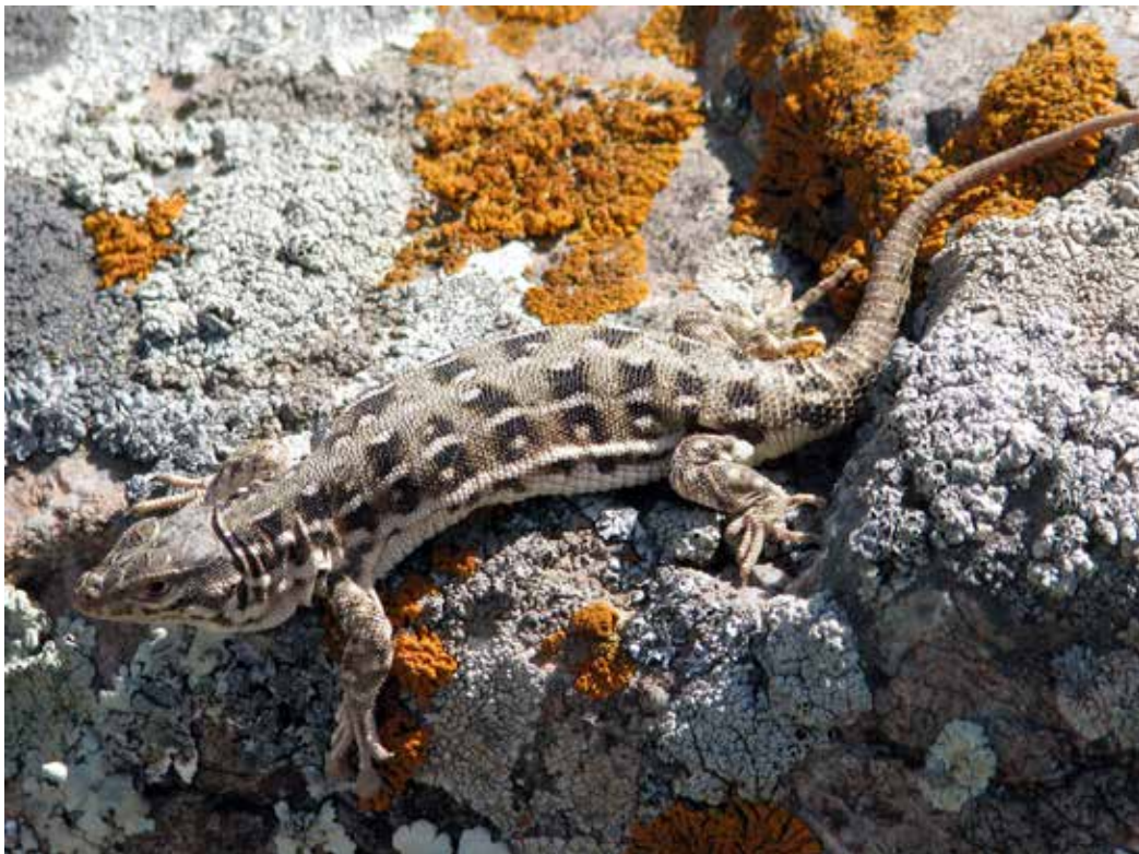
Eremias arguta nom. ssp., СВ. часть Киргизского хр., Джиль-Арык, апрель 2015 г., Д. А. Милько