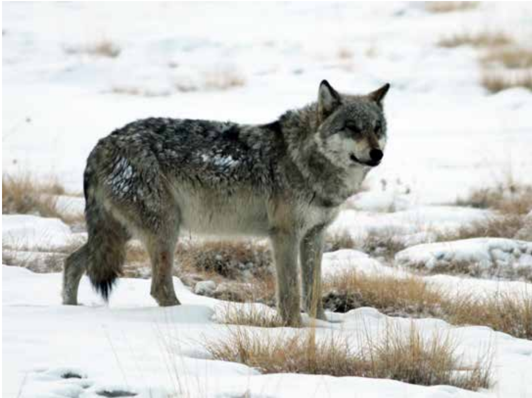
Canis lupus ssp. chanko , Джеты-Огузские сырты, март 2015 г., А. Т. Давлетбаков