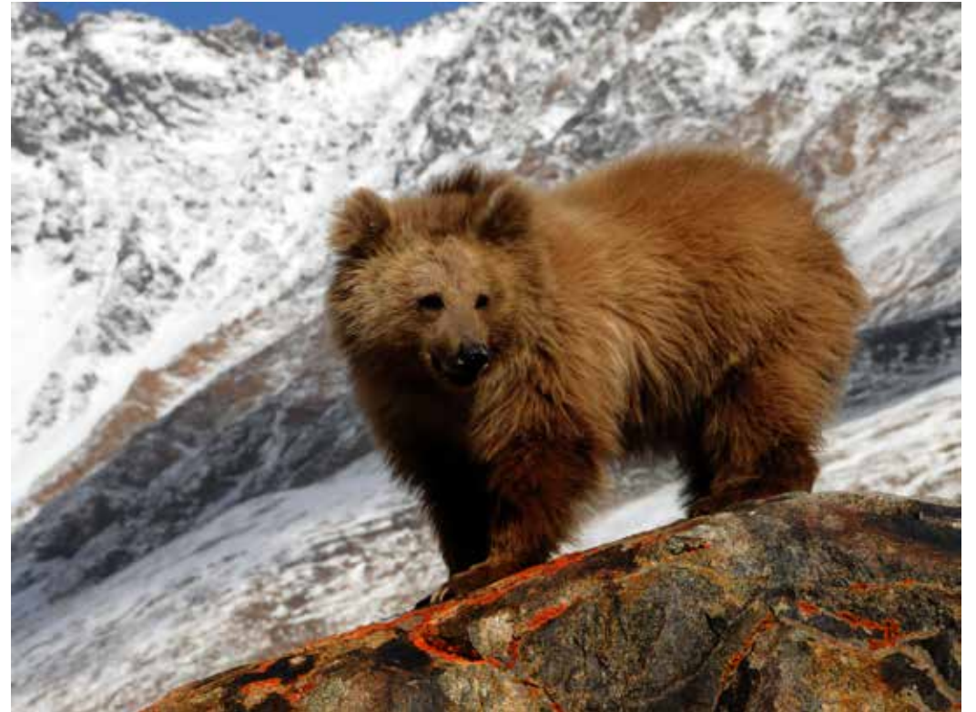
Ursus arctos ssp. isabellinus , Памир, Сев. Аличурский хр., июнь 2014 г., Т. Розен-Михель