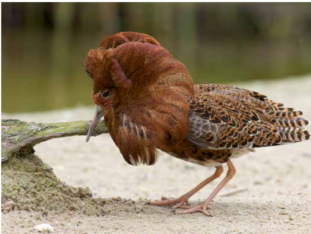
Philomachus pugnax , самец.