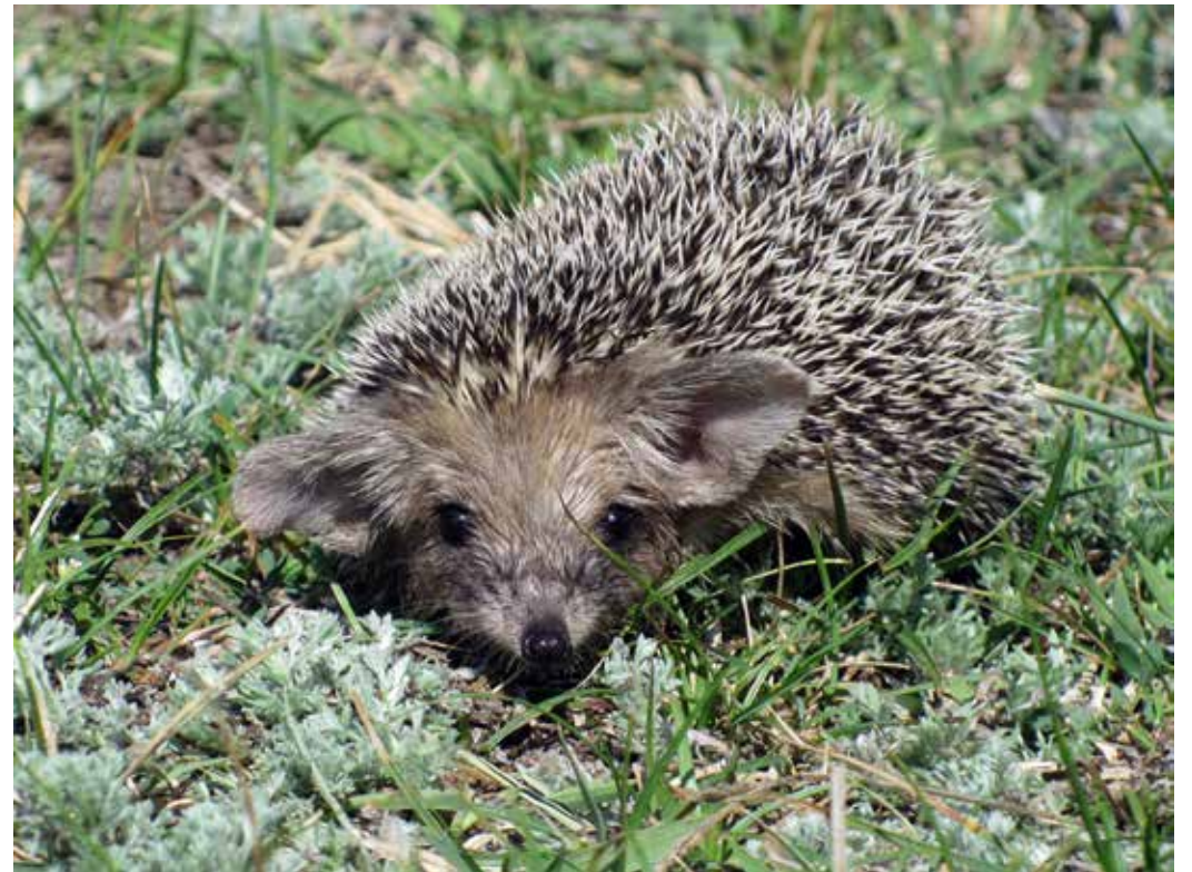
Hemiechinus auritus , Чуйская долина, август 2010 г.