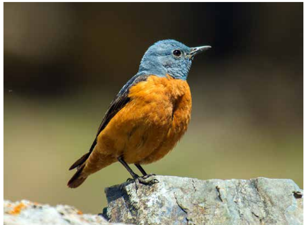
Monticola saxatilis ssp. turkestanicus , С. склон хр. Терскей Ала-Тоо, июнь 2014, А. Б. Жданко