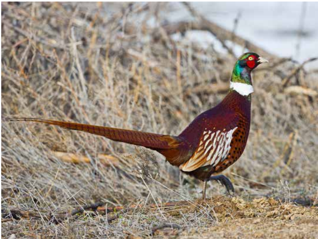
Phasianus colchicus ssp. mongolicus , долина р. Или, уроч. Кара-Чингиль, март 2013 г., В. Т. Якушкин