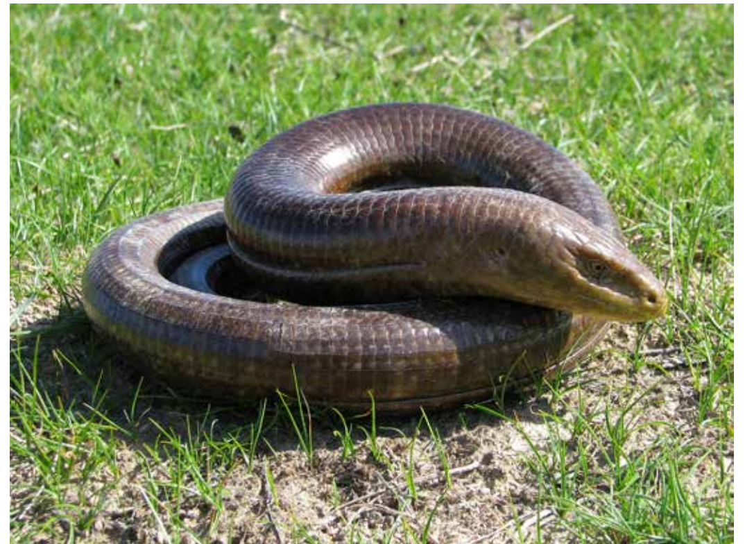
Pseudopus apodus , С. Приферганье, близ с. Атана, март 2014 г., Д. А. Милько