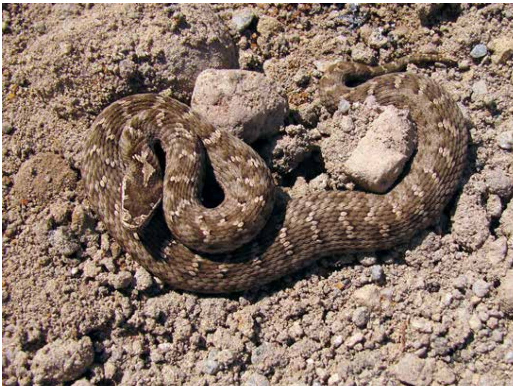
Gloydius halys ssp. caraganus , Зап. Тянь-Шань, ущ. р. Сандаш, сентябрь 2011 г., Д. А. Милько