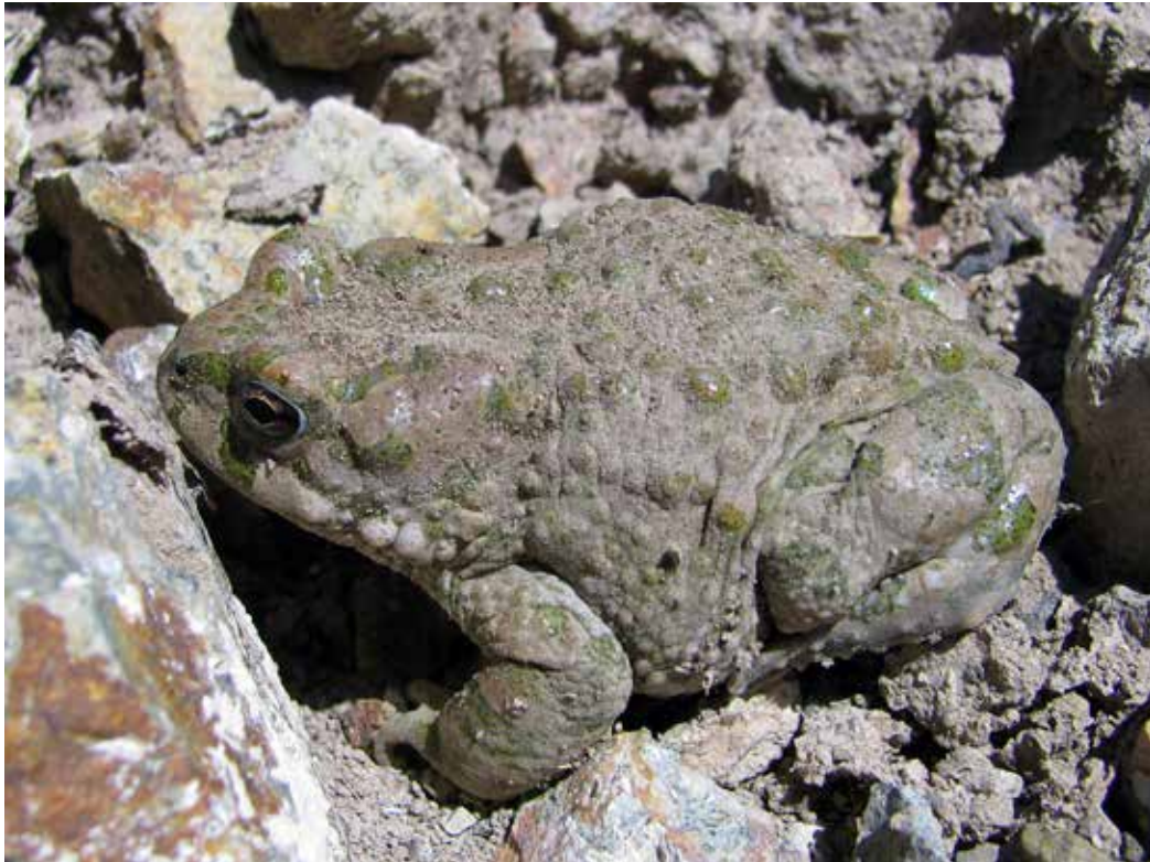
Bufo pewzowi ssp. unicolor , верховья р. Талас, ущ. Талды-Булак, июль 2012 г., Д. А. Милько