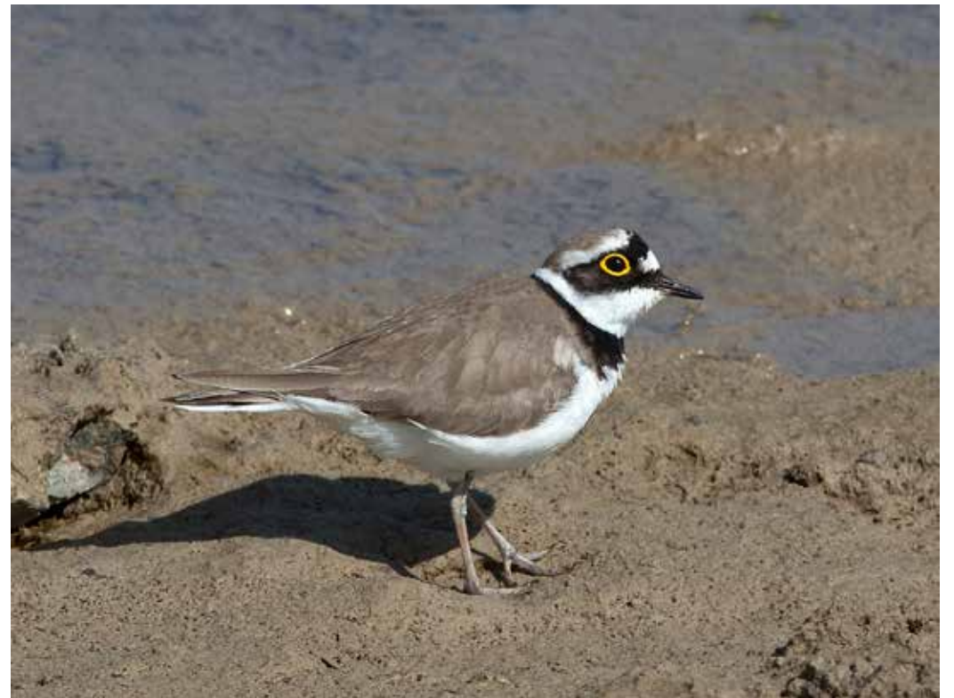
Charadrius dubius , Чу-Илийские горы, долина Копа, апрель 2015 г., С. А. Торонов