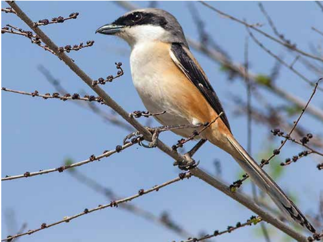
Lanius schach ssp. erythronotus , окрестности Бишкека, Чон-Арык, апрель 2015 г., С. А. Торопов