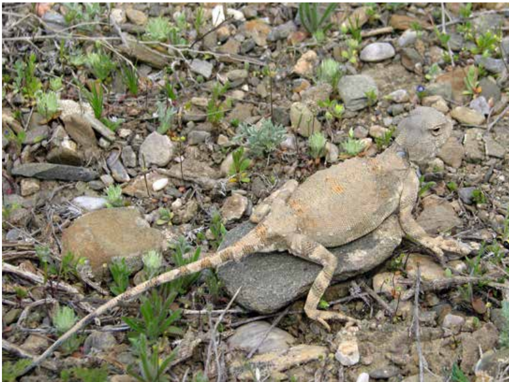
Phrynocephalus saidalievi , Ю. Приферганье, близ с. Чункур-Кыштак, апрель 2014 г., Д. А. Милько