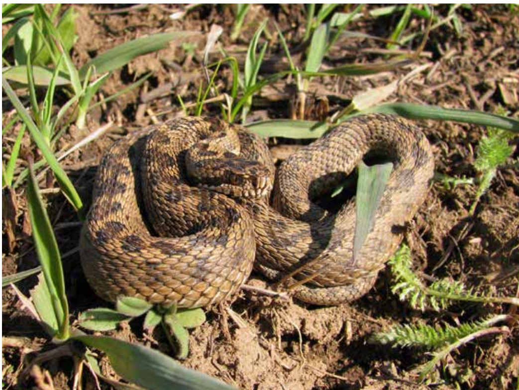
Vipera renardi ssp. tienshanica , окрестности Бишкека, апрель 2015 г., Д. А. Милько