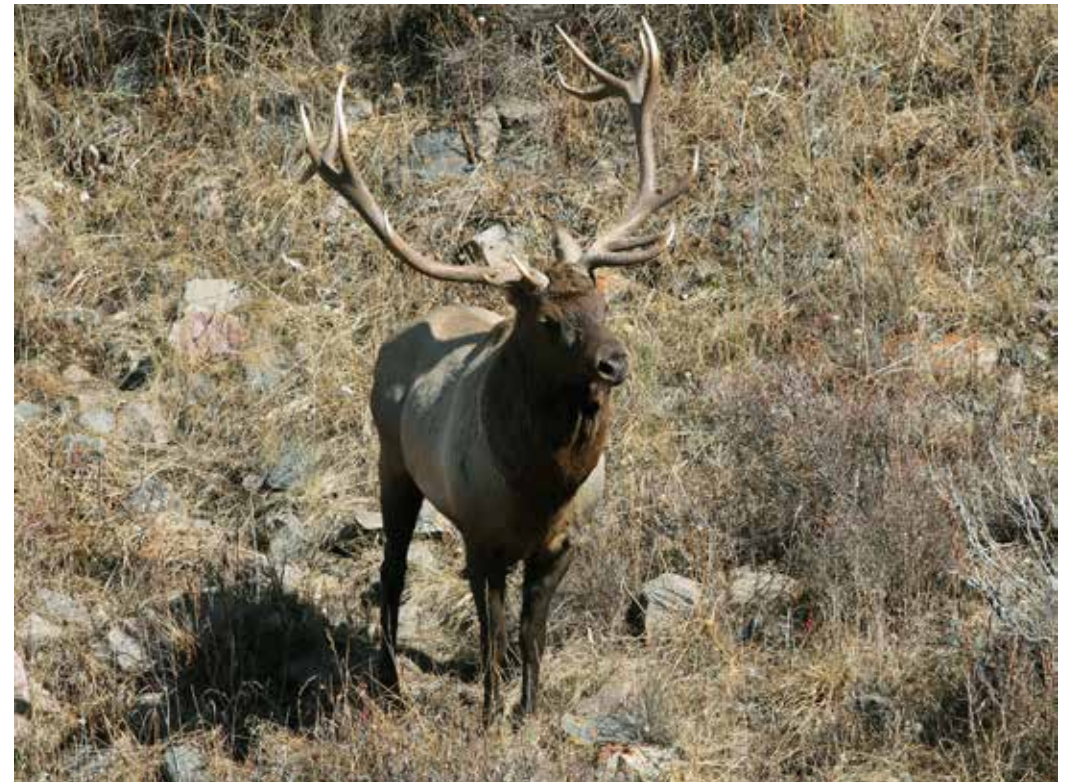
Cervus canadensis ssp. songaricus , Нарынский госзаповедник, октябрь 2014 г., А. Т. Давлетбаков