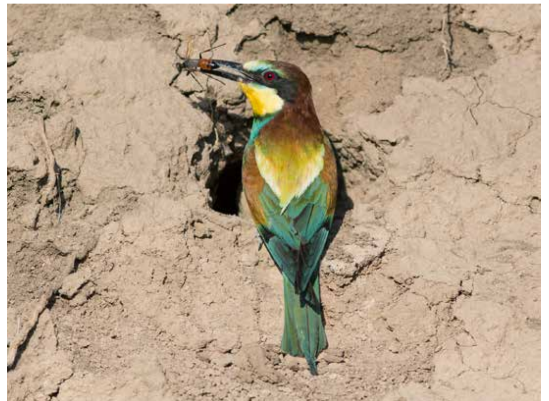
Merops apiaster , окрестности Бишкека, уроч. Беш-Кунгей, июнь 2015 г., С. А. Торопов