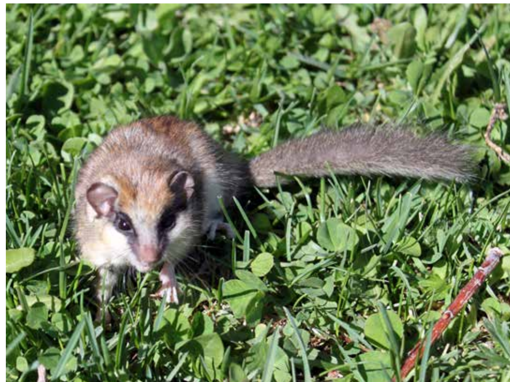
Dryomys nitedula , долина р. Чон-Кемин, май 2014 г., А. Т. Давлетбаков