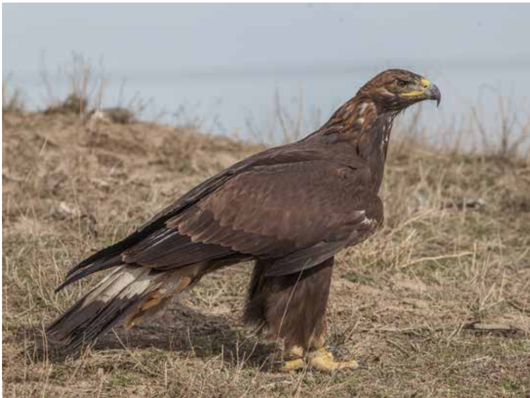
Aquila chrysaetos ssp. daphanea , С. предгорья Киргизского хр., ноябрь 2014 г., С. А. Торопов