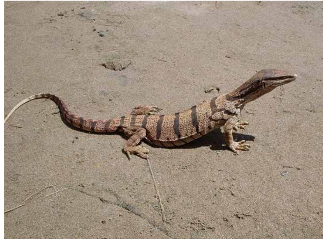
Varanus griseus ssp. caspius , окрестности Таш-Кумыра, июнь 2007 г., А. Т. Давлетбаков