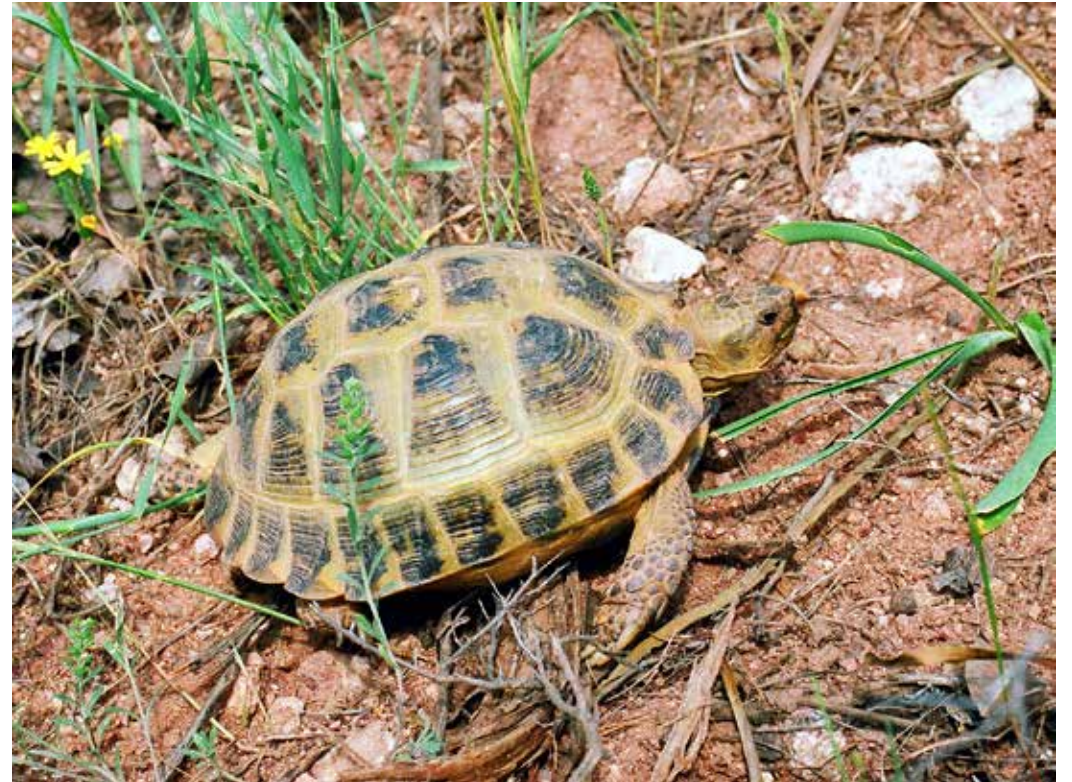
Testudo horsfieldi ssp. bogdanovi , окрестности Таш-Кумыра, ущ. Шинг-Сай, май 2005 г., Д. А. Милько