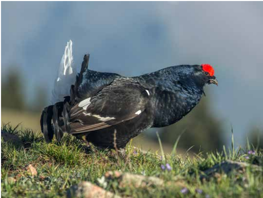
Lyrurus tetrix ssp. mongolicus , С. склон хр. Кунгей-Ала-Тоо, май 2014 г., А. Б. Жданко