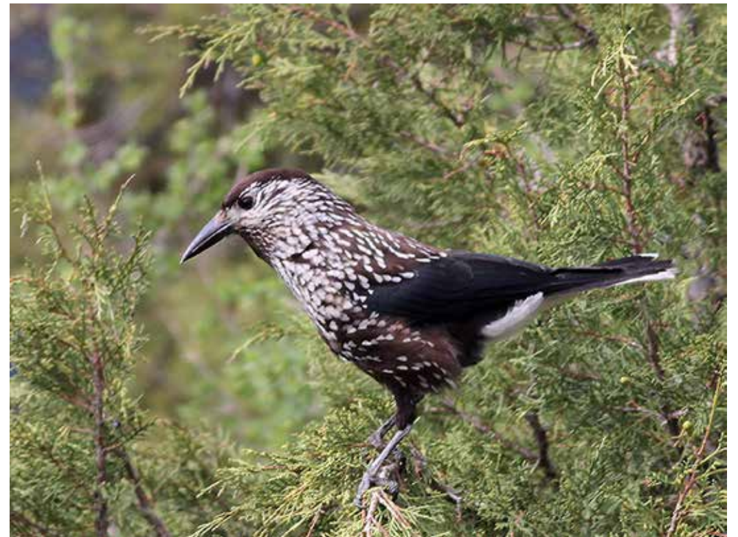
Nucifraga caryocatactes ssp. rothschildi , ущ. р. Чон-Кемин, май 2014 г., А. Т. Давлетбаков