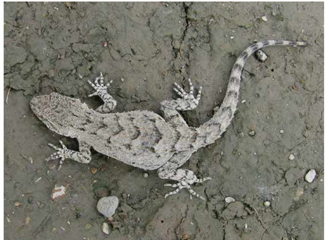
Mediodactylus russowi , окрестности Таш-Кумыра, апрель 2013 г., Д. А. Милько