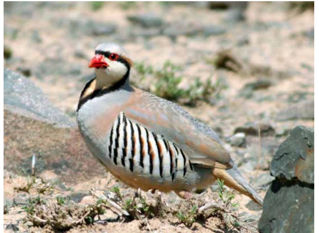
Alectoris chukar ssp. falki , СЗ. часть хр. Терскей Ала-Тоо близ с. Отгук, июнь 2014 г., А. Т. Давлетбаков