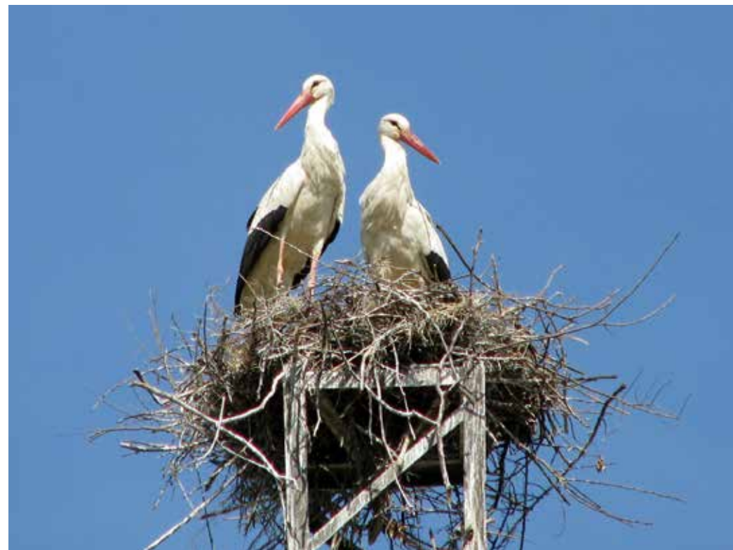
Ciconia ciconia ssp. asiatica , СВ. Приферганье, близ Шамалдыся, апрель 2014 г., Д. А. Милько