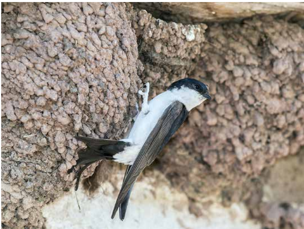
Delichon urbica , С. склон Киргизского хр., уроч. Чон-Курчак, июль 2014 г., С. А. Торопов