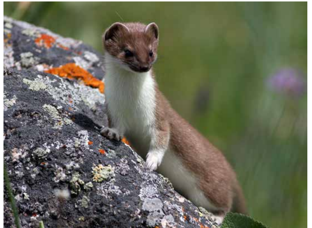
Mustela erminea ssp. ferghanae , бассейн р. Чон-Кемин, ущ. Койсу, июль 2014 г., А. Т. Давлетбаков