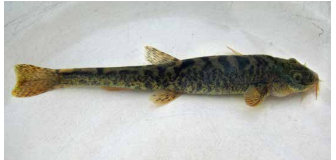
Triplophysa stoliczkai , хр. Ак-Шыйрак-Вост., приток р. Кумтор, июль 2015 г., Д. А. Милько