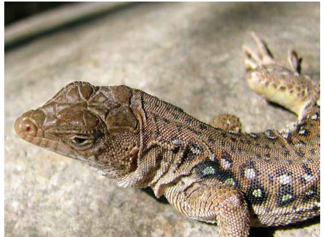
Eremias velox ssp. borkini , Киргизский хр., ущ. Карандолот, март 2011 г.