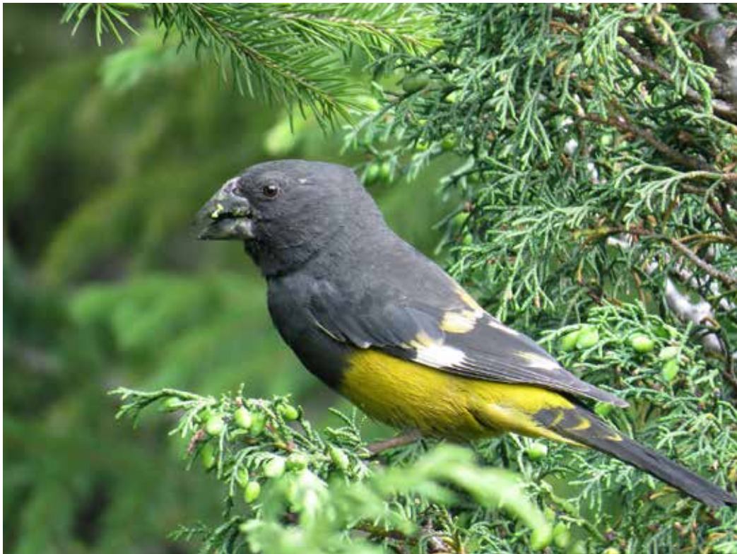
Mycerobas carnipes ssp. merzbacheri , хр. Терской Ала-Тоо, июль 2014 г., С. В. Кулагин