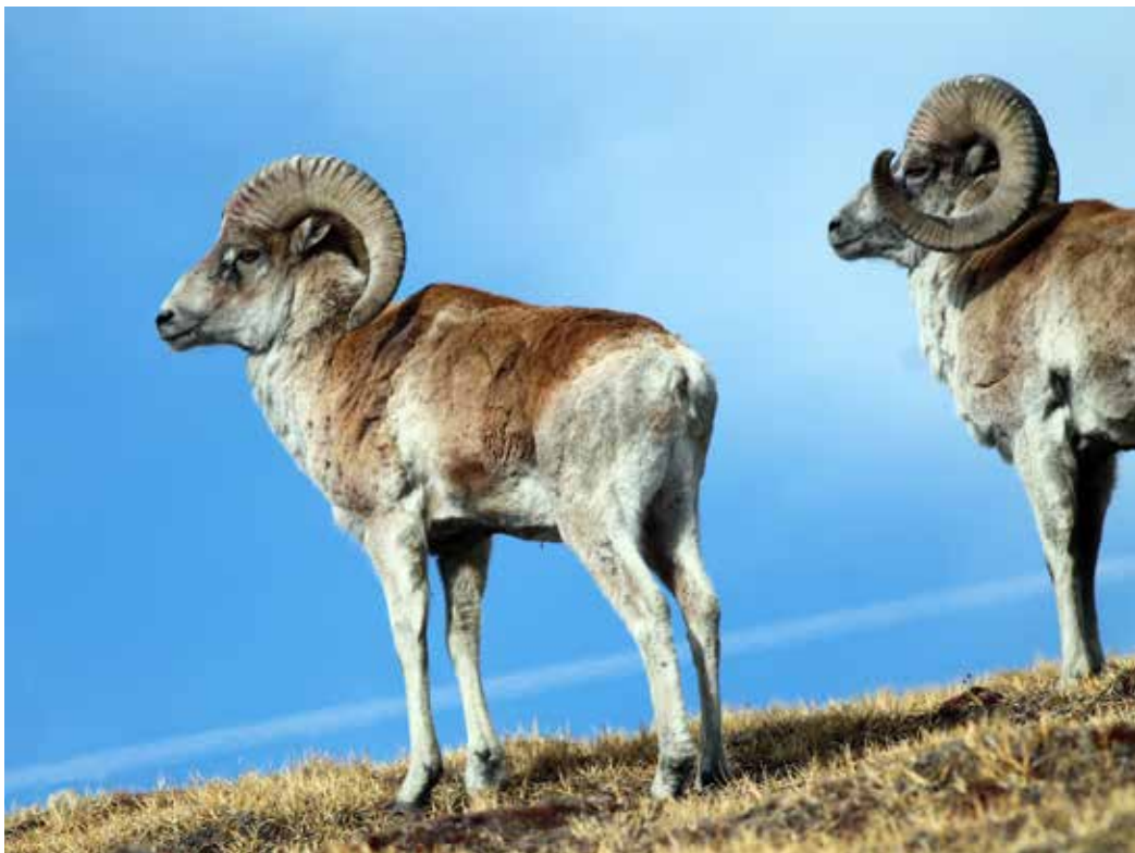
Ovis ammon ssp. karelini , Джеты-Огузские сырты, март 2015 г., А. Т. Давлетбаков