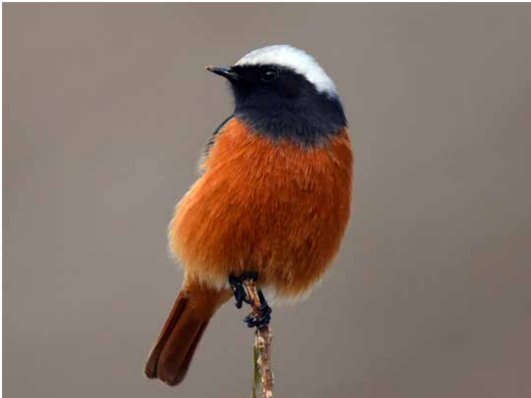
Phoenicurus erythrogaster ssp. grandis , хр. Заилийский Ала-Тоо, ноябрь 2014 г., О. В. Белялов