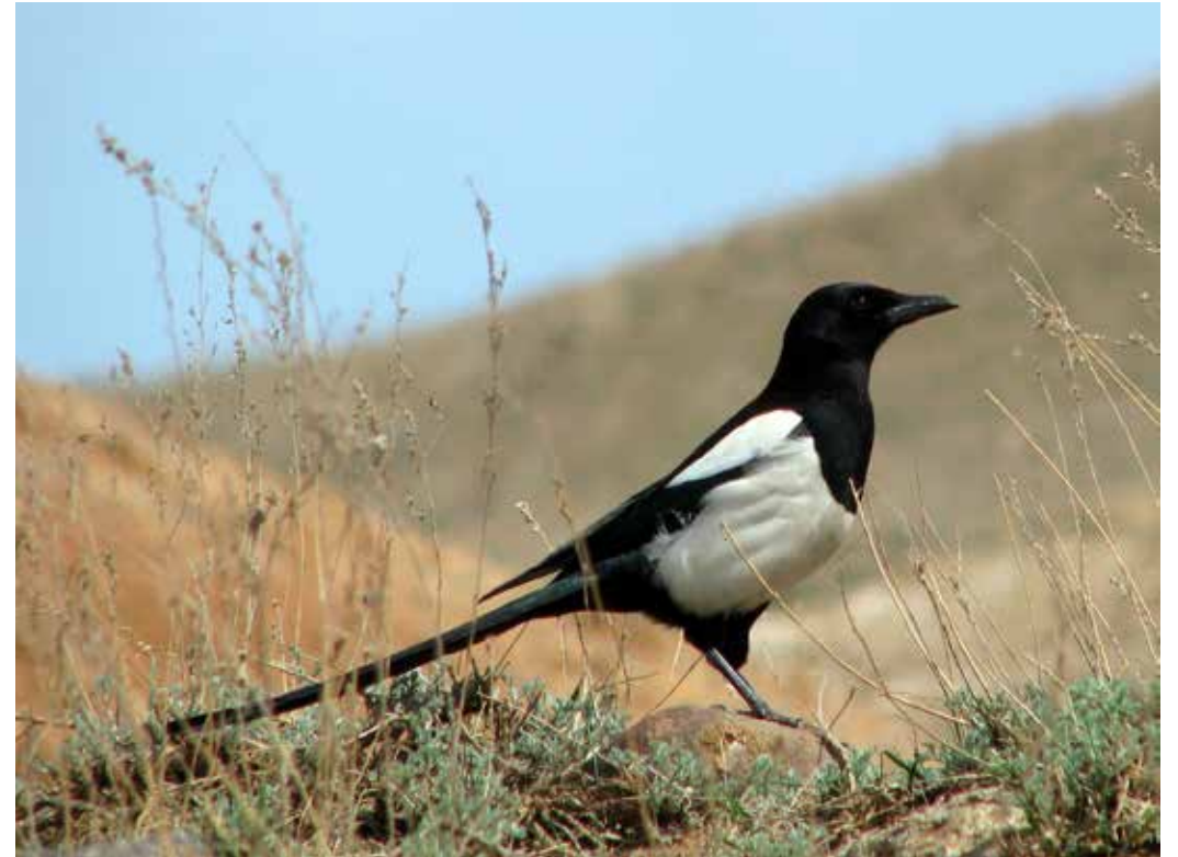
Pica pica ssp. bactriana , С. Приферганье, низовья р. Сумсар, март 2014 г., Д. А. Милько