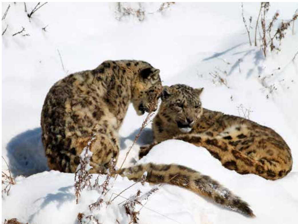
Uncia uncia , реабилитационный центр диких животных, с. Ананьево, март 2015 г., А. Т. Давлетбаков