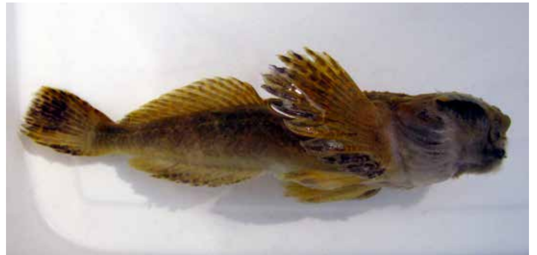
Cottus jaxartensis , Зап. Тянь-Шань, ущ. р. Сандалаш, сентябрь 2011 г., Д. А. Милько