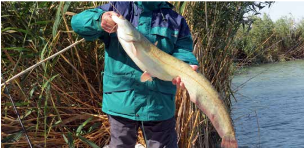
Silurus glanis , низовья р. Чу близ с. Камышановка, сентябрь 2013 г., Н. А. Миркурбанов