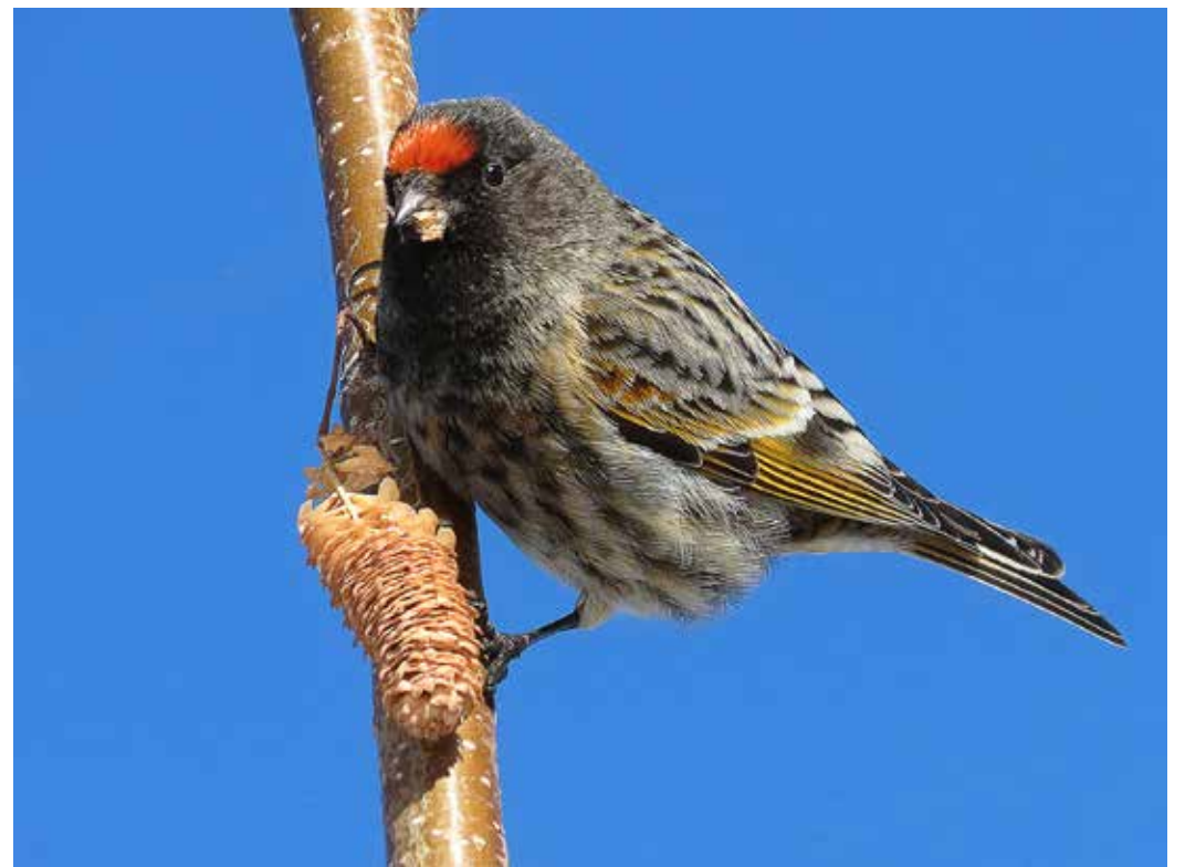
Serinus pusillus , Алматы, январь 2014, В. Л. Казенас