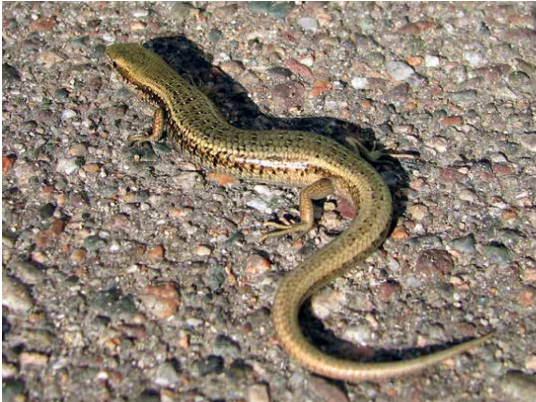
Asymblepharus eremchenkoii , Таласский хр., ущ. Кара-Буура, сентябрь 2011 г., Д. А. Милько