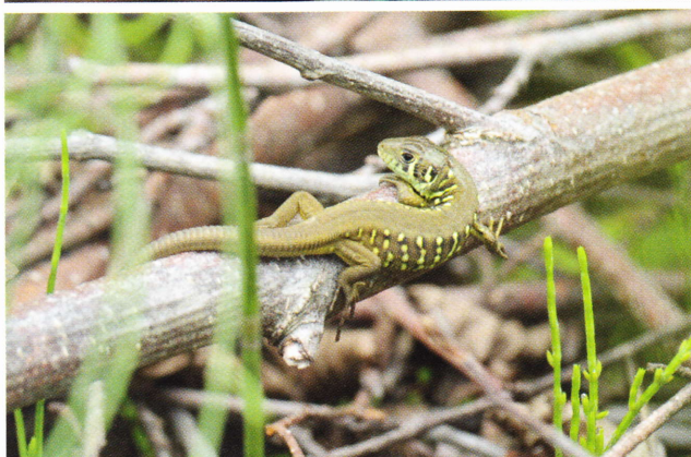
Figure 153: Lacerta schreiberi , juvénile observé en périphérie d'Elgoibar au même endroit que le mâle et la femelle précédemment illustrés (Guipuscoa, 70 m, 20 mai 2011).

aquatiques, la proportion d'invertébrés présentant une phase larvaire aquatique augmente (odonates, trichoptères et plécoptères). La taille des proies varie avec l'âge des individus, de 1,5 cm maximum chez les jeunes à 4 cm maximum chez les adultes. Elle varie aussi en fonction de la saison, les coléoptères étant surtout consommés au printemps et les orthoptères en été (Marco & Pérez-Mellado 1988). Quelques auteurs ont noté la consommation occasionnelle de petits vertébrés (poussins de passereaux et lézards de faible taille) (Braña 1984, Marco & Pérez-Mellado 1988) et des fruits de certains végétaux (Rosaceae) (Braña 1984). Ces derniers peuvent faire l'objet d'une consommation régulière, au moins localement (ingestion constatée chez 26 % des individus étudiés dans le Système central ibérique) (Marco & Pérez-Mellado 1988).