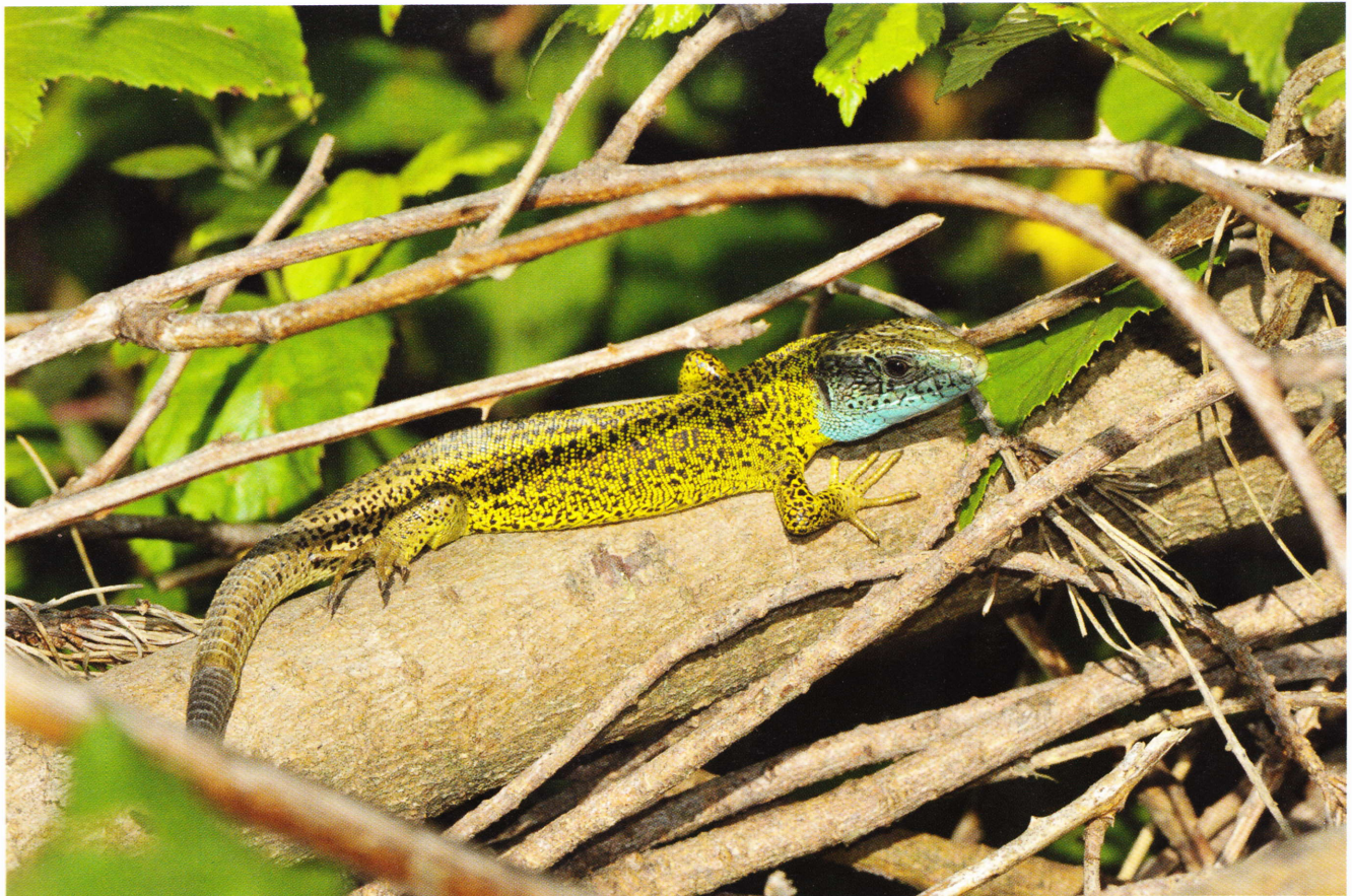
Figure 150: Lacerta schreiberi , mâle adulte observé en périphérie d'Elgoibar (Guipuscoa, 70 m, 20 mai 2011).