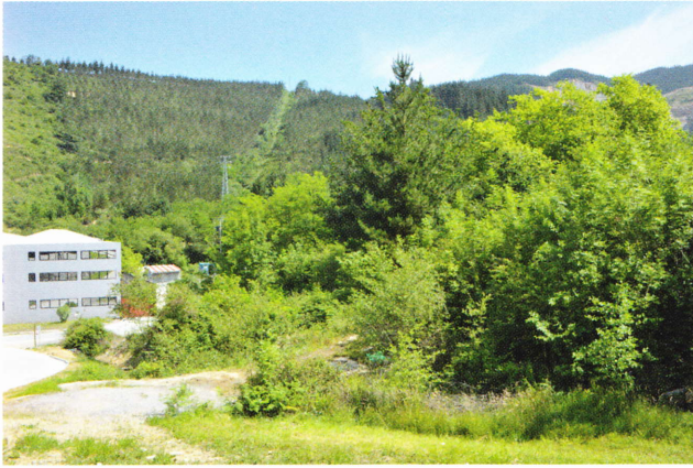
Figure 154: Lacerta schreiberi , habitat en périphérie d'Elgoibar (Guipuscoa, 70 m, 20 mai 2011). Il s'agit d'un bosquet caducifolié établi sur une zone humide (sources et suintements), aujourd'hui détruit par l'extension de la zone industrielle que l'on aperçoit à l'arrière-plan. L'espèce est probablement éteinte à cet endroit désormais, si bien que les photos de cette monographie revêtent un caractère tristement testimonial.