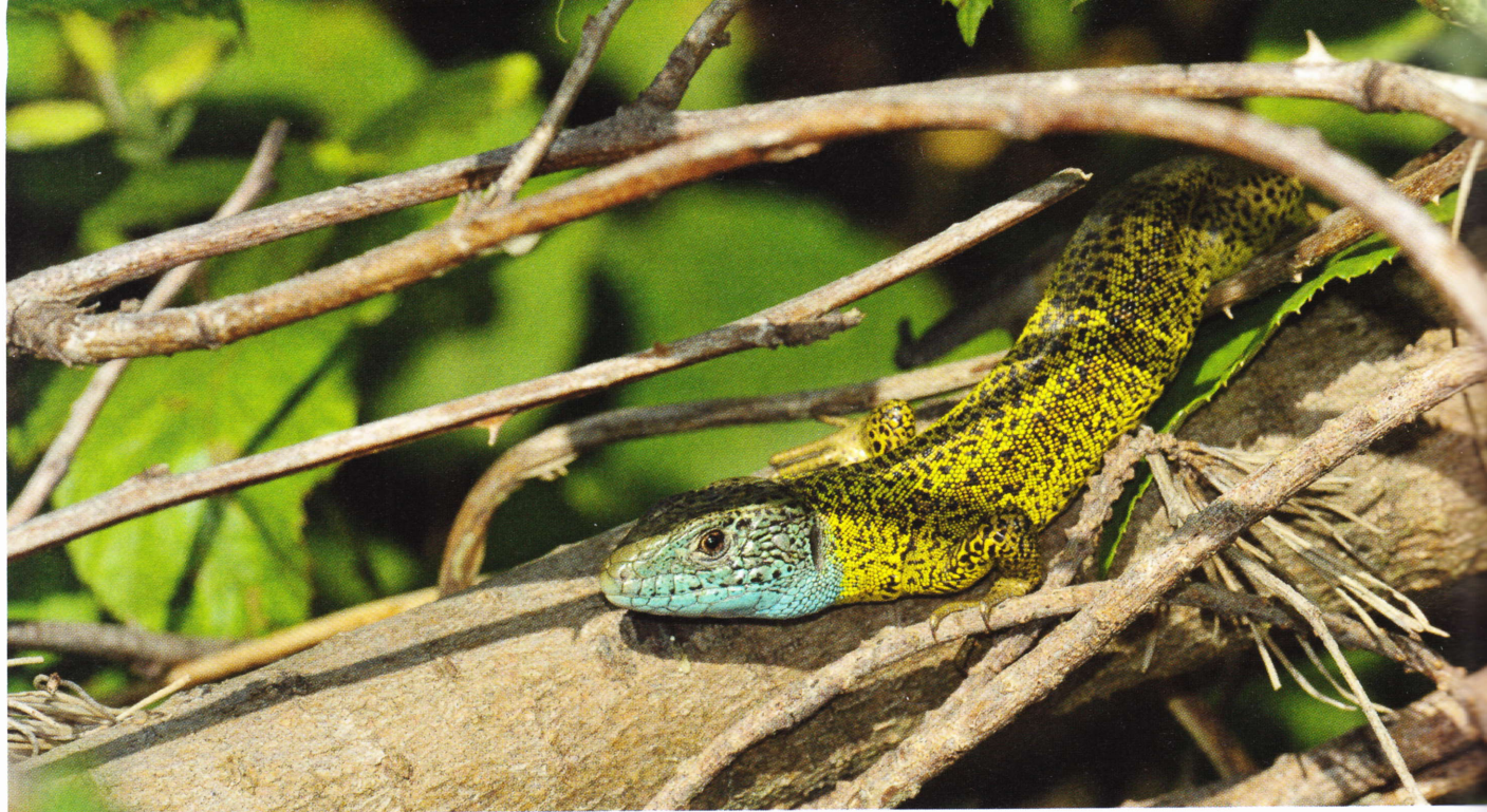
Figure 151 : Lacerta schreiberi , mâle adulte observé en périphérie d'Elgoibar (Guipuscoa, 70 m, 20 mai 2011).

tachetée de noir et offre parfois une coloration bleutée discrète (rarement bleue) à hauteur des tempes et des labiales inférieures.