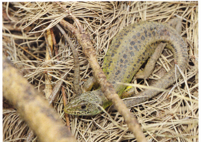
Figure 152: Lacerta schreiberi , femelle adulte également observée en périphérie d'Elgoibar à quelques mètres du mâle de la figure précédente (Guipuscoa, 70 m, 20 mai 2011).

Le régime alimentaire de l'espèce, comparable à celui de Lacerta bilineata , inclut de nombreux arthropodes, principalement des insectes et des araignées. Dans la cordillère Cantabrique (prov. de León), Domínguez & Salvador (1990) citent les proportions taxinomiques suivantes, par ordre décroissant d'importance : 48,4 % de coléoptères, 14,6 % d'orthoptères, 12,3 % d'araignées, 6,3 % de lépidoptères, 5 % de diptères et d'hyménoptères, 2,7 % d'hétéroptères et 1,3 % de crustacés et gastéropodes. Les arthropodes indéterminés et les groupes taxinomiques non cités représentent moins de 1 % du régime. Localement, lorsque l'habitat des lézards jouxte des milieux