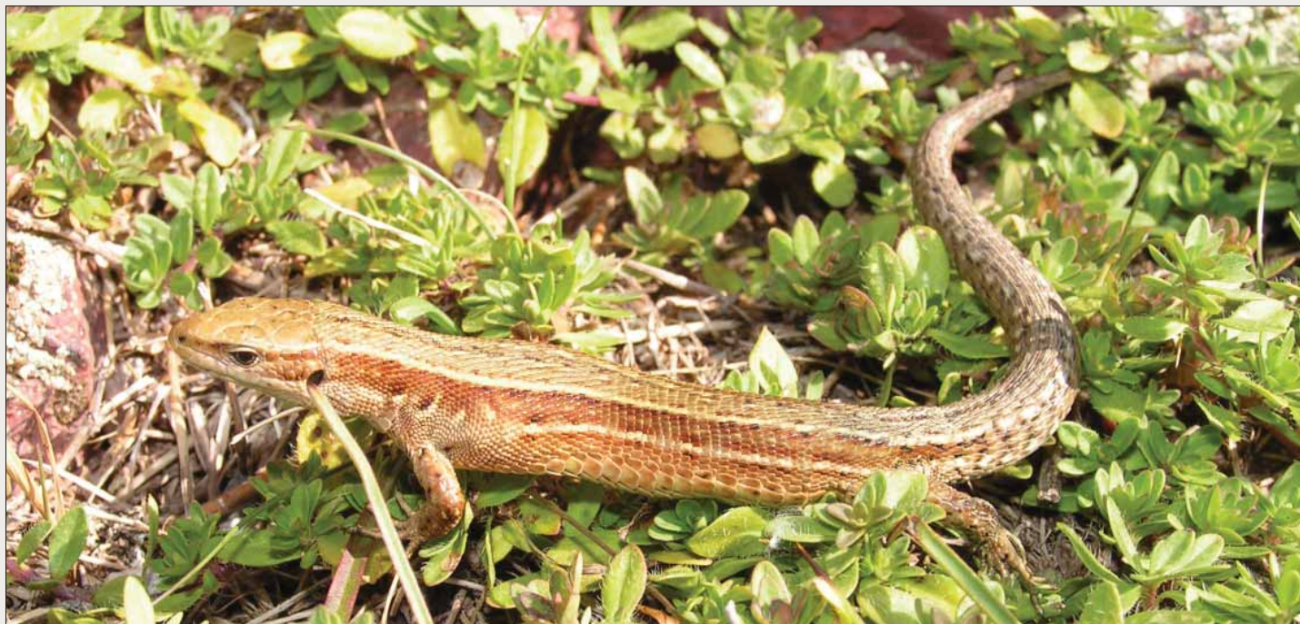
Slika 91. Živorodna gušterica/ Viviparous lizard/ Zootoca vivipara

Rasprostranjenost u svijetu i Hrvatskoj: Nastanjuje većinu Europe uključujući arktički dio Skandinavije, Veliku Britaniju i Irsku, međutim ne dolazi na većem dijelu Mediterana. Južna granica rasprostranjenosti je sjeverna Španjolska, Italija, gorska Hrvatska, Crna Gora, Makedonija, Bugarska. Ne dolazi na području oko Crnog mora. Rasprostranjena je i velikim dijelom sjeverne Azije skroz do Pacifičkog oceana i Japana. Ova vrsta se pojavljuje sjevernije od drugih gmazova, u Norveškoj i do 70°N što je čak 350 km sjevernije od arktičkog kruga. U Hrvatskoj je zabilježena u sjeverozapadnim kontinentalnim i gorskim područjima, gdje naseljava staništa s hladnijom i vlažnijom gorskom/planinskom klimom. Iako postoji nalaz živorodne gušterice s područja kanjona rijeke Krke (De Luca i sur., 1990), vrlo je vjerojatno da se radi o krivoj iden-