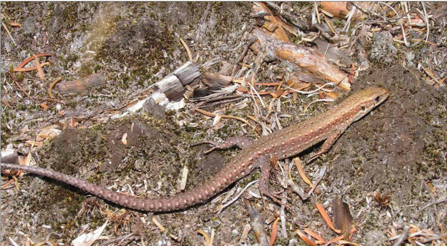
Slika 93. Panonska živorodna gušterica/Pannonian viviparous lizard/ Zootoca vivipara pannonica