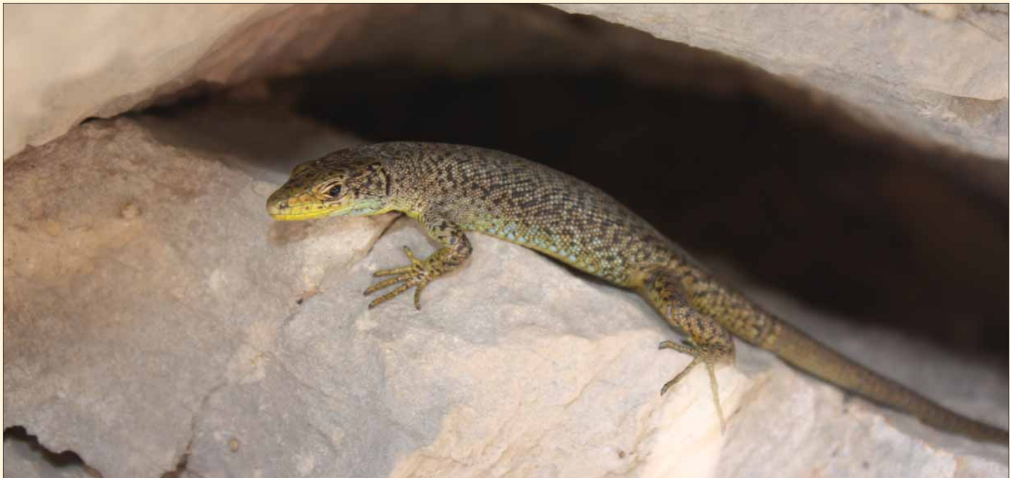
Slika 73. Mosorska gušterica/Mosor Rock Lizard/ Dinarolacerta mosorensis

Rasprostranjenost u svijetu i Hrvatskoj: Mosorska gušterica je stenendem Dinarida. Naseljava krške planine jugoistočne Hrvatske te južne dijelove Bosne i Hercegovine i Crne Gore. Potencijalno je prisutna i u zapadnom dijelu Albanije (Bischoff, 1984a, Džukić, 1989). Izolirana populacija s Prokletija u Crnoj Gori od nedavno je opisana kao zasebna vrsta D. montenegrina (Ljubisavljević i sur., 2007). U Hrvatskoj naseljava planine Kozjak, Mosor, Biokovo (Džukić, 1989) i Opor (Janev Hutinec i sur., 2006). Džukić (1989) opisuje i muzejske primjerke s navedenim lokalitetima Sinj i Troglav (Prirodoslovni muzej u Beču), no te populacije nisu potvrđene u novije doba.