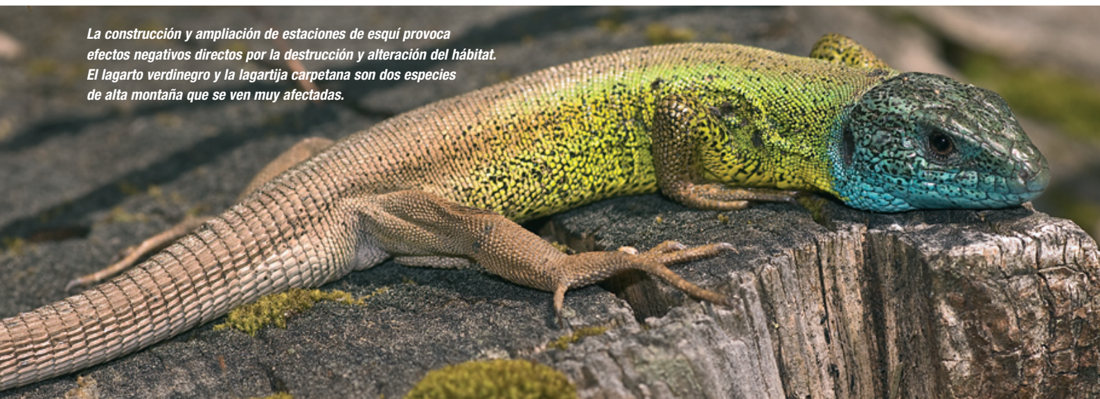
La construcción y ampliación de estaciones de esquí provoca efectos negativos directos por la destrucción y alteración del hábitat. El lagarto verdinegro y la lagartija carpetana son dos especies de alta montaña que se ven muy afectadas.

Otro reptil serrano, que podemos considerar como el menos habitual y más raro de encontrar en nuestro