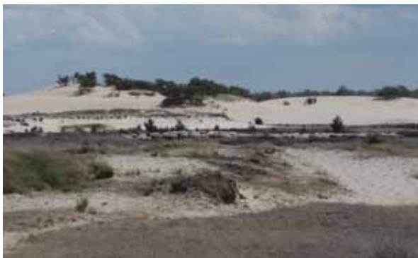
Loonse en Drunense Duinen

past de levendbarende hagedis zijn gedrag daar op aan en zijn in drogere, warme omgevingen minder actief en produceren tevens minder jongen. Aanwezigheid kan soms pas na enkele bezoeken worden aangetoond, soms zelfs pas na jaren.