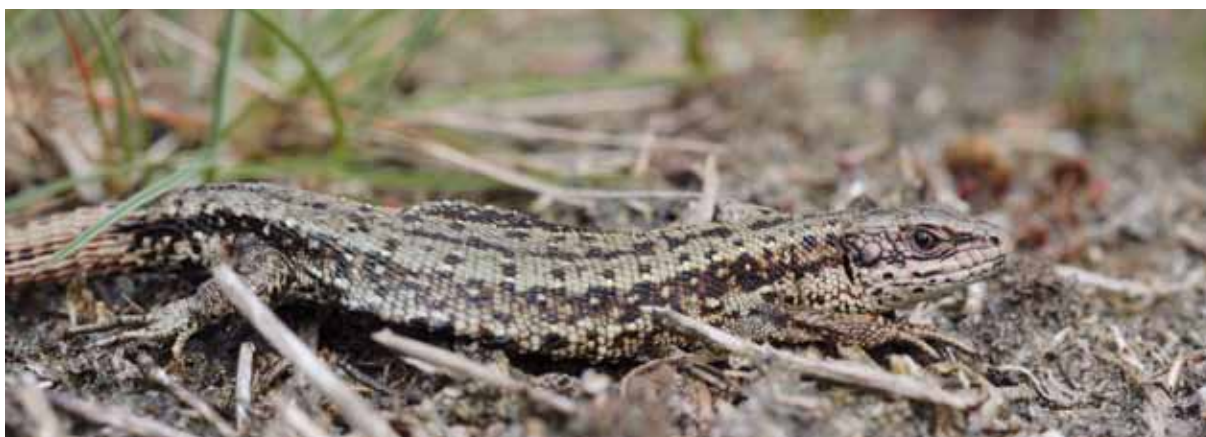
Levendbarende hagedis

2014 worden o.a. gefaseerd bomen verwijderd van heideterreinen en vinden er plagwerkzaamheden plaats om het oppervlak aan stuifzand te vergroten. Om vergrassing tegen te gaan wordt er, nu nog periodiek, begraasd met een schaapskudde.