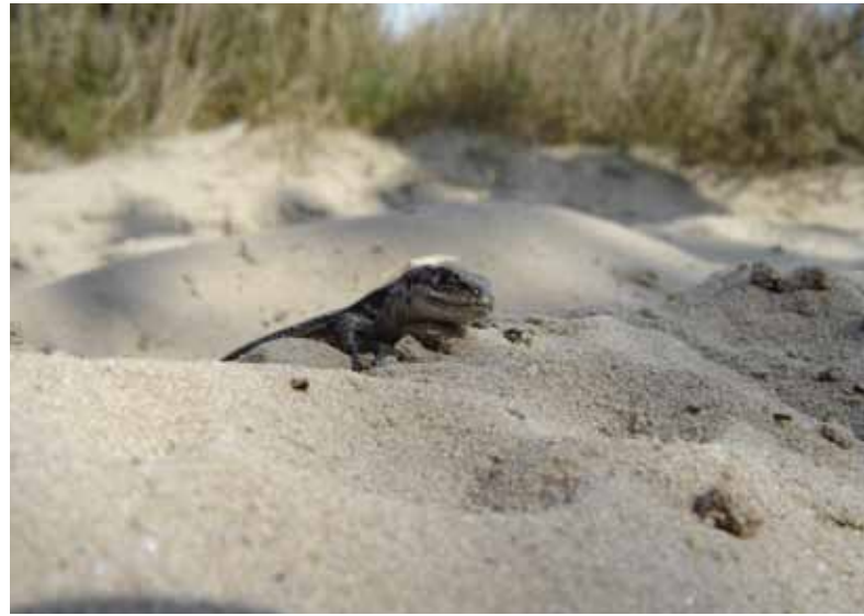
Levendbarende hagedis; de enige waarneming op het zand

Op het oog lijkt binnen het Nationaal Park voldoende geschikt habitat aanwezig. Toch worden hagedissen maar mondjesmaat