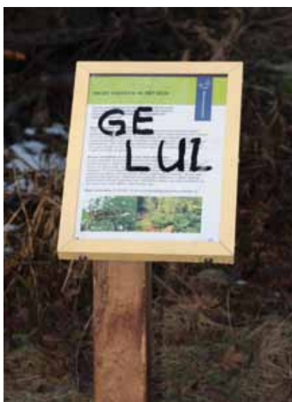
Werkzaamheden zijn lastig uit te leggen

positief voor de hagedis kunnen beïnvloeden en zijn op het laatste moment betrokken binnen het LIFE+ projectplan stuifzandherstel. De levendbarende hagedis heeft zeker en gelukkig de aandacht maar bevindt zich soms in een lastige spagaat met andere natuurwaarden en toerisme. Goede locaties worden, waar mogelijk, ontzien binnen de toekomstige projecten. Voorafgaand aan het stuifzandherstelplan hebben ook werkzaamheden door Natuurmonumenten plaatsgevonden die op de langere termijn een positief effect moeten hebben op de populatie. Zo is er in 2008 een doorgang gekapt met als doel een aantal versnipperde heidevelden met elkaar te verbinden en uitwisseling van verschillende deelpopulaties te verbeteren. Ook wordt er dood hout aangevoerd op en langs heideterreinen en houtstapels gemaakt. Gekapte bomen blijven soms liggen en geven de hagedis voldoende schuil- en zonplaatsen. Een aardige waarneming was het vinden van een hagedis in de takken van recent gekapte bomen.