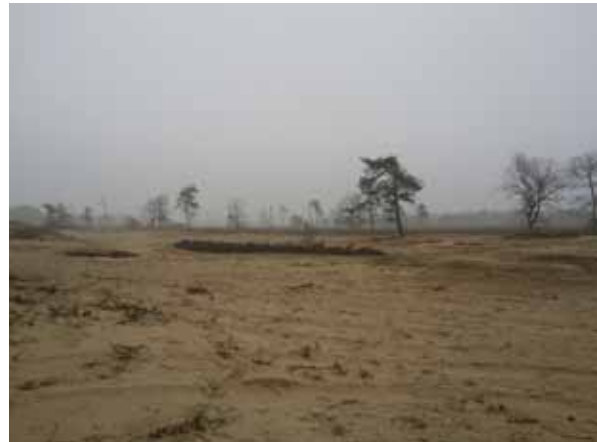
Klein stukje heide voor (links) en na (rechts) uitvoering herstelwerkzaamheden