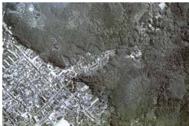
Figuur 1. Luchtopname van het studiegebied aan de westelijke rand van Bonn-Bad Godesberg.

Aangezien ik als zoöloog gewervelden en in het bijzonder de herpetofauna onderzoek, was ik blij met de hulp van collega-conservatoren van het Museum Koenig (ZFMK) bij het determineren van diverse groepen ongewervelden. De nadruk lag op verschillende groepen geleedpotigen, namelijk spinnen, duizend- en miljoenpoten, libellen, sprinkhanen, de bijen en wespen uit de superfamilie Apoidea en zweefvliegen. Hun diversiteit op deze smalle strook op de helling bleek echt opmerkelijk. Het lukte bijvoorbeeld om, fotografisch en ook door middel van het verzamelen van bewijsexemplaren, 74 soorten spinnen (Arachnida: Araneae) aan te tonen. Maar met diversiteit wordt hier niet enkel het aantal soorten bedoeld (soortenrijkdom), maar het wordt ook gebruikt om de diversiteit aan