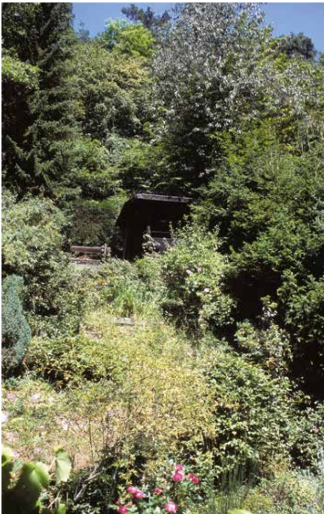
Figuur 2. Zomeraspect van de helling waar de waarnemingen zijn verricht.

eigenschappen en overlevingsstrategieën uit te drukken. Spinnen bieden tal van mogelijkheden om uniek gedrag te observeren en fotograferen. Een voorbeeld is het vermogen van de krabspin ( Misumena vatia ) te verschuiven van camouflerende mimesis (nabootsing) in een bloem in de richting van agressieve (Peckhamiaanse) mimicry, wanneer deze helder gele spin een bloem imiteert en daardoor succesvol insecten als prooi aantrekt. Ook de voortplantingsstrategie van de spinnen Agelene labyrinthica en Xysticus lanio is fascinerend. Bij de eerste soort immobiliseren de mannetjes de vrouwtjes door doelgerichte aanraking, terwijl mannetjes van de tweede soort via een symbolische voeding voorkomen tijdens de copulatie verorberd te worden door het vrouwtje. Duizend- en miljoenpoten vormen een minder soortenrijke groep (n = 14 tot nu toe). Interessant is dat een aantal soorten warmteminnend is en juist hier aan de noordrand van hun verspreidingsgebied voorkomt. Een voorbeeld is de miljoenpoot Glomeris intermedia . Ook het aantal libellen- en sprinkhaansoorten is niet erg hoog, maar ze leverden een aantal opmerkelijke vondsten op. Voorbeelden zijn de regionaal zeldzame gewone pantserjuffer ( Lestes sponsa ) en bruine winterjuffer ( Sympetma fusca ) en de zeldzame en voor kleine, schone kwelstroompjes zeer karakteristieke Zuidelijke bronlibel