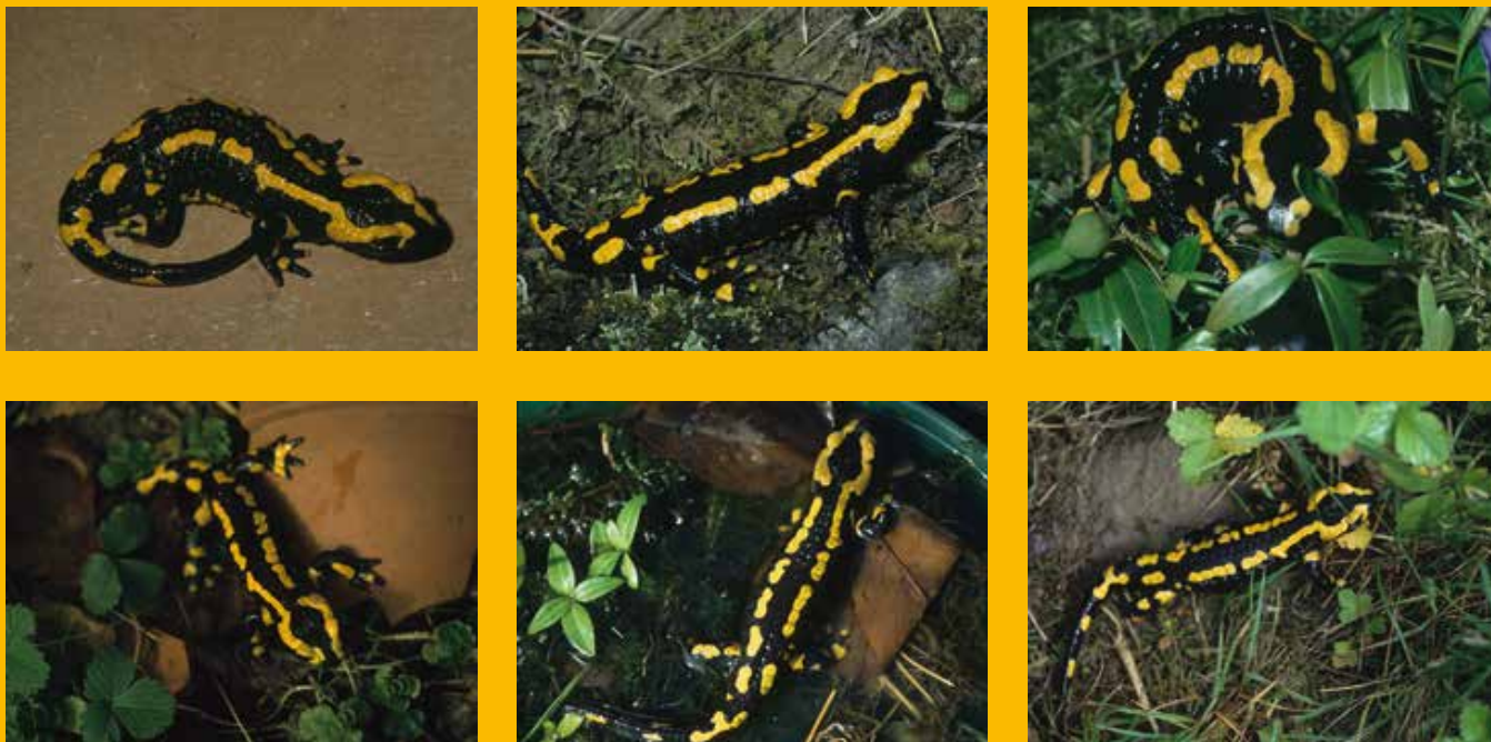
Figuur 3. Het vrouwtje vuursalamander dat in tien jaar tijd zes keer is teruggevonden.

veel ronde bultjes vertoonden, verspreid over het hele lichaam, de ledematen en staart. Waarschijnlijk ging het daarbij om dezelfde infectie ( Amphibiocystidium ) die onlangs voor deze soort in Nederland werd beschreven (Spitzen & Stark, 2015). In de afgelopen jaren kwam de aandoening hier niet meer voor.