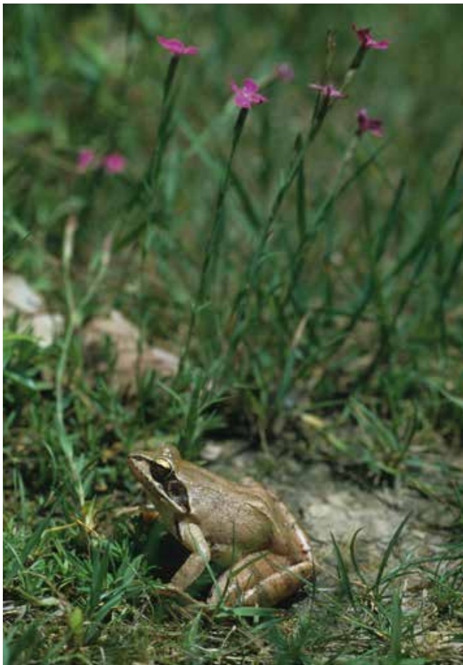
Figuur 4. Springkikker ( Rana dalmatina ), gefotografeerd in de beschreven habitat bij de beschermde steenanjer ( Dianthus deltooides ).

For three decades, the invertebrate as well as vertebrate fauna of a small piece of land (1,000 m 2 ) close to the Rhine on the western margin