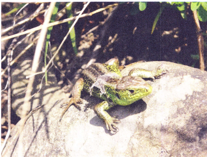
Lucertola agile, giovane maschio in muta (RM)