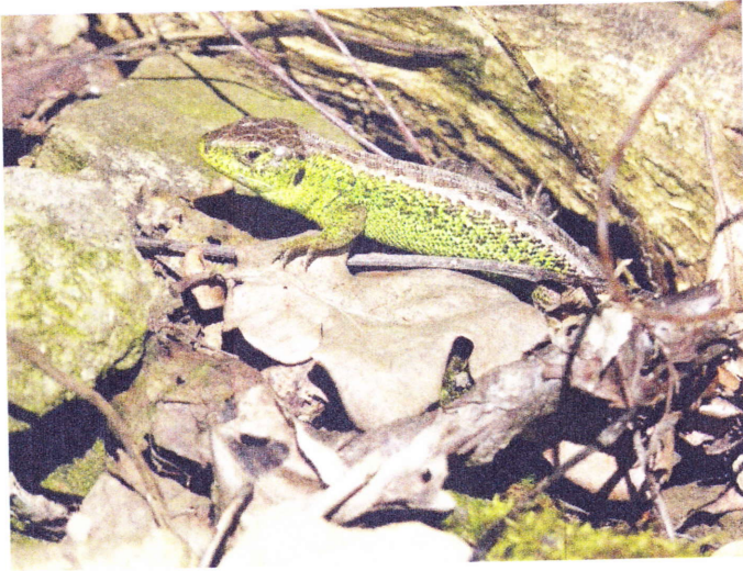
Lucertola agile, Kamionka Wielka, Polonia (RM)