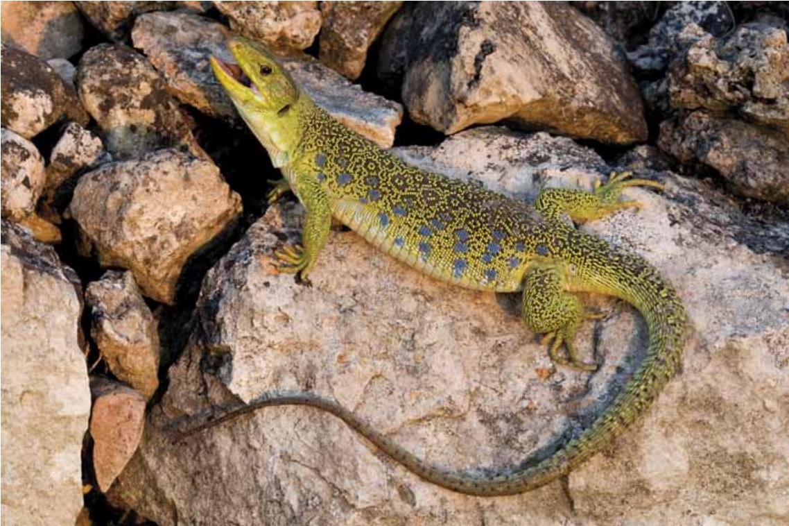
Llangardaix ocel·lat adult