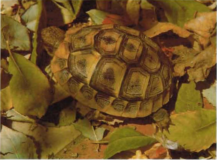
La tortuga mediterrània es troba només al massís de l'Albera.

ment ingerit. En llocs amb suficient calor ambiental, però amb poca quantitat d'aliment un ectoterm es veurà molt afavorit, ja que tot l'aliment ingerit s'aprofita per realitzar altres activitats que no siguin la producció de calor. En realitat, un ectoterm funciona com una calculadora solar que aprofita l'energia directament de la llum. Si la llum és abundant i constant, tenir una calculadora solar es més rendible que una calculadora de piles. Com a conseqüència, els rèptils predominen als deserts, zones més àrides i càlides amb menys quantitat d'aliment.