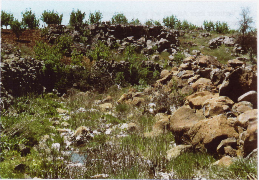
Abb. 2. Lebensraum von Lacerta cf. kulzeri 10 km östlich As Suweida. Im Vordergrund ein Resttümpel, in dem eine Eidechse badete.