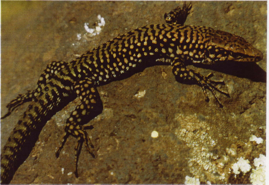
Abb. 3. Männliche Lacerta cf. kulzeri vom Dj. Druz.