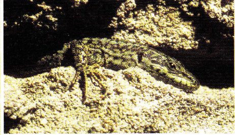
Abb. 5 (oben). Bei sonniger, aber kalt-windiger Witterung bewegen sich Mauereidechsen (hier: Podarcis hispanica 2 ) bei Cheleiros/ nördlich Serra de Sintra) nicht aus den Spaltennischen (Lufttemperatur an der Felswand um 13 Uhr +14 °C; in der Felsspalte +26 °C).