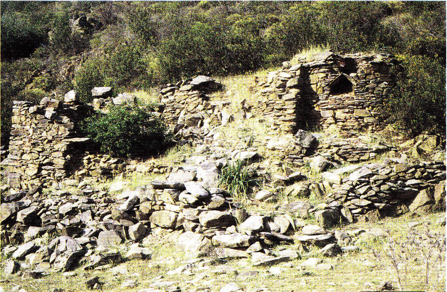
Abb. 3. Mühlenuine am Rio Carreiras (südlich Mértola/Baixo Alentejo); Habitat von winteraktiven Psammodromus algirus , Chalcides bedriagai , Tarentola mauritanica , Hemidactylus turcicus , Blanus cinereus und Schlangen (Arten wie in Abb. 1., zusätzlich Natrix maura ).