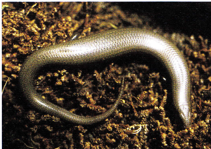
Abb. 6. Chalcides bedriagai (Weibchen aus der Serra da Malcata) nimmt thigmotaktisch Wärme aus den oberen Bodenschichten und unter Steinen auf.

Hanglagen am Rande dichter Macchiavegetation mit sich rasch erwärmendem vegetationsfreiem Boden, bzw. einer Streuschicht mit abgestorbenem Laub oder Nadeln (besonders Talhänge von Flüssen und Dünen); häufig trifft man ihn auch am Fuß von Stützmauern, Ruinen und Felswänden, wo er sich gelegentlich sogar als Felskletterer betätigt. Einer Langzeitbeobachtung in der Serra de Grândola zufolge tritt die höchste Abundanz juveniler Sandläufer im Jahresverlauf im Monat Februar auf (REBELO & CRESPO 1999). Adulti scheinen im Gegensatz zu den Jungtieren eine obligatorische Winterruhe zwischen November und Ende Februar einzulegen. Lediglich im Küstenstreifen des südlichen Algarve konnte ich einmal unter besonders günstigen klimatischen Bedingungen aktive Adulti im Winter beobachten (13.01.1999: Olhos d' Agua, Küstenkante; südexponierte Mergelflächen mit lückigem Juniperus-Bewuchs; intensive Insolation. +19 °C; 14 Uhr).