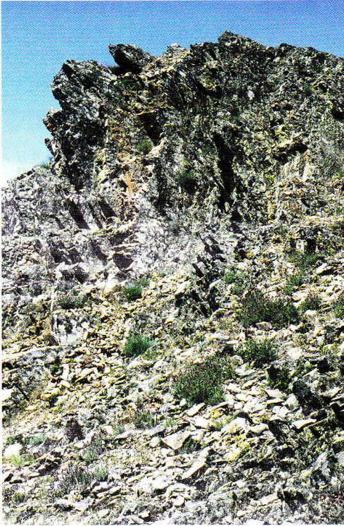
Abb. 1. Spaltenreiche Rippe eines Quarzithärtlings im Schiefer mit Plattenschutt (bei Barrancos/Baixo Alentejo); hier befinden sich ideale Bedingungen zur Ausbildung von Wärmenischen im Winter. Felsrippe: Tarentola mauritanica , Podarcis hispanica ; Plattenschutt: Timon lepidus , Psammodromus algirus , Chalcides bedriagai , Blanus cinereus und Schlangen ( Coluber hippocrepis , Coronella girondica , Macroprotodon cucullatus , Elaphe scalaris , Malpolon monspessulanus ).