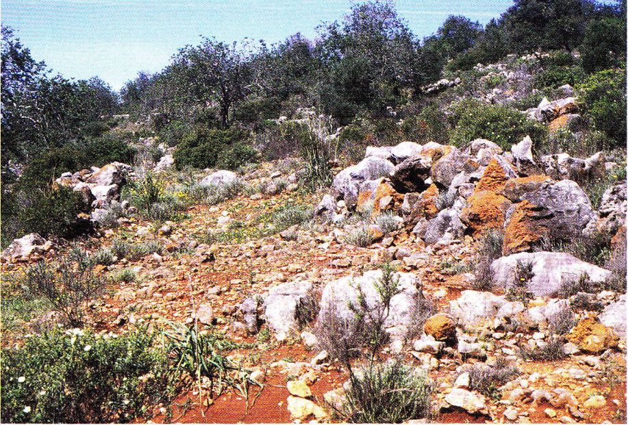
Abb. 2. Karst im Jurakalk (bei Alte/Algarve); Habitat von Timon lepidus , Psammodromus algirus , Psammodromus hispanicus , Tarentola mauritanica .