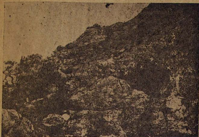
Рис. 1. Вход в пещеру Сулузага. Белыми крестиками обозначены слева направо: 1. гнездо синего каменного дрозда, 2. гнездо поползня, 3. гнездо горной ласточки, 4. гнездо каменного воробья.

В дуплах деревьев и среди площадок корней густых кустов можжевельника гнездятся совки ( Otus scops pulchellus ), на ветвях, по-