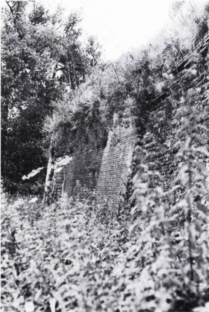
Figuur 2. Een muur van de Bossche Fronten, Maastricht, waar de Muurhagedis, Lacerta muralis (Laurenti, 1768) voorkomt.

kunde "Lacerta" (verder: HGD-archief) materiaal van Slenaken; in de ZMA verzameling materiaal van Valkenburg; en in de verzameling naturalia van het Amsterdams Lyceum materiaal van Ommen. (Er is ook, blijkens de berichten, materiaal te Helpman en te Deventer verzameld en geconserveerd, maar het is nog niet gelukt te ontdekken of dat zich nog ergens bevindt of dat het als verloren moet worden beschouwd.)