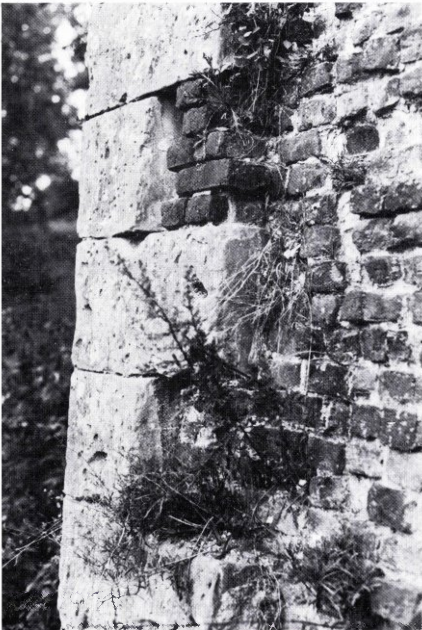
Figuur 3. Detail van de muur van fig. 2