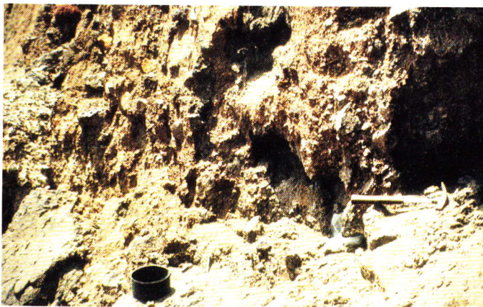
Abb. 7. Die Fundstelle des Schädels und Skeletts von Gallotia goliath hinter der Playa de las Teresitas.

Es war der 4. April 1985, ein wunderschöner, sonniger Tag – also die ideale Voraussetzung dafür, dass sich meine Reisebegleiterinnen, ohne zu murren, stundenlang am Strand vergnügen konnten, während ich im Schweiß und Staube meines Angesichts an den Schutthalden des Anaga-Gebirges meinem Vergnügen nachging. Die Schichtenfolgen musternd, schlenderte ich am Fuß der Halden entlang. Stets hatte ich ein Konglomerat miteinander verbackenen Gerölls unterschiedlicher Größe vor mir, wurde dann aber stutzig, als sich an der Basis eines Anschnitts eine größere Fläche feinen, schwarzen Lavasandes zeigte. Hier hatte die Schutthalde eine Sanddüne überlagert (Abb. 7). Bei näherer Betrachtung dieser Fläche, sah ich inmitten des feinen,