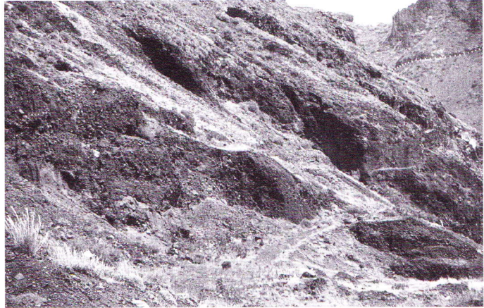
Abb. 5. Angeschnit- tene Schutthalden hinter der Playa de las Teresitas.

Nachdem ich bereits 1981 auf die fossilführenden Schichten an dieser Stelle aufmerksam geworden war, besuchte ich sie in den Jahren 1985, 1986, 1989 und 2001 immer wieder, um gezielt zu suchen und zu graben. Wie bereits oben geschildert, erkennt man sie durch die zahlreichen, weiß aus den grauen bis braunen Hanganschnitten „herausleuchtenden“ Schneckenhäuser. Sie sind längst nicht überall hinter dem Parkplatz zu finden, dafür aber an einigen Stellen gleich dreifach übereinander. Betrachtet man diese Stellen dann etwas näher, wird man sehr schnell fündig und sieht die meist bräunlich verfärbten Wirbel und andere Knochen von Rieseneidechsen. Diese sind tatsächlich auf den Bereich der „Schneckenschichten“ konzentriert. Vereinzelt findet man sie aber auch an anderen Stellen der Hanganschnitte. Dorthin sind sie wohl bei Hangrutschungen gelangt.