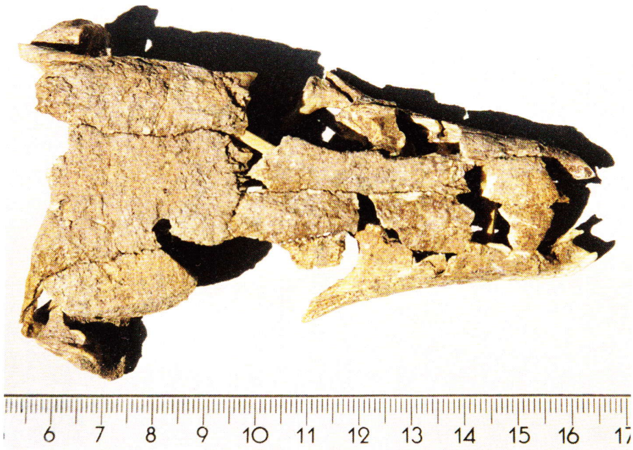
Abb. 15. Der aus Einzelteilen wieder zusammengefügte deutlich größere Schädel einer Gallotia goliath von der Playa de las Teresitas.

Auch auf den Nachbarinseln erreichten sie derartige Dimensionen. HELMDAG (2000) stellt eine vollständige rechte Unterkieferhälfte von Gallotia simonyi bravoana von der Insel La Gomera vor, die 11,4 cm lang ist und berichtet gleichzeitig vom