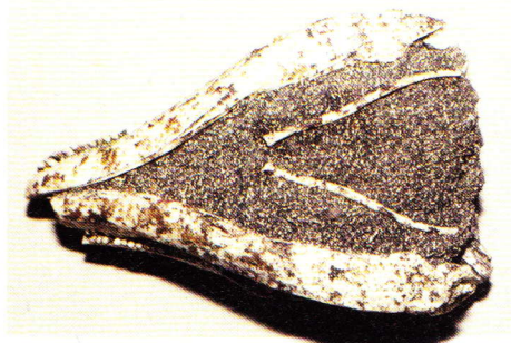
Abb. 10. Während der Präparation wurde das Zungenbein freigelegt.