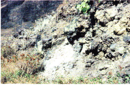
Abb. 1. Conchero der Ureinwohner im Caserio Guinea auf El Hierro.