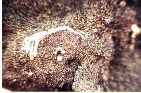
Abb. 8. Weiß leuchtete mir die Hinterseite des Schädels im dunklen Lavasand entgegen.