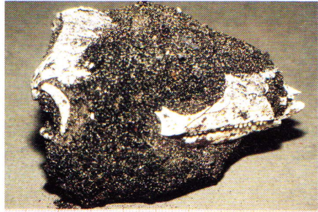
Abb. 9. Der in einem Sandklumpen geborgene Schädel. Die Maulspitze ist abgebrochen.