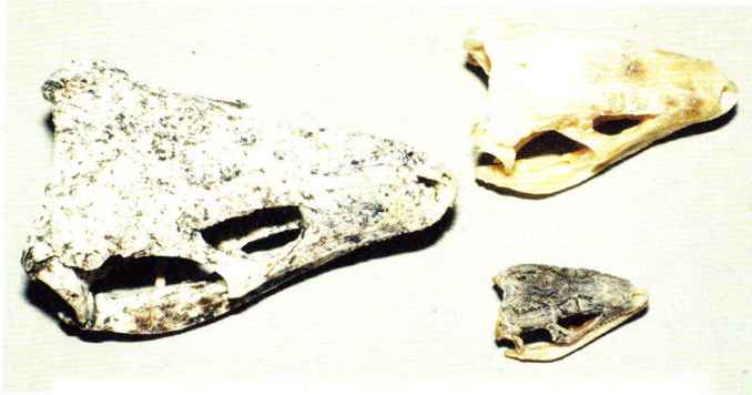
Abb. 14. Der Schädel von Gallotia goliath im Größenvergleich mit Schädeln von Gallotia stehlini und Gallotia galloti .

und ist damit erheblich größer als der vollständig erhaltene Schädel (Abb. 15). Doch zeigt auch er noch nicht die maximale Größe an, die diese riesigen Eidechsen erreichten. Einige Einzelknochen und Bruchstücke, die ich auf Tenerife fand, stammen eindeutig von noch größeren Exemplaren.