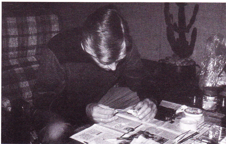
Abb. 11. Zum Schluss klebte ich die abgebrochenen Teile der Maulspitze wieder an.

Der Schädel ist 8,4 cm lang. Damit stammt er von einem relativ kleinen Exemplar, wie der Größenvergleich mit gefundenen Einzelknochen zeigt. Dennoch wirkt er den Schädeln rezenter kanarischer Eidechsen gegenüber gewaltig. Auf Abbildung 14 ist