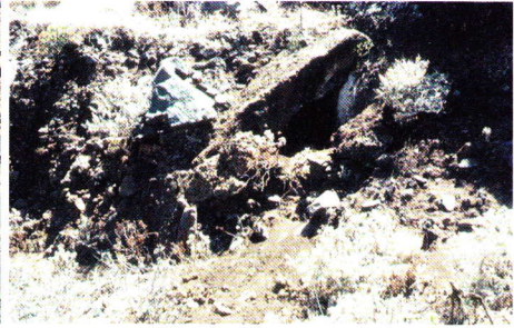
Abb. 2. Diese kleine Höhle im Barranco de Fajana auf der Anaga-Halbinsel wurde aus übereinandergetürmten Felsbrocken gebildet. Fundstelle von Canariomys bravoii und Gallotia goliath .

1. Concheros (Abfallhaufen der Ureinwohner): Diese bestehen überwiegend aus den Schalen mariner Mollusken (Patella), beinhalten aber auch Fisch-, Ziegen-, Kaninchen- und zuweilen Eidechsenknochen (Abb. 1). Die Eidechsen mögen hier Nahrungsreste gesucht haben und sind umgekommen. Verkohlte Knochen zeigen aber, dass sie eindeutig auch gejagt und von den Guanchen verzehrt wurden. „Eidechsenhaltige“ Concheros sind auf Tenerife eher selten zu finden.