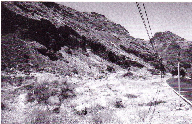
Abb. 4. Der Parkplatz hinter der Playa de las Teresitas bei San Andrés.

Dieser, in einer Bucht künstlich angelegte Strand befindet sich bei San Andrés, an der Südküste der Anaga-Halbinsel, circa 6 km nordöstlich der Inselhauptstadt Sta. Cruz de Tenerife. Für die Badegäste wurde hinter dem Strandbereich ein großer Parkplatz geschaffen (Abb. 4). Dafür mussten die unteren Bereiche gewaltiger Schutthalden des Anaga-Gebirges teilweise abgetragen werden. Die Umgebung des Parkplatzes ist sehr naturnah belassen und in den hangnahen Bereichen schütter bewachsen (Abb. 5). Man kann sich hier zunächst am munteren Treiben vieler Kanareneidechsen ( Gallotia galloti eisentrauti ) erfreuen.