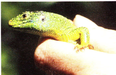
Abb. 5. Portrait eines Männchens von Lacerta bilineata chlorosecunda .