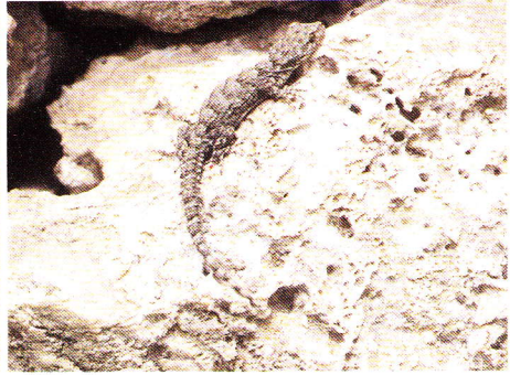
Abb. 4. Ägäischer Nacktfinger Cyrtopodion kotschy bibroni im Lebensraum.