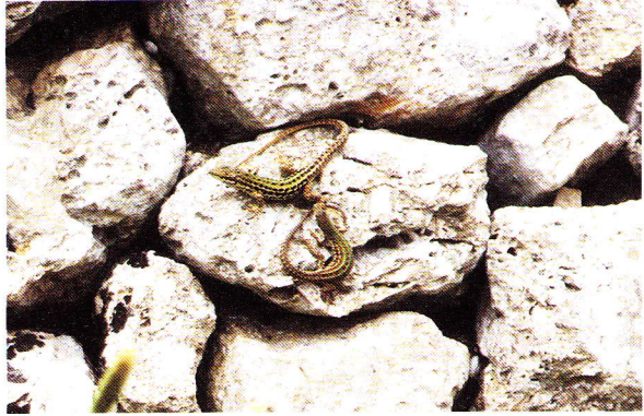
Abb. 2. Pärchen von Podarcis sicula campestris .

Zeichnung und Färbung der Ruineidechse sind in dieser Region außerordentlich variabel. Die kontrastreiche Rückenzeichnung besteht meistens aus schwarzen Flecken mit zusammenhängenden Längsstreifen (Abb. 2). Es kommen aber auch weitgehend zeichnungslose Tiere vor. Die Grundfärbung ist ein Grün in verschiedenen Abtönungen. Wir fanden aber auch vereinzelt Ruineidechsen, die nur eine braune