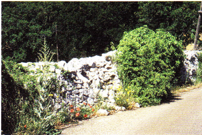
Abb. 1. Legesteinmauer als Lebensraum von Podarcis sicula campestris und Cyrtopodion kotschyi bibroni .

Die häufigste Lacertide dieser Region ist die Ruineneidechse Podarcis sicula campestris DE BETTA, 1857. Wir fanden sie in fast allen Biotoptypen. Sie war im Hinterland genau so oft zu finden, wie an der Küste. Auch an und auf den Mauern unserer Unterkunft (Trullo) konnten wir sie in großer Zahl antreffen. Am häufigsten fanden wir sie jedoch an Legesteinmauern (Abb. 1), Wegrändern und Straßenböschungen. Wir konnten sie nur einmal syntop mit der Smaragdeidechse Lacerta bilineata clorosecunda antreffen. Während sich die Smaragdeidechse in einer Waldlichtung aufhielt, konnten wir die Ruineneidechse direkt an der Legesteinmauer finden, die den Wald umschloss. Die Fluchtdistanz war recht hoch. Zwischen den einzelnen Biotopen konnten keine großen Unterschiede in der Distanz zum Tier gemacht werden. Schwanzregenerate waren selten.