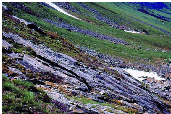
Figura 2. Hábitat de la lagartija aranesa. Canchales y afloramientos de rocas en el alto valle del Forcall.

La especie habita en afloramientos rocosos, taludes de roca, piedras o cascajo, o bien en pastizales pedregosos con fragmentos de roca, dependiendo de las características geológicas de la localidad en cuestión (habita principalmente pizarras, esquistos y calizas, todas ellas de edad paleozoica) y de la inclinación y vegetación de cada sitio.