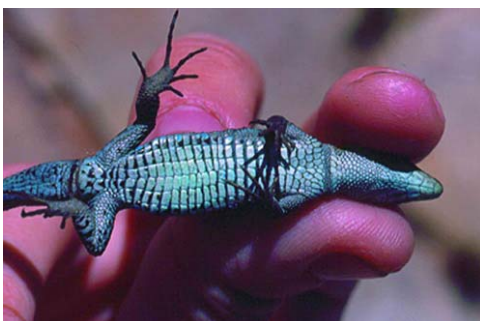
Figura 2. Aspecto ventral de la lagartija aranesa.