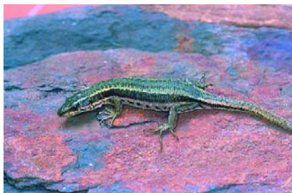
Figura 1. hembra de lagartija aranesa.

También se conoce un ejemplar con una fuerte asimetría en el desarrollo de ambos lados del cuerpo, lo que constituye una variación extremadamente rara (Arribas, 2001).