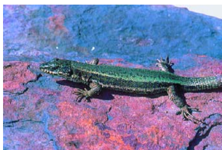
Macho de Iberolacerta aranica .