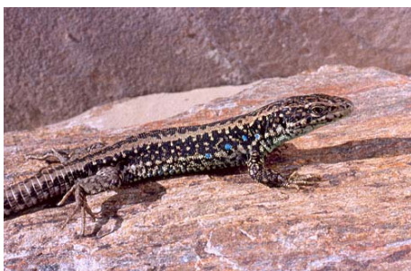
Macho de Iberolacerta galani . © Oscar Arribas.