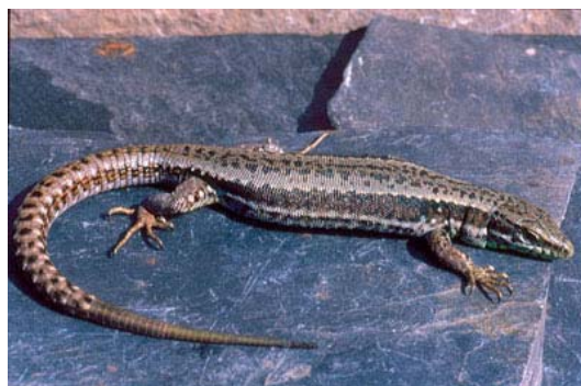
Figura 2. Hembra de Iberolacerta galani .

sino uniformes, con sus áreas marginales (especialmente el reborde superior) más oscuras (prácticamente negras) y el área interior de las bandas más clara (marrón). Borde superior de esta banda temporal (=costal) también aserrado, encerrando puntos más claros, más visibles en los animales jóvenes, pero también en los adultos. Las hileras de puntos claros en las partes inferiores de los costados menos marcadas, así como la línea lateral inferior, que es borrosa y raramente aparece en forma de manchas. Vientre verde amarillento. Ocelos azules como en los machos pero menos abundantes y más pequeños. Contrariamente a los machos, el moteado negro aparece usualmente en el centro (o en las partes posteriores) de las escamas ventrales de las hileras de escamas ventrales más externas, y frecuentemente está casi borrado. Más raramente existen pequeños puntos en la segunda hilera más externa de ventrales (Arribas et al., 2006).