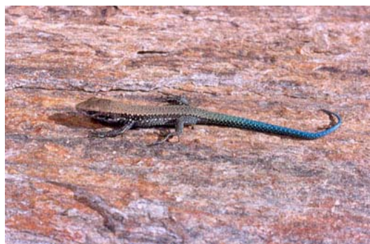
Figura 3. Recién nacido de Iberolacerta galani .

Crías (de Sierra Segundera y Teleno): Dorso con color de fondo amarillento grisáceo. Tracto dorsal finamente moteado con manchas irregulares en el área vertebral, que pueden ser muy borrosas y apenas distinguibles. Bandas temporales ligeramente reticuladas en las crías macho y más uniformes en las crías hembra (existe un cierto dimorfismo sexual desde el nacimiento). Vientre sin pigmento de color, con las ventrales más externas bien moteadas, pero con la segunda hilera (las intermedias) y la tercera (la interna) menos marcadas. Cola azul (Arribas et al., 2006).