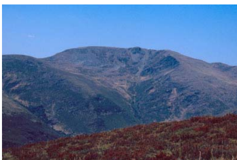
Figura 2. Hábitat de Iberolacerta galani . Sierra del Teleno (León).

Las áreas inferiores actualmente habitadas por I. galani probablemente han sido colonizadas por la especie en tiempos históricos, a raíz de la destrucción del bosque para la obtención de pastos. Igualmente, la especie puede habitar la vegetación azonal por debajo de su límite altitudinal en situaciones especialmente favorables de temperatura y humedad, como en cañones fluviales. Estas zonas bajas se incluyen en las series Supramediterráneas y Altimontanas Estrellense, Orensano-Sanabriense y Galaicoportuguesa silicícola de Betula celtiberica o abedul ( Saxifraga spathularidi-Betuleto celtibericae sigmetum ) y están constituidas