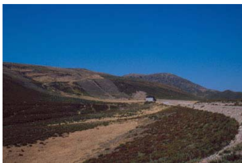
Figura 1. Hábitat de Iberolacerta galani . El Morredero (León).

Los substratos rocosos que habita son bastante diversos: en Sanabria y la Sierra de la Cabrera vive sobre rocas ígneas poco fisuradas (granitoides “Olló de Sapo” y otros de tipo sincinemático de edades inciertas); en el Teleno y Trevinca vive sobre lajas de pizarras negras del Ordovícico Medio, muy apreciadas para la construcción, lo que podría constituir un peligro para su conservación en algunas áreas; y en las cumbres de estas sierras (Teleno y Cabrera) viven sobre las duras cuarcitas armoricanas que constituyen los materiales resistentes a la erosión de estos picos.