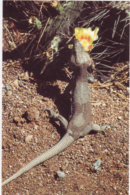
Abb. 10. Männliche Gallotia stehlini vor Opuntienblüte im Palmitos-Park.