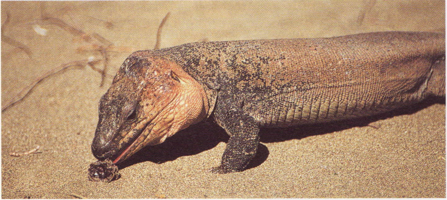
Abb. 3. Das Männchen hat die erste Rosine entdeckt.