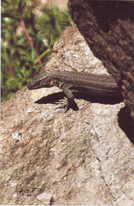
Abb. 9. Weibliche Gallotia stehlini im Palmitos-Park.