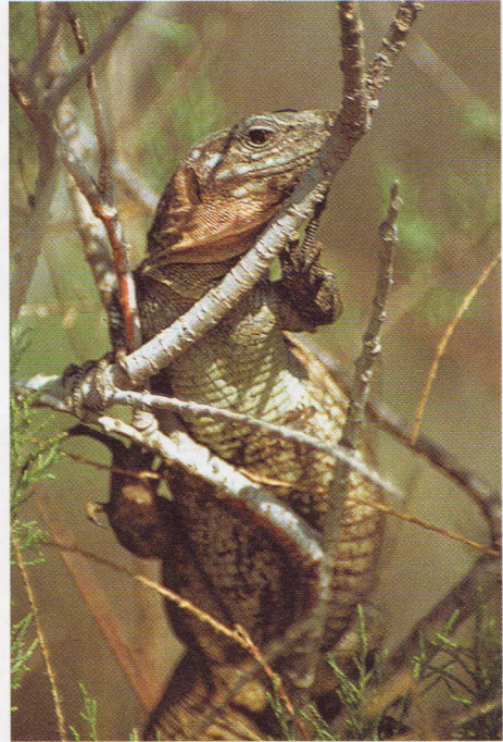
Abb. 6. In der Deckung des Gebüschs fühlte sich das Weibchen vor uns sicher.

Ein 326 ha großes Areal der Dünenlandschaft von Maspalomas ist bereits zum besonderen Naturschutzgebiet erklärt worden. Dennoch ist das ökologische Gleichgewicht der Region gefährdet. Die seltene, dem trockenen Gebiet angepasste Flora und Fauna wurde bereits erheblich dezimiert. Immerhin haben die kanarischen Behörden