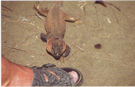
Abb. 4. Am Ende verlor das Männchen jede Scheu, ...