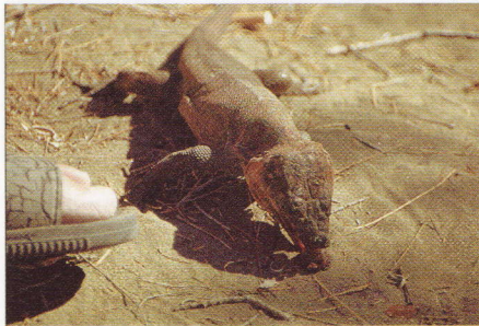
Abb. 5. ... denn die Rosinen schmeckten einfach zu gut.