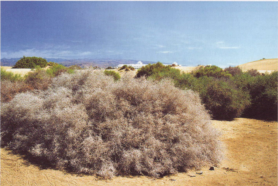
Abb. 2. Gebüsch in den Dünen bei Maspalomas als Lebensraum von Gallotia stehlini .