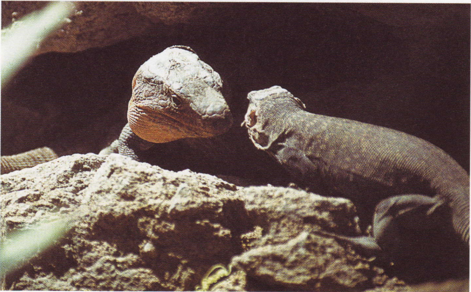
Abb. 11. Gallotia stehlini -Pärchen im Palmitos-Park.