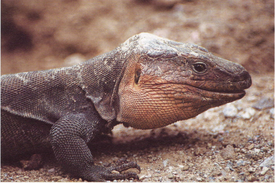
Abb. 12. Portrait des „Chefs“ vom Palmitos-Park.

kann man sich durchaus in vergangene Epochen zurückversetzt fühlen. Knochenfunde auf La Gomera (HELM DAG 2000) belegen, dass in früheren Zeiten Eidechsen von bis zu 1,5 Metern Länge die Inseln bevölkerten. Aber auch die Begegnungen mit diesen Tieren waren immer wieder besondere Erlebnisse.