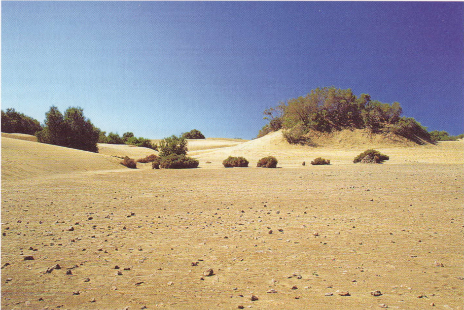
Abb. 1. Dünenlandschaft bei Maspalomas im Süden Gran Canarias.