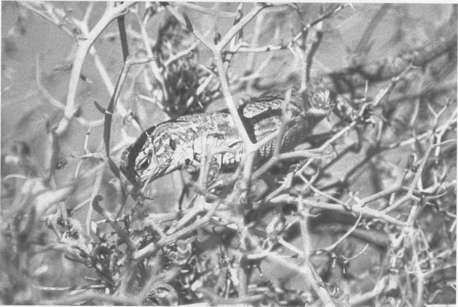
Abb. 7. Jüngerer Weibchen im Gestrüpp.

Ein weiterer Höhepunkt unseres Aufenthaltes auf Gran Canaria war ein Besuch im Palmitos-Park. Dieser wunderschön angelegte Palmen- und Kakteengarten befindet sich am Ende eines canyonähnlichen Tales, nur wenige Kilometer landeinwärts von Maspalomas. In zahlreichen Volieren sind viele Arten exotischer Vögel zu sehen, vorrangig Papageien. Außerdem gibt es ein Schmetterlingshaus, eine Affeninsel und ein großes Aquarienhaus. Dort sind rund 300 Arten von Süß- und Salzwasserfischen zu sehen. Der Park mit seiner üppigen Flora bietet natürlich auch den Rieseneidechsen einen hervorragenden Lebensraum.