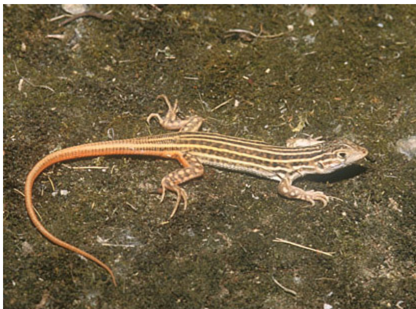
Figura 1. Juvenil de lagartija colirroja.

El dimorfismo sexual está marcado por el mayor tamaño de la cabeza de los machos, generalmente más anchas, el engrosamiento basal de la cola más pronunciado en los machos, especialmente durante el celo, la mayor longitud de las colas en los machos, y la fuerte tonalidad rojiza de la cola de las hembras durante el celo (Blasco, 1975, 1977; Seva, 1982; Barbadillo y Bauwens, 1997).