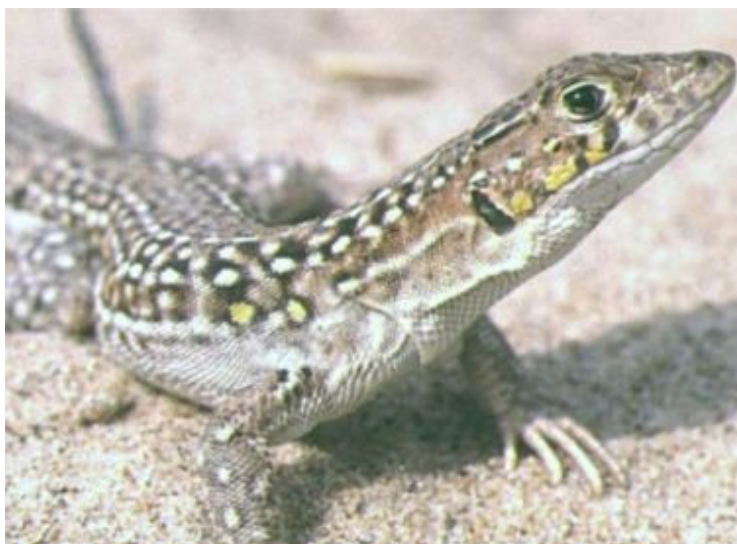
Figura 3. Detalle de los ocelos amarillos del macho en época reproductora.