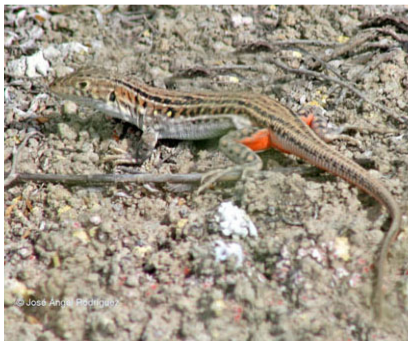
Figura 4. Coloración característica de la hembra en celo.