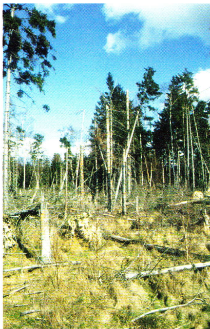
Abb. 8. Windwurf.

Bei den oviparen Populationen in Südwest- und im südlichen Europa kommt es zwischen Juni (Tieflandpopulationen in Frankreich) und Juli (Gebirgspopulationen in den Pyrenäen) zu Ablagen von etwa