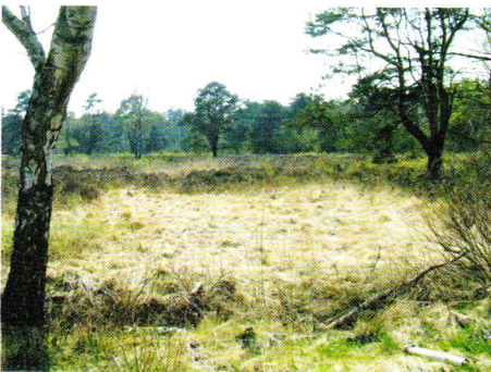
Abb. 7. Moorhabitat.