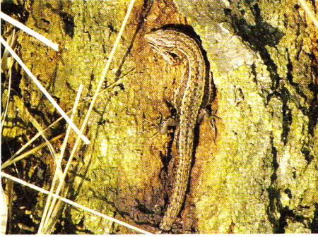
Abb. 2. Männchen.