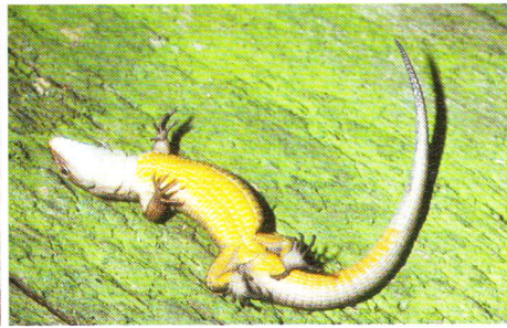
Abb. 5. Bauchseite eines Weibchens.