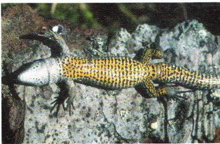
Abb. 4. Bauchseite eines Männchens.

Die Waldeidechse ist eine kleine, eher zierlich wirkende Eidechse mit relativ kurzen Gliedmaßen und kurzem Schwanz, der nur selten die doppelte Kopf-Rumpflänge erreicht. Die maximale Gesamtlänge beträgt 180 mm. Die Kopf-Rumpflänge überschreitet im männlichen Geschlecht selten 65 mm, bei den Weibchen selten 75 mm. Erwachsene Tiere wiegen zwischen 3 – 5 g, trüchtige Weibchen bis 8 g. Der relativ kurze Kopf ist wenig zugespitzt und oberseits leicht abgeflacht. Das Halsband ist stark gezähnt und besteht aus 6 – 12 Schildchen (Collaria). Die Rückenschuppen (Dorsalia)