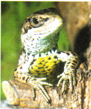
Abb. 1. Portrait einer männlichen Waldeidechse.

On the occasion of the proclamation of the lizard Zootoca vivipara to the „Reptile of the year 2006“ by the Deutsche Gesellschaft für Herpetologie und Terrarienkunde e. V. (DGHT) this species is represented here. Its appearance, habitat, natural history and the current systematical classification of Zootoca vivipara are described. The remarkable distribution and the interesting reproduction biology are particularly emphasized. Finally it is referred to endangerment factors and possibilities for conservation.