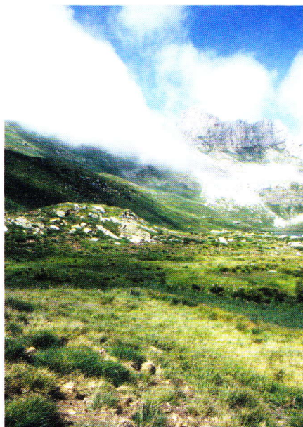
Abb. 9. Alpine Matten als Lebensraum im Hochgebirge.