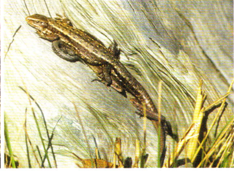
Abb. 3. Weibchen mit einjährigem und diesjährigem Jungtier.

den Symposiums „Die Waldeidechse, Zootoca vivipara – Evolution, Ausbreitungsgeschichte, Ökologie und Schutz der erfolgreichsten Reptilienart der Welt“, sondern sie in der Tat ein Reptil der Superlative ist.