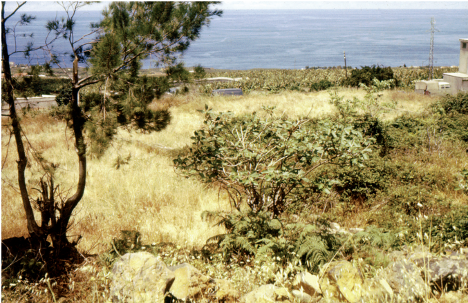
Abb. 9. Lebensraum von G. g. eisentrauti im Orotava-Tal.

Lebensraum und Lebensweise: Der Lebensraum (Abb. 9) von Gallotia galloti eisentrauti wird ausführlich von MOLINA-BORJA & BISCHOFF (1998) vorgestellt. Grundsätzlich besiedeln die Eidechsen nahezu alle Bereiche der feuchteren Nordseite Teneriffas, von der Küste bis zur unteren Grenze der Passatwolkenzone in circa 800 bis 1.000 m Höhe im Gebirge. Weitgehend gemieden werden der eigentliche Küstensaum, die Lorbeer- und sehr dichte Kiefernwälder. Besonders bevorzugt werden vom Menschen geschaffene Strukturen, so etwa die verbreiteten Legsteinmauern und größere Steinhäufen innerhalb möglichst üppiger Vegetation ( Rubus ulmifolius , Kleinia neriifolia , Rubia fruticosa , Euphorbia regis-jubae , E. canariensis und so weiter), aber auch die Bananen- und Tomatenplantagen, Weinfelder und Müllplätze. Überhaupt besiedeln diese Eidechsen sehr schnell neu geschaffene „Lebensräume“, selbst inmitten der Ortschaften.