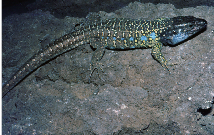
Abb. 11. Männchen von Gallotia galloti eisentrauti im Orotava-Tal.

sagen, deren „Sport“ es ist, Eidechsen in großen Mengen abzuschließen. Hierfür nur ein Beispiel: Im Juli 1989 hatten wir ein Häuschen gemietet, welches auf einem weitgehend naturbelassenen Grundstück oberhalb von Garachico im Norden Teneriffas lag. Meine Frau und ich machten am 12. Juli einen Ausflug, während unsere Tochter lieber das Haus hütete. Als wir nachmittags zurückkamen, hatte KRISTINA einen Haufen toter Eidechsen zusammengetragen (Abb. 10). Am Vormittag hatten sie einige junge Männer auf dem circa 1.000 m 2 großen Grundstück „nur so zum Spaß“ abgeknallt.