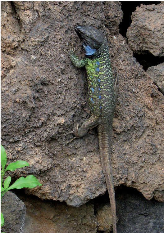
Abb. 1. Männchen von Gallotia galloti eisentrauti bei Puerto de la Cruz.

Vorbe merkung: Die Kanareneidechse bewohnt in vier Unterarten die kanarischen Inseln Teneriffa ( Gallotia galloti galloti [OUDART, 1839] und Gallotia galloti eisentrauti BISCHOFF, 1982) und La Palma ( Gallotia galloti palmae [BOETTGER & MÜLLER, 1914]) sowie den Roque Fuera de Anaga ( Gallotia galloti insulanagae MARTÍN, 1985).