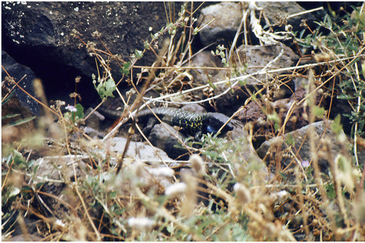
Abb. 3. „Mäßig gelungener“ Schnappschuss des Holotypus von Gallotia galloti eisentrauti bei Bajamar.

det sind. Der Künstler hat die Arten mit den von DUMÉRIL & BIBRON vorgeschlagenen Namen beschriftet. Unter der Nummer 1 ist das oben erwähnte Männchen abgebildet (Abb. 2). DUBOIS (1984) fand nun heraus, dass das Werk von WEBB & BERTHELOT (l. c.) einige Wochen vor jenem von DUMÉRIL & BIBRON (l. c.) erschienen war. Auch wenn dies sicher nicht in der Absicht des Künstlers lag, hat er wohl, den internationalen Regeln für zoologische Nomenklatur entsprechend, für den Namen Lacerta galloti die Priorität vor DUMÉRIL & BIBRON.