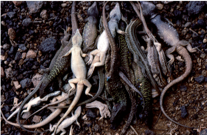
Abb. 10. Die „sportliche“ Ausbeute jugendlicher kanarischer „Naturliebhaber“ an einem Vormittag.

Schlussbemerkungen: Gallotia galloti steht nach der FFH-Richtlinie EG 2006/105 im Anhang IV und ist somit nach dem Bundesnaturschutzgesetz als streng beziehungsweise besonders geschützte Art eingestuft. Damit sind Wildfänge heute kaum erhältlich; Nachzuchten dürfen jedoch gehandelt werden.