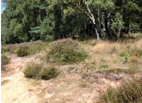
Detail droge heide met veel bochtige smele