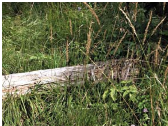
Detail vochtig habitat levendbarende hagedis