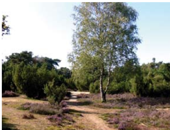
Droge heide met jeneverbesstruweel

moesten worden. In vrijwel alle gevallen bleek het samenvatten van uren de gegevens juist onbetrouwbarder te maken, te zien aan een forse toename van de standaardafwijking.