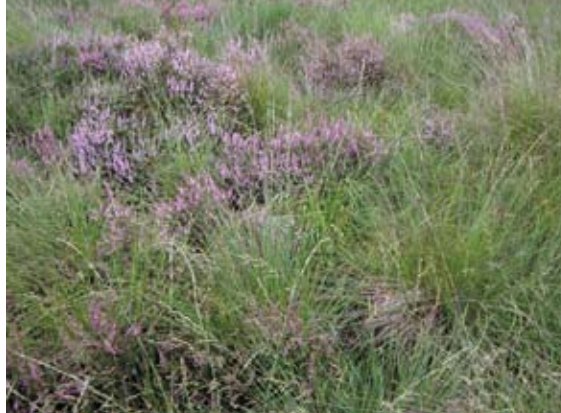
Detail vochtige heide