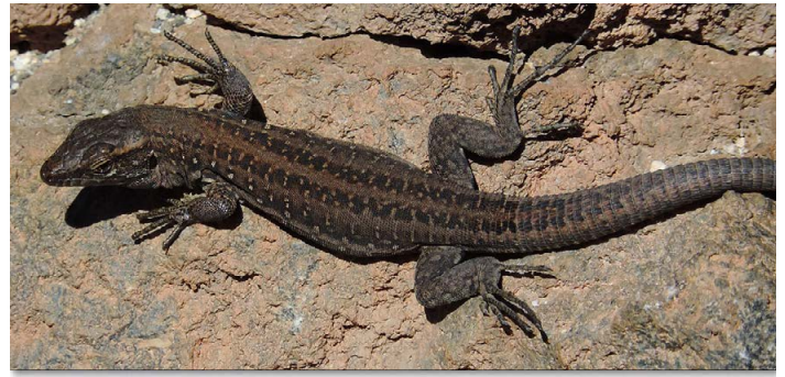
Gallotia g. galloti ♀ (3.545 m ü. NN)

Wir besuchten die Cañadas mehrere Male, wobei unser Interesse auch der hochalpinen Region am Gipfel des Teide galt. Zum Glück gibt es die Möglichkeit, mit der Seilbahn das Gebiet am Gipfel zu erreichen. Von der auf 2.356 m gelegenen Talstation geht es in nur wenigen Minuten hinauf zu der auf 3.555 m hoch gelegenen Bergstation. Von hier aus kann man die restlichen ca. 150 m bis zum Gipfel steigen oder einem der beiden Wanderwege um den Gipfel herum folgen. In Hinblick auf eventuelle Sichtungen von Eidechsen ( Gallotia g. galloti ) erschien uns die zweite Option jedoch aussichtsreicher, und so entschieden wir uns für den Weg links um die Bergspitze herum. Vorbei an einigen, noch meterhohen Eisplatten führte uns dieser Weg in eine karge und steinige Gebirgslandschaft. Der zunehmend stärker gewordene Wind ließ die gemessenen 15 °C deutlich kühler erscheinen, und wir rechneten nicht mehr damit, hier Eidechsen finden zu können. Während einer kurzen Rast entdeckten wir