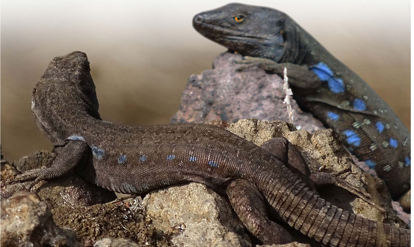
Gallotia galloti , ♂ bei Igueste de San Andrés