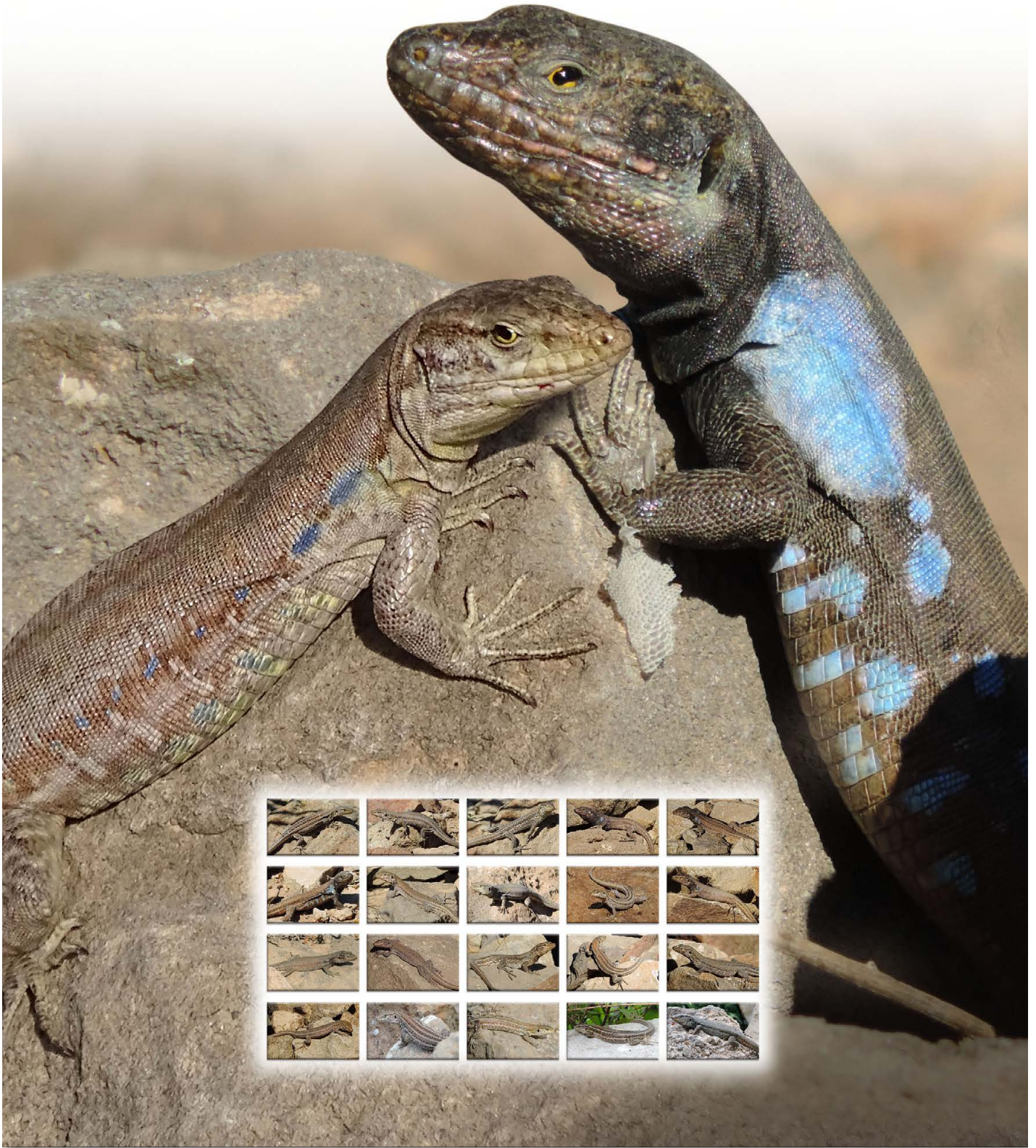
Westkanaren-Eidechse ( Gallotia g. galloti ), links ♀ rechts ♂

Tiere waren fast in allen Lebensräumen anzutreffen und selbst noch an der Strandpromenade von Los Cristianos zu finden.