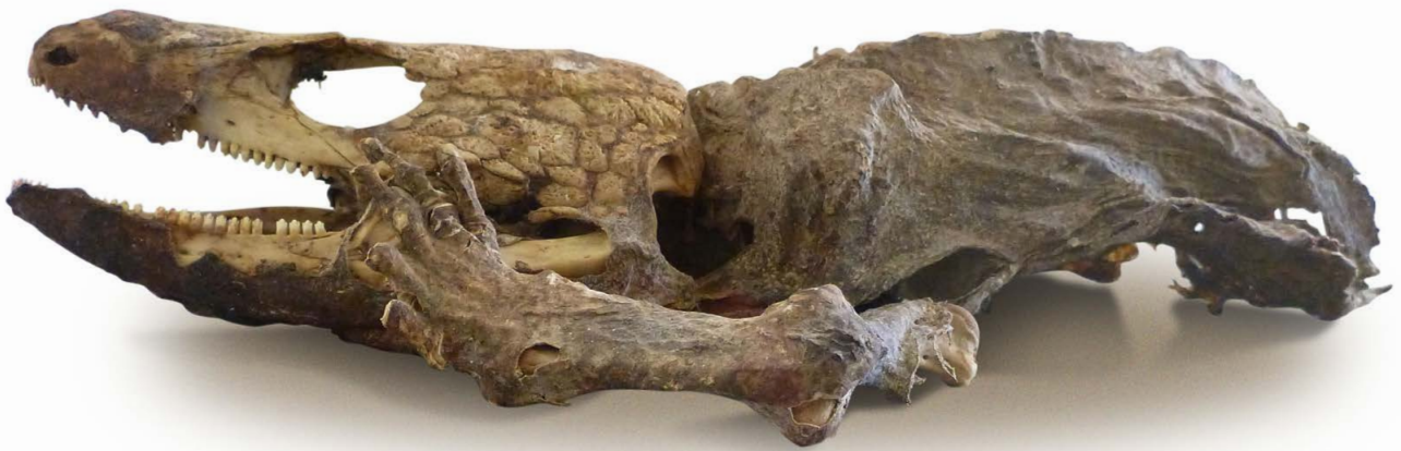
Mumifizierte Gallotia goliath (Museo de la Naturaleza y del Hombre) Fundort: Teneriffa, Barranco de las Moraditas