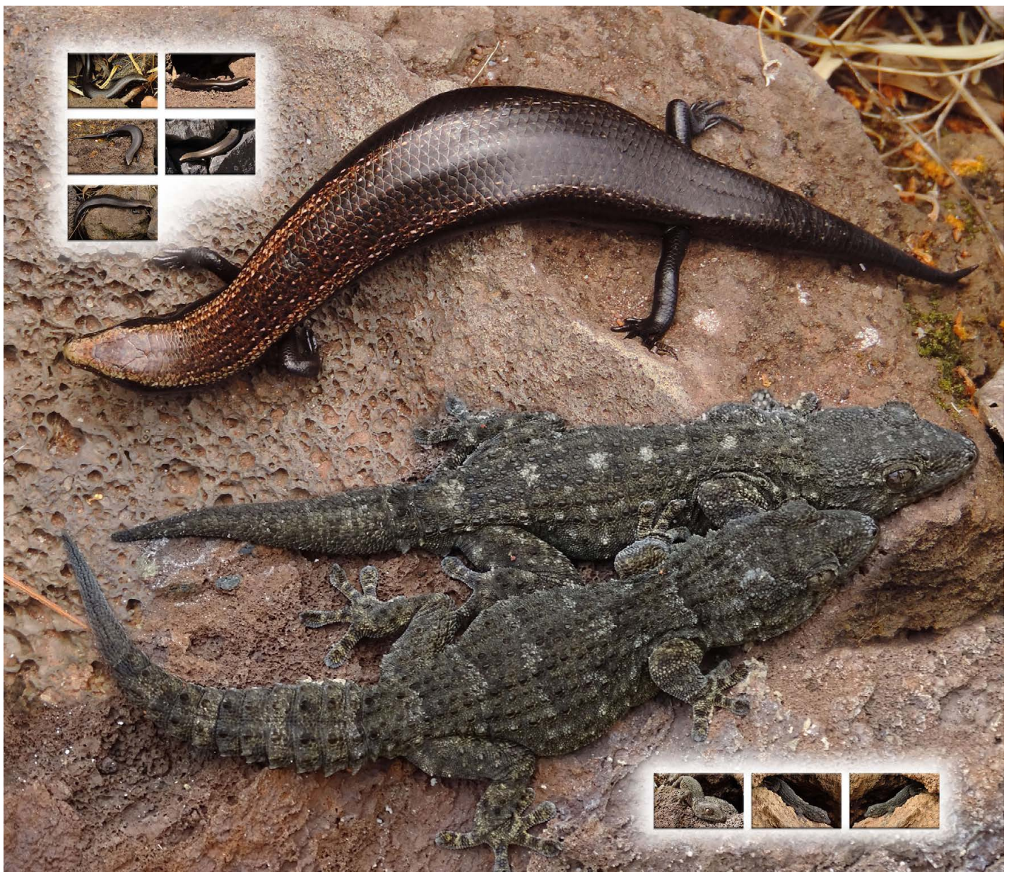
Kanarenskink ( Chalcides viridanus ) und Kanarengeckos ( Tarentola delalandii )