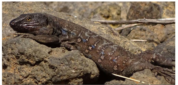
Gallotia galloti , ♂ bei Igueste de San Andrés