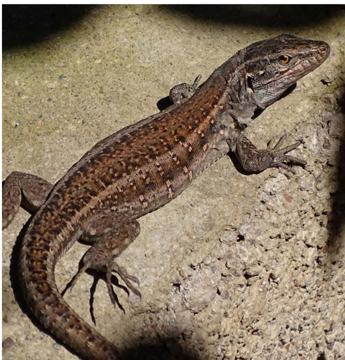
Gallotia galloti , ♀ bei Igueste de San Andrés