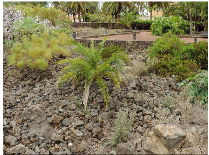
Lebensraum von Eidechsen, Skinken und Geckos im Taoro-Park

Relativ häufig konnten wir im Lebensraum der Eidechsen auch den Kanarenskink ( Chalcides viridanus ) und den Kanarengecko ( Tarentola delalandii ) antreffen. Im Gegensatz zu den Eidechsen führen diese Tiere jedoch ein eher verstecktes Dasein. Man muss schon etwas genauer hinsehen, um die zierlichen Skinke (Gesamtlänge ca. 12 bis 15 cm) und die gut getarnten Geckos zu entdecken. Wir observierten an verschiedenen Tagen die Legesteinmauern im Taoro-Park und konnten dabei einen Zusammenhang von Wetterlage und Sichtungshäufigkeit feststellen. Während die Kanarengeckos fast immer zu finden waren, hatte es den Anschein, dass die Skinke trüberes Wetter mit höherer Luftfeuchtigkeit bevorzugen würden. Zumindest fanden wir an so einem Tag überraschend viele dieser Tiere.