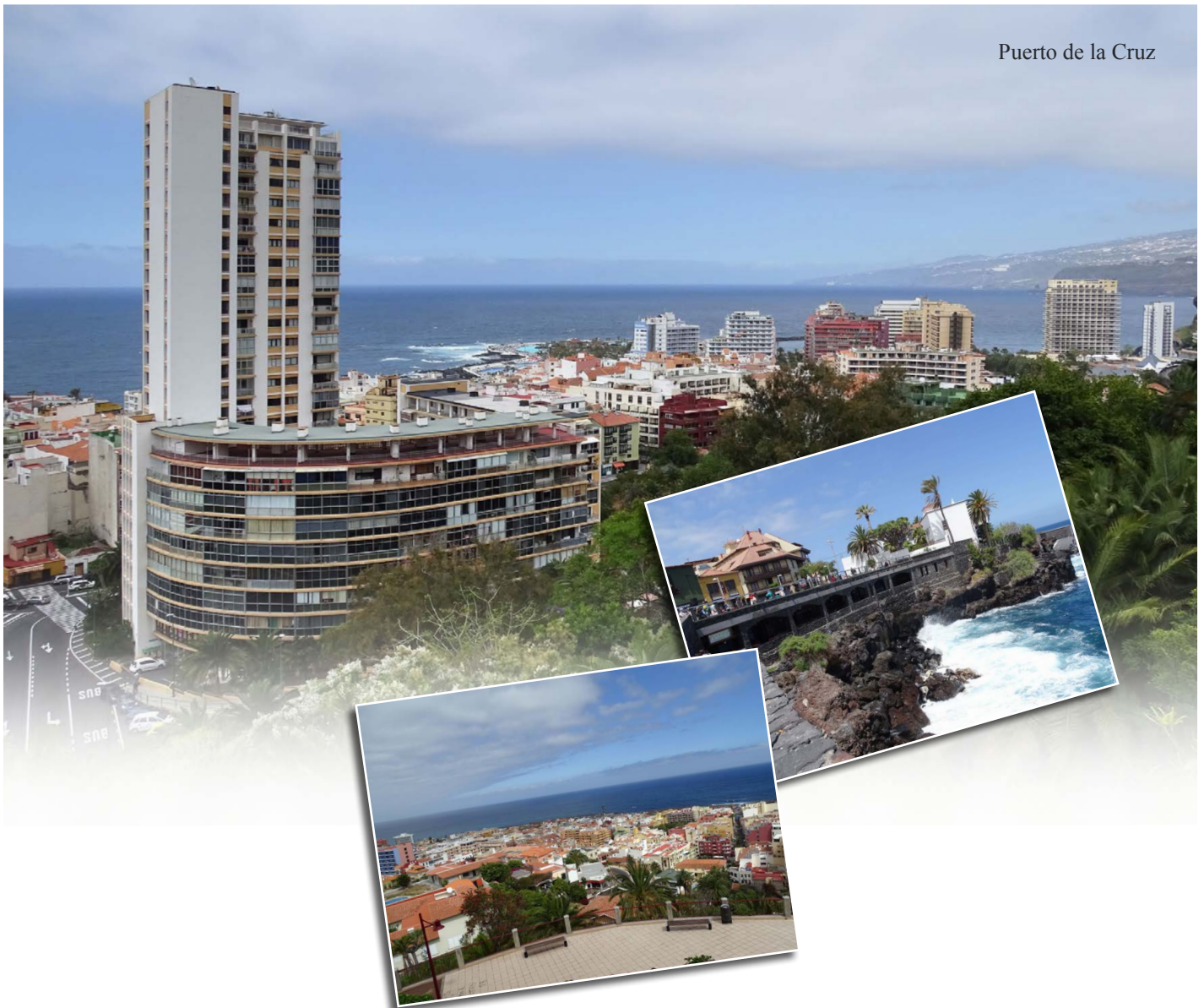
Puerto de la Cruz

Unsere ersten Fotoexkursionen unternahmen wir im April in der Nähe unserer Unterkunft in Puerto de la Cruz. Hier, am Fuße des Orotavatal, kommt Gallotia g. eisentrauti in verschiedenen Ausprägungen von