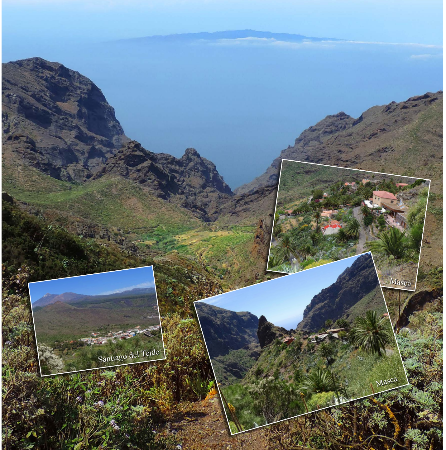
Blick in die Masca-Schlucht. Im Hintergrund ragt die Insel La Gomera aus einer Wolkendecke.

Diese Gegend war für uns aber auch deshalb sehr interessant, da hier eine Kontaktzone von Gallotia g. galloti und Gallotia g. eisentrauti verläuft. So fanden wir Tiere, die Merkmale der Unterart Gallotia g. eisentrauti zeigten und auch solche, die wie Gallotia g. galloti in Erscheinung traten. Auf der folgenden Seite geben wir einen Einblick in die Variationsbreite von Gallotia galloti in dieser Region.