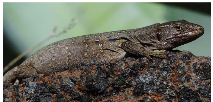
Gallotia galloti , ♀ bei Igueste de San Andrés