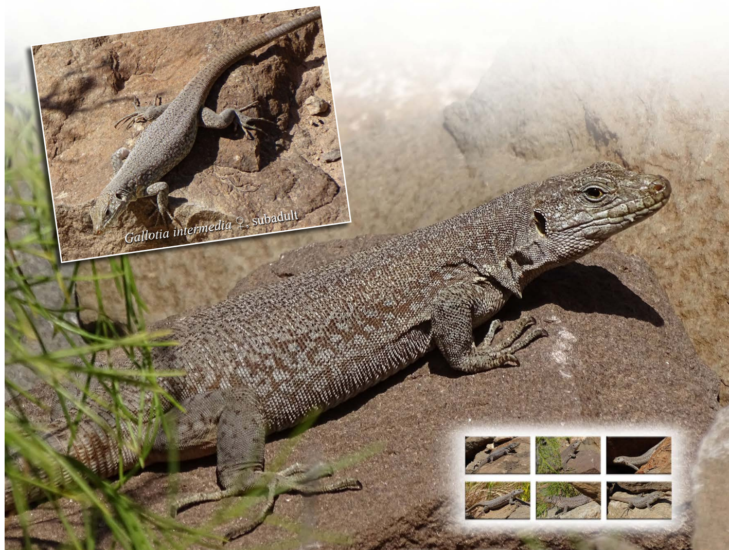
Gesprenkelte Kanareneidechse ( Gallotia intermedia ), ♀

die ersten Eidechsen zu sehen waren. Zunächst waren es allerdings nur einige Gallotia g. galloti . Etwas später zeigte sich dann eine subadulte, weibliche Gallotia intermedia . Wir verhielten uns sehr ruhig und beobachteten das Tier, das uns ebenfalls entdeckt hatte und nicht mehr aus den Augen ließ. Nach einer Weile kam diese Eidechse sehr nahe an mich heran. Aus dem Augenwinkel sah ich noch eine zweite Gallotia intermedia , die sich langsam in meine Richtung bewegte. Ich schwenkte vorsichtig die Kamera herum, und es gelangen auch von diesem Tier, einem sehr großen adulten Weibchen, Aufnahmen aus nächster Nähe. Meine Frau befand sich etwas abseits in ungünstiger Sichtposition. Nach einer knappen Stunde und steigenden Temperaturen zogen sich die Eidechsen in schattige und schlecht einsehbare Bereiche zurück. Wir warteten noch eine Weile und traten dann auch den Rückzug an.