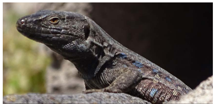
Gallotia galloti , ♂ bei Igueste de San Andrés