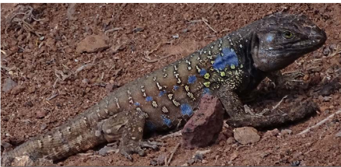
Gallotia galloti , ♂ bei Igueste de San Andrés