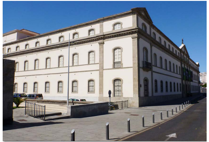
Museo de la Naturaleza y del Hombre

Zum Thema Rieseneidechsen möchten wir noch erwähnen, dass in prähistorischen Zeiten eine weitere Art ( Gallotia goliath MERTENS, 1942) auf Teneriffa, La Gomera, El Hierro und La Palma gelebt hat, die die Bezeichnung Rieseneidechse auch tatsächlich verdient. Subfossile Funde lassen auf eine Gesamtlänge bis etwa 1,5 m schließen. Nach dem Fund von mumifizierten Überresten eines Exemplars konnte diese Art postum noch genetisch untersucht werden, und es stellte sich eine enge Verwandtschaft zu Gallotia intermedia , Gallotia simonyi und Gallotia bravoana heraus (MACA-MEYER et al., 2003). Diese Überreste und weitere Knochenfunde sind im Naturkundemuseum von Santa Cruz (Museo de la Naturaleza y del Hombre) ausgestellt.