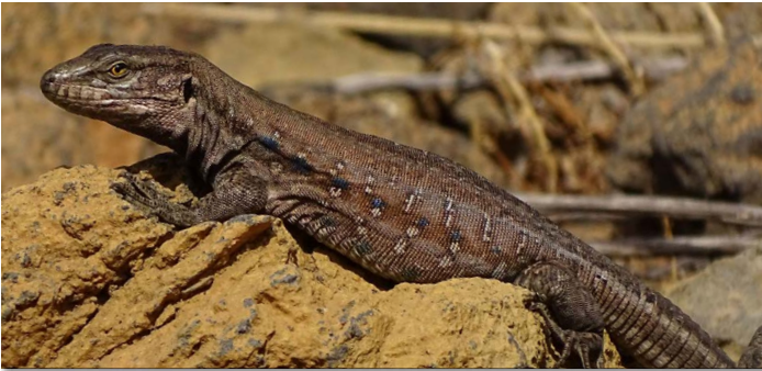
Gallotia galloti , ♀ bei Igueste de San Andrés

Ähnlichkeit mit der Nominatform aufweisen, aber auch solche, die Merkmale von Gallotia g. eisentrauti zeigten. Aus unserer Sicht ist es deshalb sehr wahrscheinlich, dass es sich in dieser Region um eine Mischform handelt.