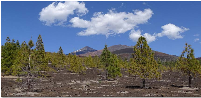
Standort: 28° 16' 0.342" N 16° 43' 33.168" W