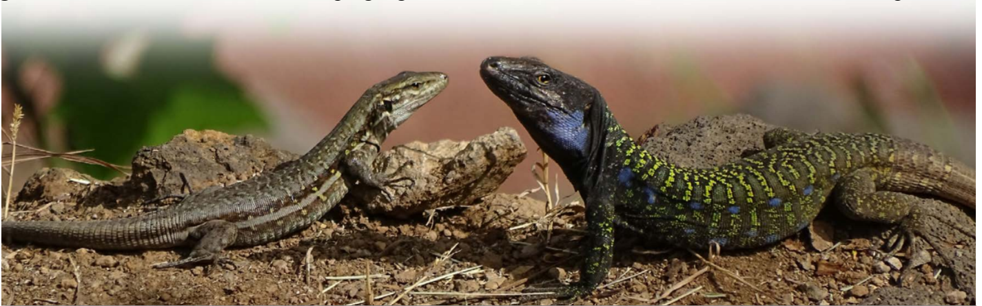
Gallotia g. eisentrauti , Paar, Puerto de la Cruz (Taoro-Park)

Zeichnung und Färbung vor. Besonders auffällig tritt dies bei den männlichen Tieren in Erscheinung. Die nachfolgenden Bilder dokumentieren die große Variabilität dieser Unterart innerhalb einer Population.