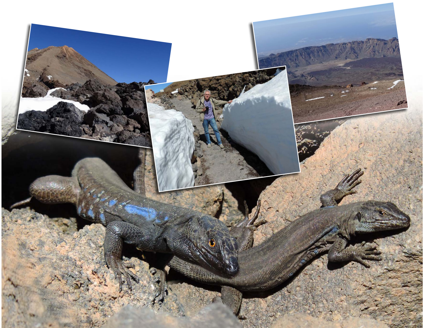
Gallotia g. galloti Paar, (3.540 m ü. NN)

dann aber doch noch einige Exemplare, die sich im Windschatten der Steine sonnten. Uns fiel auf, dass die Eidechsen deutlich kleiner waren als jene, die wir zuvor bei der Talstation gesehen hatten. Sicher ist dies dem kühleren Klima und dem geringeren Nahrungsangebot geschuldet. Nach etwa einer Stunde fuhren wir mit unvergesslichen Eindrücken und vielen Bildern wieder ins Tal hinab.