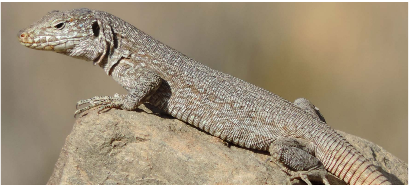
Gesprenkelte Kanareneidechse ( Gallotia intermedia ), ♀