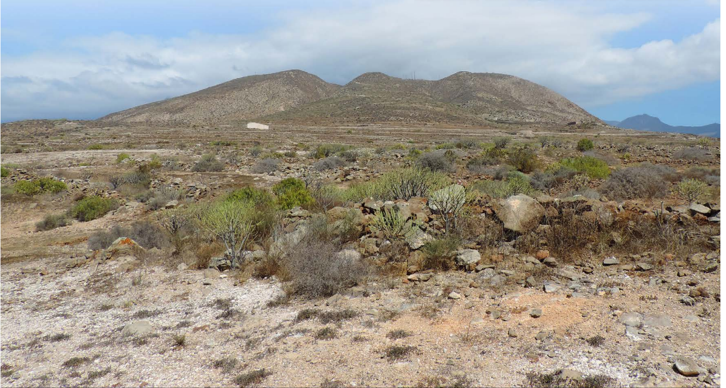
Naturschutzgebiet Montaña de Guaza