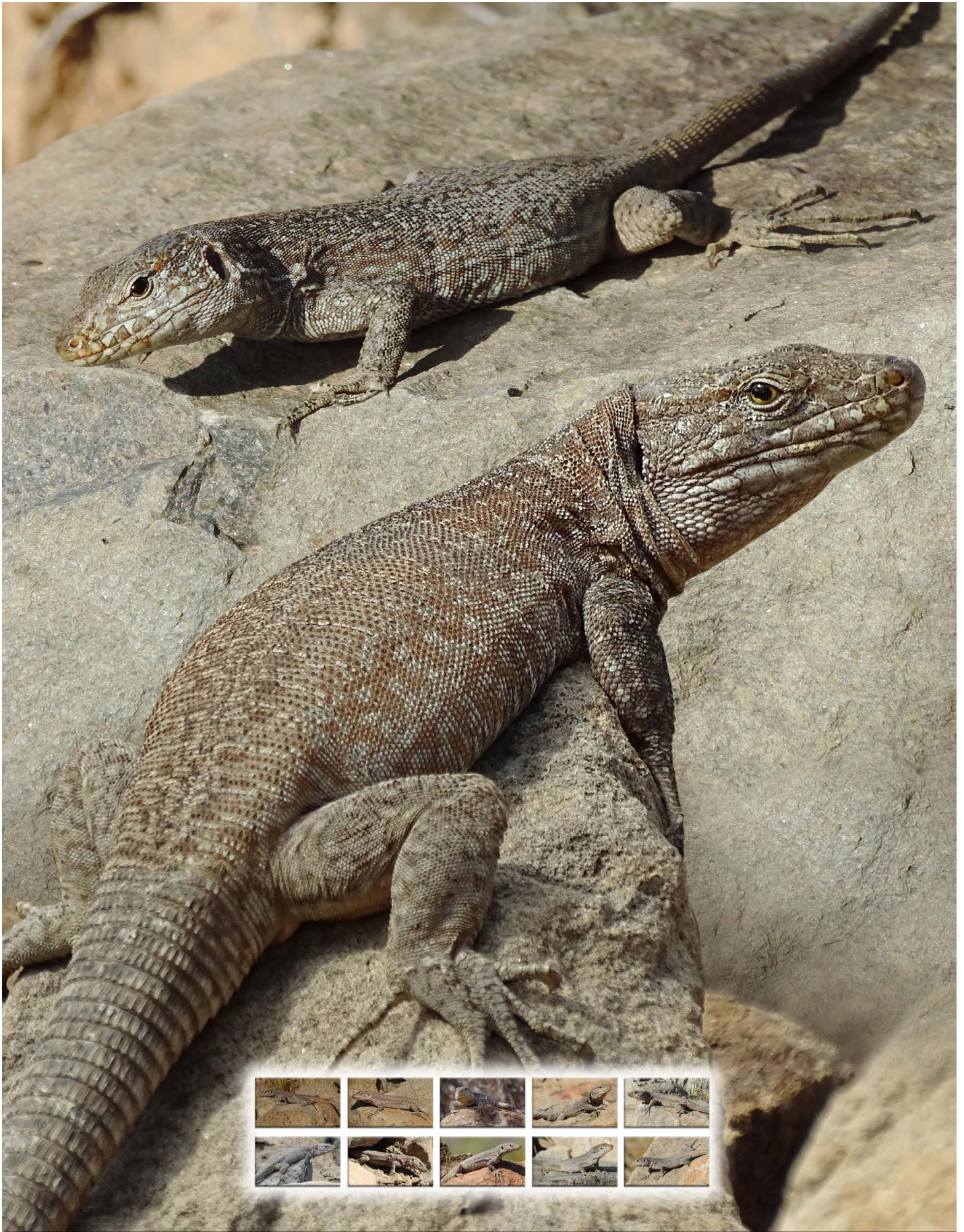
Gesprenkelte Kanareneidechse ( Gallotia intermedia ), oben ♀ unten ♂