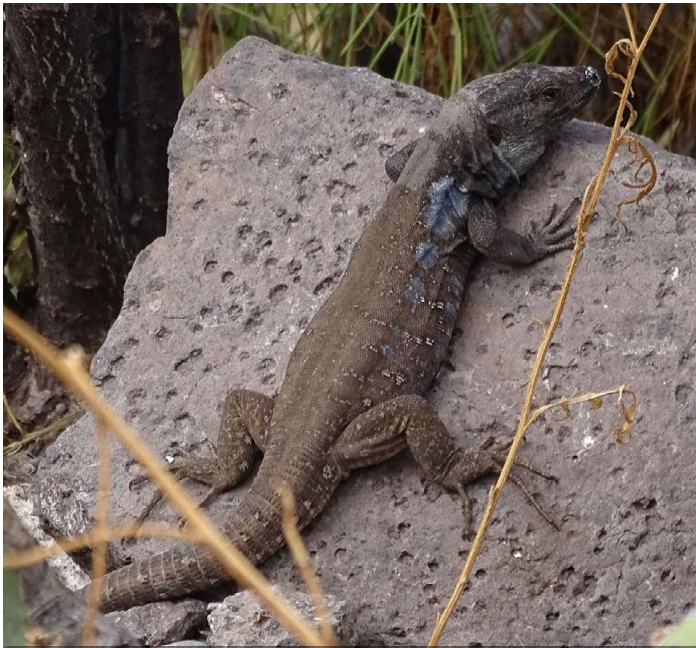
Gallotia galloti , ♂ bei San Andrés

kurz besucht hatten, fuhren wir weiter bis zu der kleinen Ortschaft Igueste de San Andrés. Uns war aufgefallen, dass die Eidechsen in dieser Gegend nicht so bunt waren wie jene, die wir zuvor bei Benijo gefunden hatten, und mehrheitlich eher an Vertreter der Nominatform ( Gallotia g. galloti ) erinnerten. Leider reichte die Zeit nicht mehr aus, um noch mehr dieser Tiere zu fotografieren, und so beschlossen wir, diese Gegend bei unserer nächsten Reise etwas genauer unter die Lupe zu nehmen.