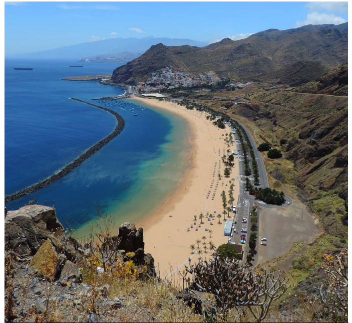
Künstlich angelegter Sandstrand bei San Andrés