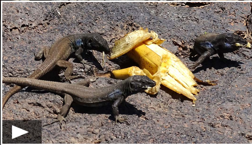
Bananen stehen normalerweise nicht auf dem Speisplan - dementsprechend gierig stürzten sich die Eidechsen auf diese Köstlichkeit.