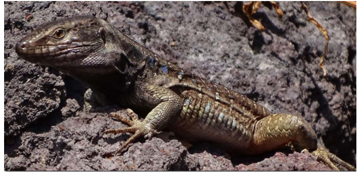
Gallotia galloti , ♂ bei Igueste de San Andrés