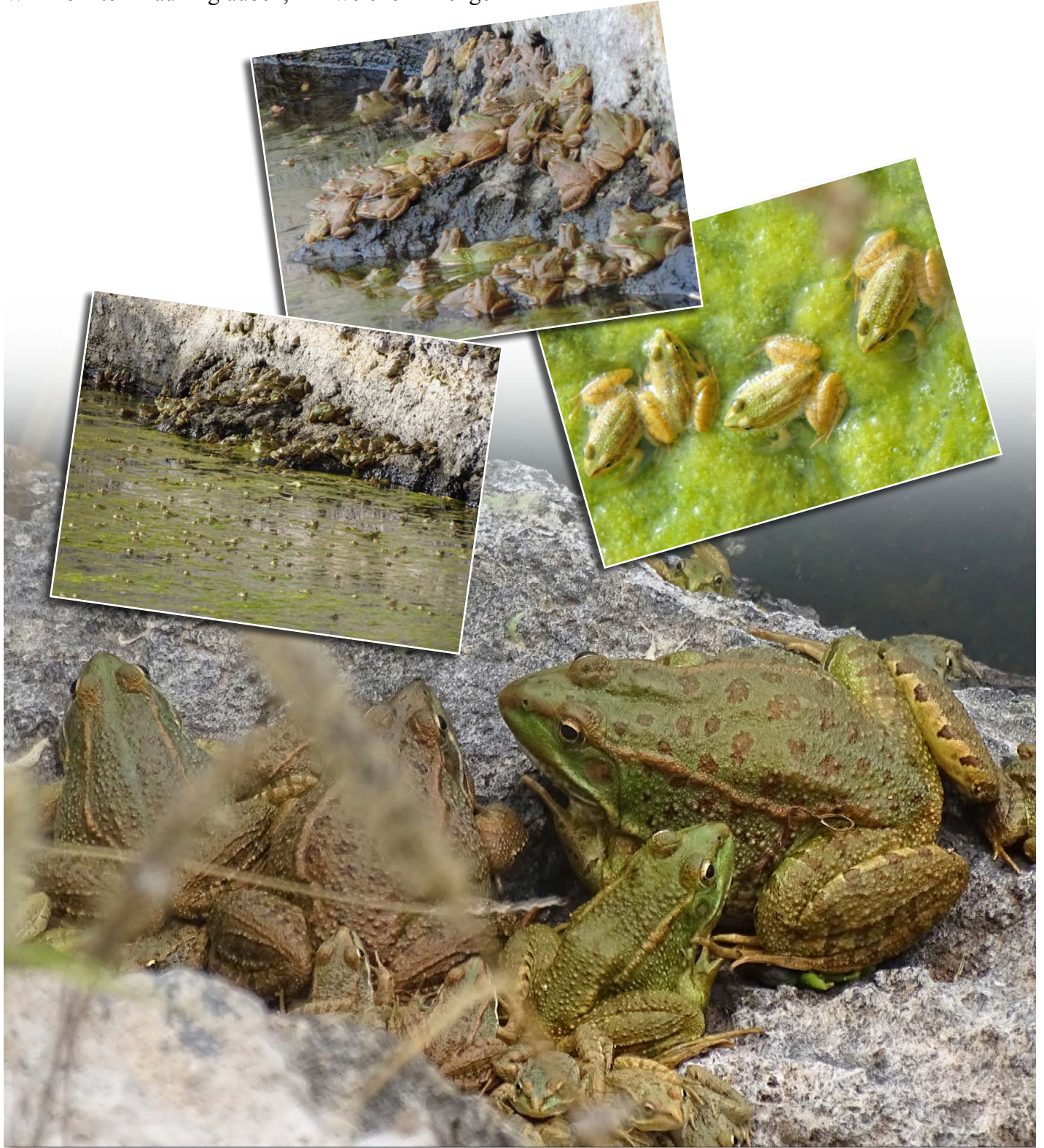
Iberischer Wasserfrosch ( Pelophylax perezi ) in einem Wassersammelbecken bei Adeje

diese Tiere das Becken bevölkerten. Nach unserer Einschätzung waren es einige Tausend. Diese Art wurde vor Jahren auf Teneriffa eingeschleppt, und in geeigneten Lebensräumen kann es mangels natürlicher Feinde dann zu diesen extremen Populationsgrößen kommen.