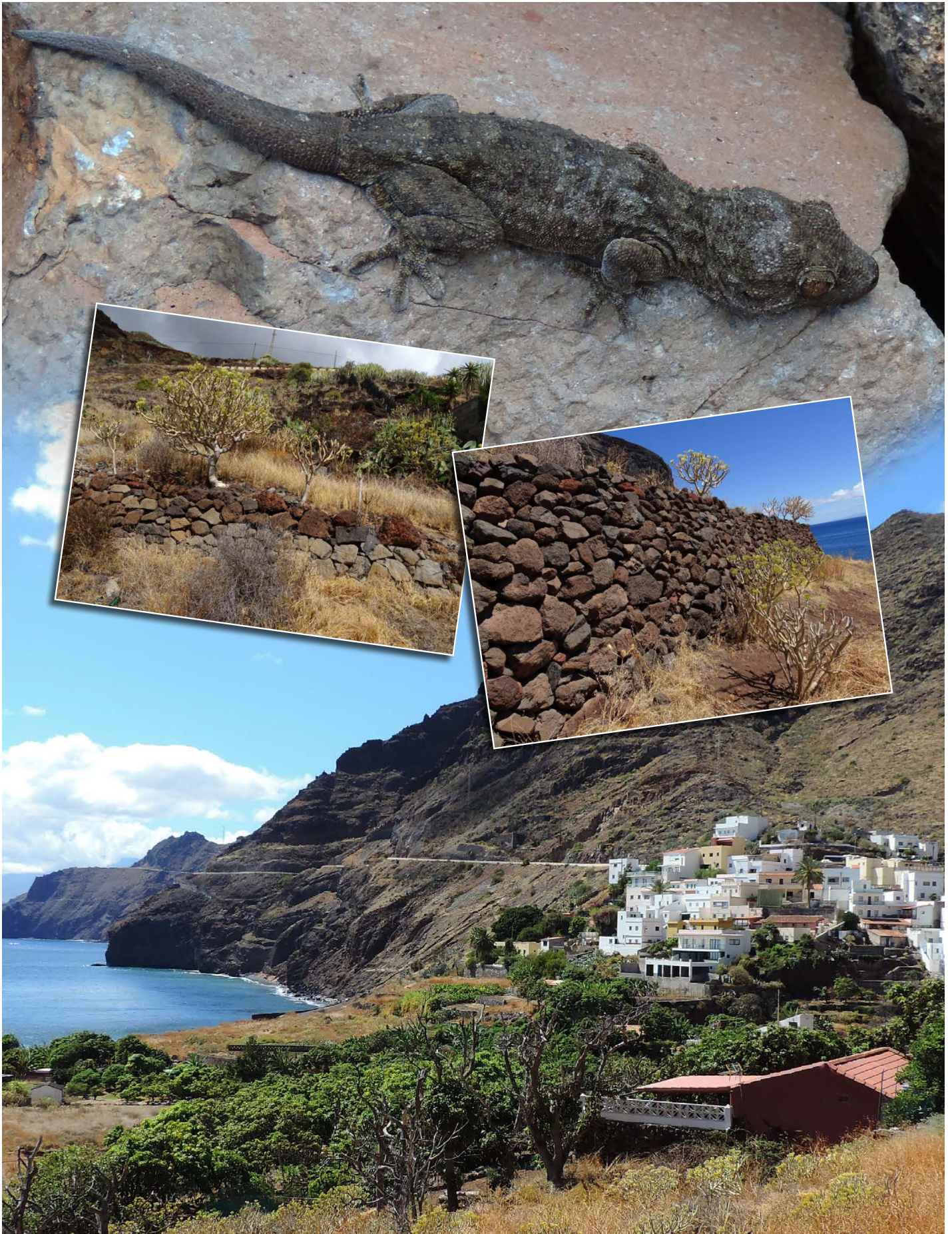
Iguete de San Andrés mit Lebensraum von Gallotia galloti , Chalcides viridanus und Tarentola delalandii