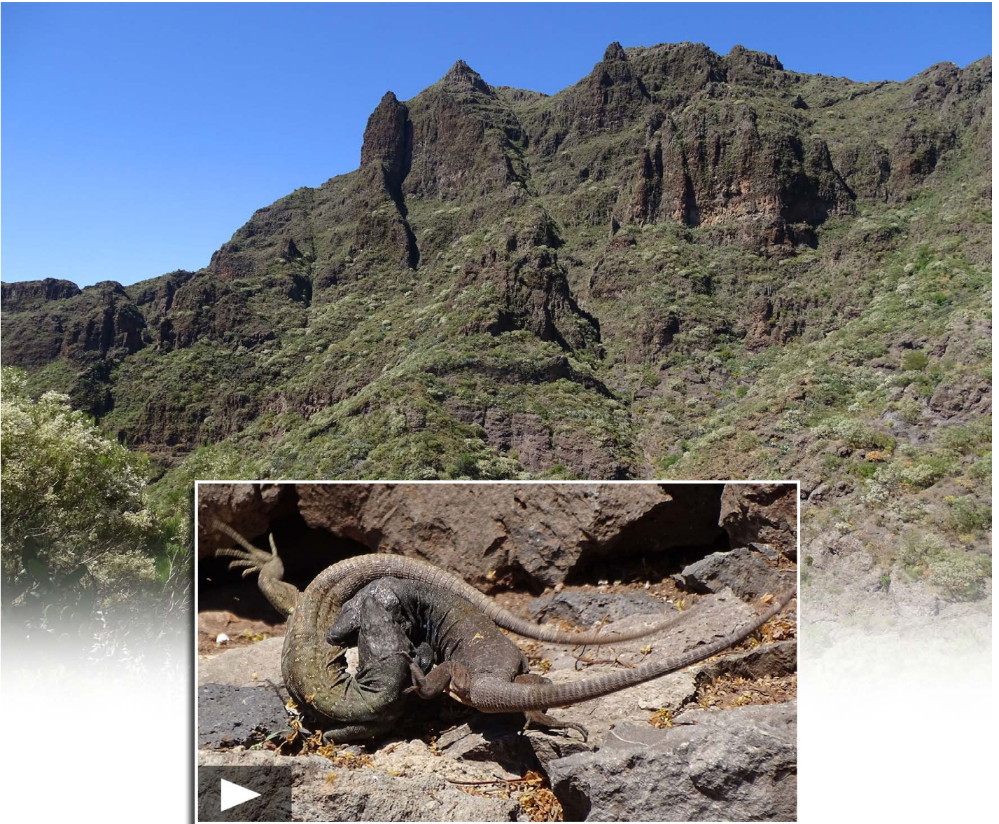
Bei diesem kurzen, aber heftigen Kampf zweier Gallotia galloti konnte sich der Revierinhaber gegen den Eindringling durchsetzen. Die anwesenden Weibchen beobachteten die Szene teilnahmslos.