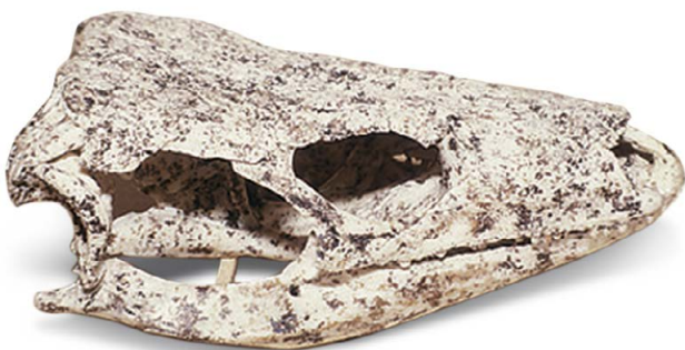
Gallotia goliath , Schädel Fundort: Teneriffa, bei San Andrés