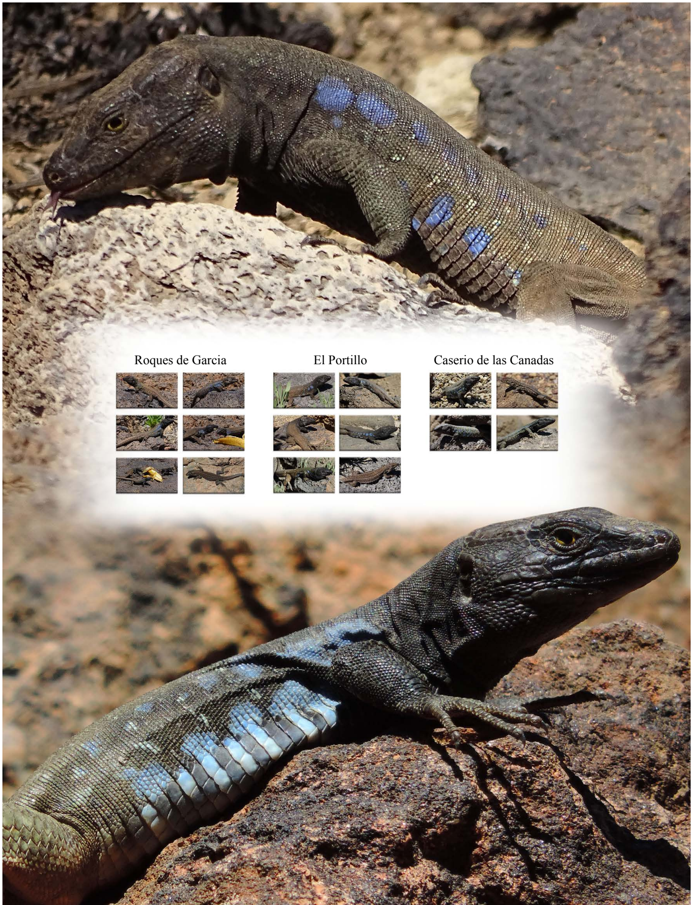
Roques de Garcia