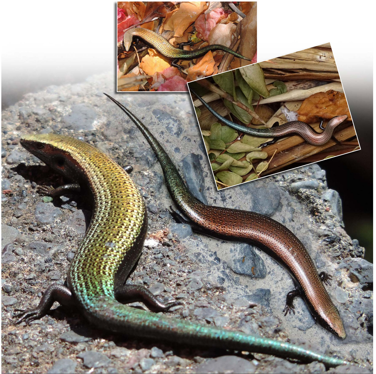
Chalcides viridanus bei Iguete de San Andrés

Echsen im Süden Teneriffas über bläuliche Schwänze verfügen. Geht man also davon aus, dass sich Gallotia g. galloti bis hier hin verbreiten konnte, dann müssten eventuell auch hier Vertreter der blauschwänzigen „Südform“ von Chalcides viridanus zu finden sein. Bei der Suche nach diesen Skinken kam uns der Zufall in Form eines kurzen Regenschauers zu Hilfe. Nachdem die Sonne wieder zum Vorschein kam, fanden wir sehr viele dieser sonst eher versteckt lebenden Tiere, und alle diese Skinke hatten bläuliche bzw. grünliche Schwänze.