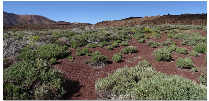
Standort: 28° 13' 29.148" N 16° 37' 37.62" W

Da die Cañadas fast durchgängig auf über 2.000 m Höhe oberhalb der Wolkengrenze liegen, herrscht hier fast immer sonniges Wetter mit strahlend blauem Himmel. Bizarre Felsformationen und erstarrte Magmaflüsse, durchzogen mit inselartiger Vegetation, prägen das Bild dieser Landschaft. Von April bis Juni erreichen die meisten der Pflanzen ihre volle Blütenpracht und erschaffen ein einzigartiges Farbszenario. Vor dieser Kulisse bereitete uns das Fotografieren der Eidechsen, die in den Cañadas mit der Nominatform ( Gallotia g. galloti )