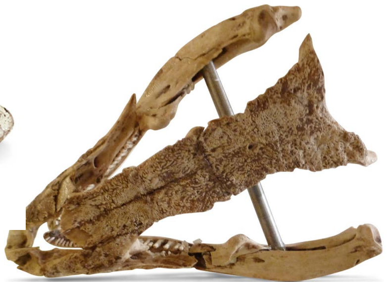
Gallotia goliath , (Museo de la Naturaleza y del Hombre) Fundort: Teneriffa, Barranco Hondo