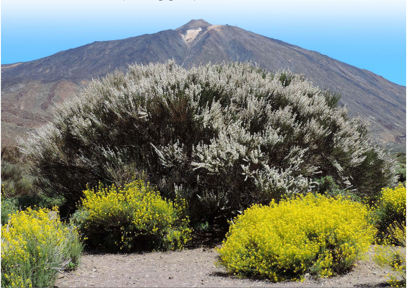
Teide-Rauke ( Descurainia bourgeauana ) und weiß blühender Teide-Ginster ( Cytisus supranubius )

vertreten sind, besonderes Vergnügen, zumal sie an den vegetationsreichen Stellen auch sehr häufig anzutreffen waren. Uns war aufgefallen, dass einige der Tiere in der Nähe von El Portillio in Färbung und Zeichnung an die Unterart G. g. eisentrauti erinnerten (siehe S. 118 oben). Ob es hier tatsächlich zu einer Hybridisierung mit der farbenprächtigere Unterart gekommen ist, oder ob diese Farbeinschläge noch im Bereich der Variationsbreite von Gallotia g. galloti liegen, müsste noch genauer untersucht werden.