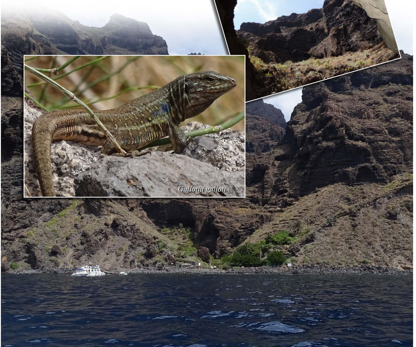
Blick in die Masca-Schlucht

Der Lebensraum dieser Eidechsen befindet sich überwiegend in unzugänglichen Lagen entlang der Südwestküste zwischen Los Gigantes und Punta de Teno. Laut HERNÁNDEZ et al. (1997) besiedelt Gallotia intermedia dieses Gebiet nicht durchgängig, sondern ist auf mehrere, voneinander isolierte Refugien verteilt. Durch die Isolation der Lebensräume sollen sich bereits unterschiedliche Zeichnungs- und Farbmorphen entwickelt haben. Unsere geplante Suche nach diesen Tieren mussten wir leider abbrechen, da der Wanderweg, der oberhalb von Los Gigantes beginnt, wegen eines Hangabrutsches gesperrt war. Alternativ fuhren wir dann mit dem Boot zur Masca-Schlucht. Die atemberaubende Landschaft und die sehr häufig anzutreffenden Gallotia galloti entschädigten uns jedoch für das gescheiterte Vorhaben.