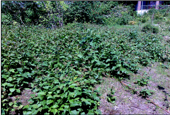
Foto 15: Kalkhügel mit aufkommendem Flieder nach Gehölzschnitt (Blickrichtung N; 25.05.2010)