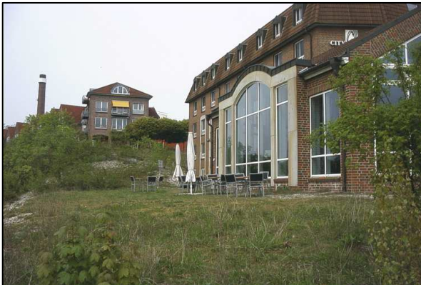
Foto 1: Planfläche (Vordergrund) und Kalkhügel (Hintergrund) (Blickrichtung N; 28.04.2010)