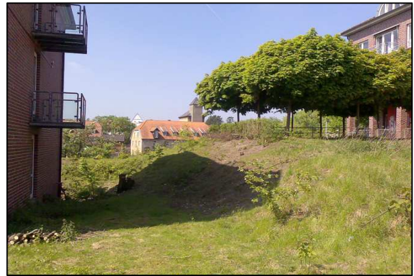
Foto 8: Ruderalflur nördlich Hotel mit Schattenwurf (Blickrichtung W; 21.05.2010, 11.53 Uhr MESZ)