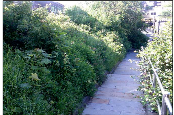
Foto 16: Böschung am Treppenaufgang westlich Hotel mit Schattenwurf (Blickrichtung S; 05.06.2010, 9.25 Uhr MESZ)