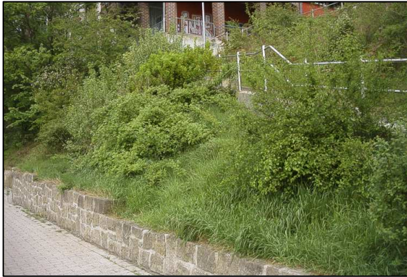
Foto 19: Böschung am Treppenaufgang westlich Hotel (Blickrichtung NNO; 28.04.2010)