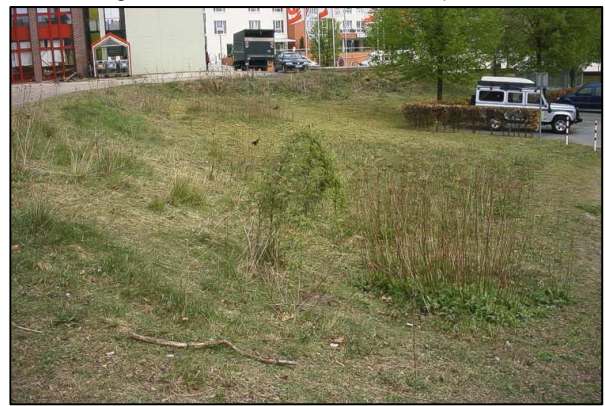
Foto 10: Ruderalflur östlich Hotel (Blickrichtung SO; 28.04.2010)