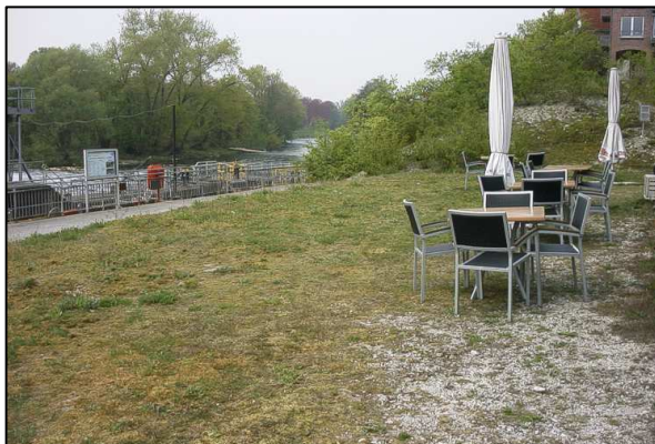
Foto 3: Planfläche (Blickrichtung NNW; 28.04.2010)