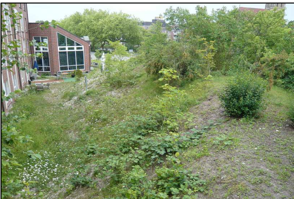
Foto 13: Kalkhügel (Blickrichtung S; 03.06.2009;)