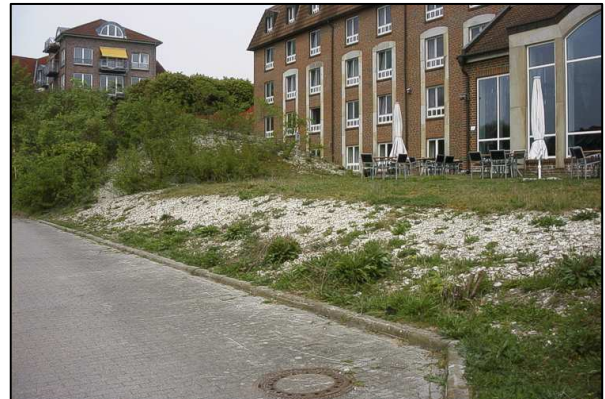
Foto 2: Planfläche (Vordergrund) und Kalkhügel (Hintergrund) (Blickrichtung NNO; 28.04.2010)