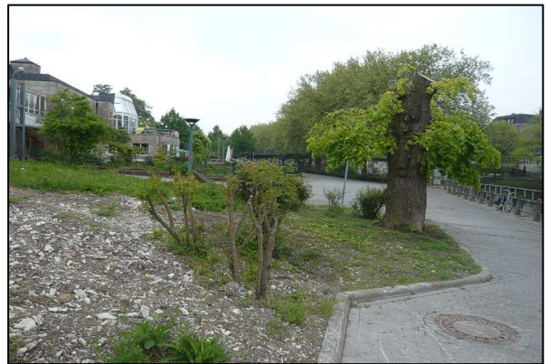
Foto 12: Kalkmagerrasen südlich Hotel nach Gehölzschnitt (Blickrichtung SSO; 30.04.2009;)