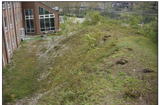
Foto 14: Kalkhügel nach Gehölzschnitt (Blickrichtung S; 28.04.2010)