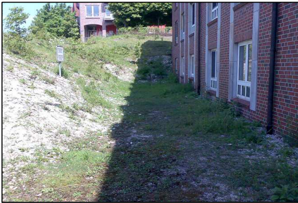
Foto 7: Kalkhügel mit Schattenwurf vom Hotel (Blickrichtung NNW; 21.05.2010, 11.50 Uhr MESZ)