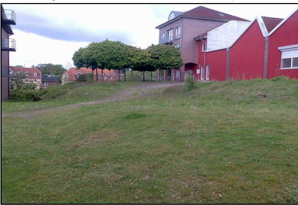
Foto 9: Ruderalflur nordöstlich Hotel (Blickrichtung WNW; 18.05.2010)