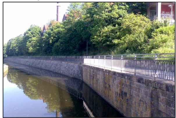
Foto 22: Uferpromenade nördlich Hotel mit Schattenwurf (Blickrichtung N; 05.06.2010, 10.05 Uhr MESZ)