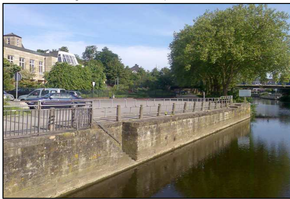
Foto 21: Uferpromenade südlich Hotel (Blickrichtung SO; 05.06.2010)