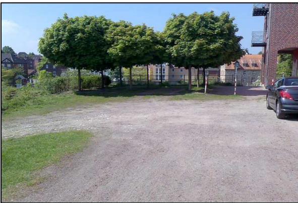
Foto 11: Stellplätze und Verkehrsflächen nördlich Hotel (Blickrichtung WSW; 21.05.2010)