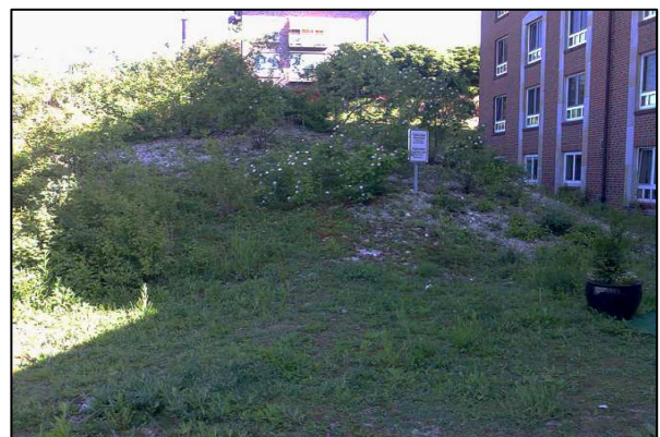
Foto 6: Kalkhügel mit Schattenwurf vom Hotel (Blickrichtung N; 05.06.2010, 9.32 Uhr MESZ)