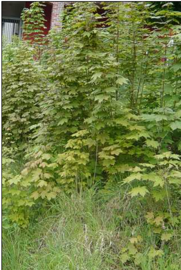
Foto 17: Böschung am Treppenaufgang nordwestlich Hotel (Blickrichtung N; 30.04.2009;)