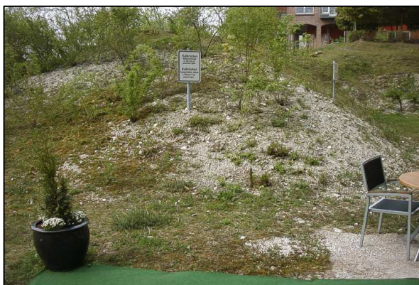
Foto 5: Kalkhügel (Blickrichtung NNW; 28.04.2010)