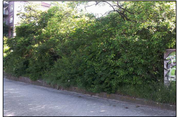
Foto 20: Böschung westlich Hotel mit Schattenwurf (Blickrichtung NNO; 05.06.2010, 9.30 Uhr MESZ)