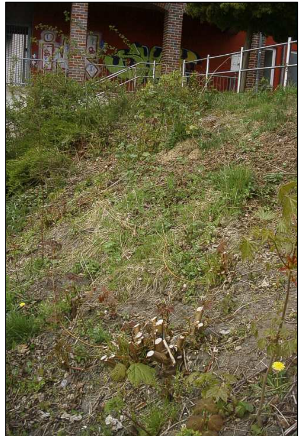
Foto 18: Böschung am Treppenaufgang nordwestlich Hotel nach Gehölzschnitt (Blickrichtung N; 28.04.2010)