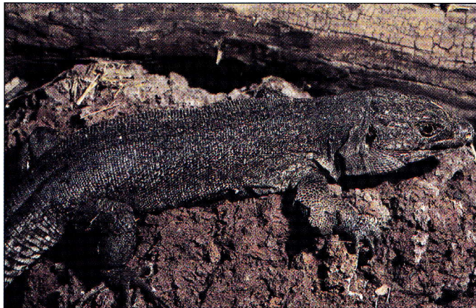
Ejemplar macho, Tenerife.