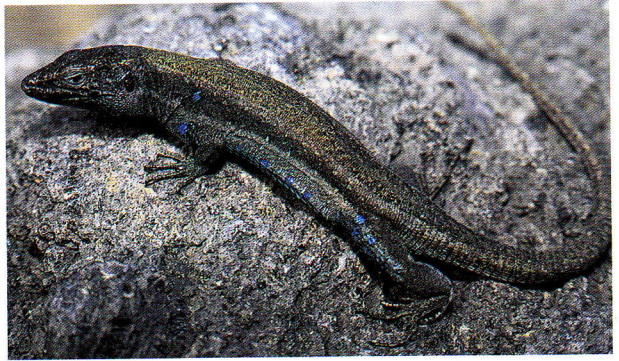
Macho de lagarto de Boettger o de Lehrs, forma «caesaris» (El Hierro).

En su área de distribución coincide con al menos otro lacértido: el lagarto gigante de El Hierro, del que se diferencia fácilmente por el tamaño, la coloración y por numerosas características foliódóticas. Hasta hace muy poco se consideraba al lagarto de Boettger como raza geográfica de Gallotia galloti , con la que pre-