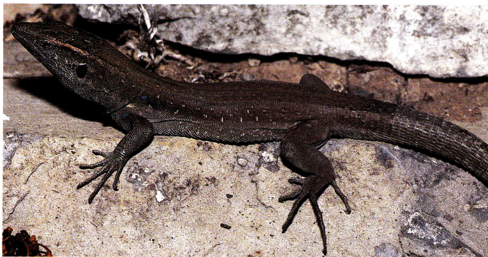
Macho de lagarto de Boettger o de Lehrs, forma «gomerae» (La Gomera).

Se reconocen dos subespecies de lagartos de Boettger: la primera de ellas, Gallotia caesaris caesaris , presente en El Hierro y en el Roque Grande de El Salmor, y la segunda, G. c. gomerae , restringida a la isla de La Go-