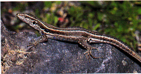
Hembra de lagarto de Boettger o de Lehrs, forma «caesaris» (El Hierro).

Entre sus depredadores habituales se cuentan cernícalos, ratas y gatos asilvestrados.