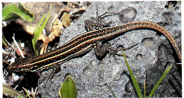
Lagarto de Boettger o de Lehrs, forma «caesaris», juvenil (El Hierro).

Como las demás especies de lacértidos, el lagarto de Boettger es diurno y heliotérmico. En las zonas bajas de las islas se mantiene activo prácticamente durante todo el año, aunque se han observado picos de mayor actividad durante el último mes de la primavera y de inactividad casi total en los meses más fríos y durante los períodos de sequía prolongada.